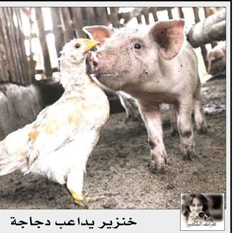
خنزير يداعب دجاجة

يثير عجل برأسين ولد قبل خمسة أشهر في شمال غرب البيرو الفلق والريبة في إحدى البلدات الواقعة في جبال الأنديس لكنه أصبح محط اهتمام الطلاب والأساتذة في جامعة محلية. وأوضح البروفسور خورخي بورتال الطبيب البيطري في جامعة كاخاماركا العامة، حيث يضع العجل لمرافقة متواصلة أنه ثنائي الرأس غير مكتمل مع دماغ واحد لكن مع وجهين وأربع أعين وقرن واحد. وأوضح الطبيب البيطري أن أسباب هذا التقوس النادر قد تكون متعددة وتتراوح بين مشاكل طفيليات وسوء تغذية والتسمم بمادة تستخدم في المزارع وغيرها. وهذا العجل الذي لا يمكن أن يتناول إلا الحليب بسبب مشاكل في النمو ولد في إحدى مزارع بلدة بامباركا حيث أثار في مرحلة أولى قلق السكان.