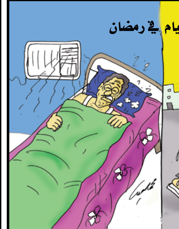
الصيام في رمضان

منى الله على عدن أمس بأمطار غزيرة ما أدى إلى تراكم المياه في الطرقات حتى المساء رغم الجهود التي بذلتها الجهات المختصة نأمل عمل ما يلزم حتى لاتتكرر مثل هذه الموقف.