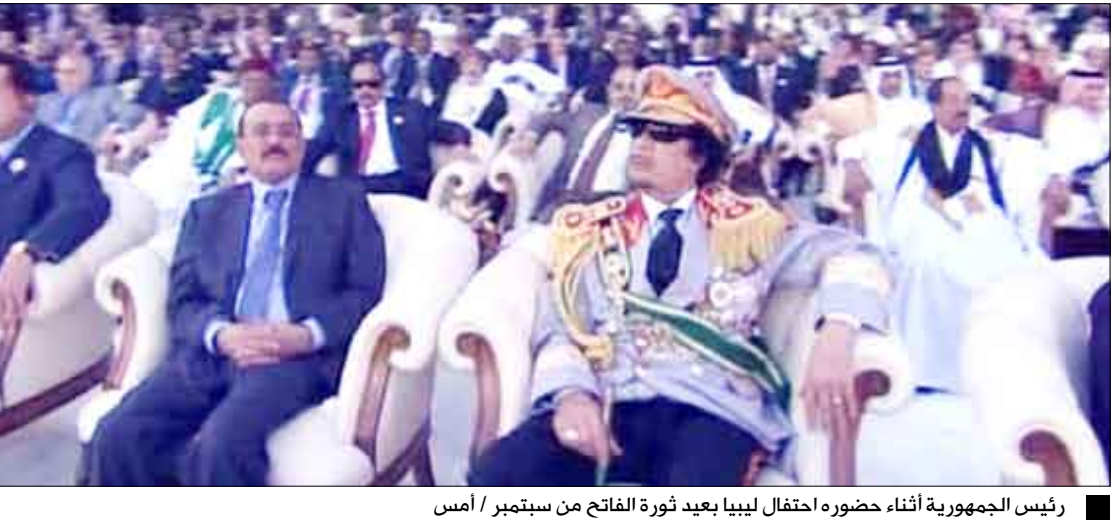
رئيس الجمهورية أثناء حضوره احتفال ليبيا بعيد ثورة الفاتح من سبتمبر / أمس

طرابلس / سبأ: حضر فخامة الأخ الرئيس علي عبدالله صالح رئيس الجمهورية مع أخيه قائد ثورة الفاتح من سبتمبر الليبية - رئيس الاتحاد الإفريقي العقيد معمر القذافي الاحتفال الكبير الذي أقيم مساءً أمس بالعاصمة طرابلس احتفاءً بالعيد الأربعين لثورة الفاتح من سبتمبر الليبية. وتضمن الاحتفال الذي حضره عدد من رؤساء وملوك وأعضاء الحكومات الشقيقة والصديقة ووفود رفيعة المستوى من مختلف أنحاء العالم، عرضاً عسكرياً شاركت فيه وحدات رمزية من القوات المسلحة لدول الاتحاد الإفريقي ودول شقيقة وصديقة، ووحدات رمزية من وحدات الشعب المسلح والأمن العام. كما تضمن الاستعراض عرضاً رمزياً لعدد من الأسلحة والأليات والمعدات ووحدات الشعب المسلح، وعرضا بحرياً وجوياً. وذكرت وكالة أنباء الجمهورية الليبية (أوج) أن الزعيم الليبي معمر القذافي ألقى كلمة من قاعدة إمعيتيق الجوية بطرابلس في الساعة الثانية والنصف (بالتوقيت المحلي) من صباح أمس. وأضافت الوكالة "أن هذا التوقيت هو ساعة الصفر التي تحركت فيها قوات التحرير الثورية، لتحرير هذه القاعدة التي كانت أكبر قاعدة أميركا خارج أراضيها. وقال القذافي في كلمته "إن المكان الذي نحن فيه الآن هو قاعدة إمعيتيق الجوية وقد كان اسمها قاعدة هوليس الجوية، هو هوليس ضابط أميركي قتل في باكستان أو أفغانستان أو في أي مكان آخر". وأضاف "عندما كنت ملازماً حاولت أن أدخل هذه القاعدة في محاولة لاستطلاعها من الداخل، لكن جاء العسكريون الأميركيون وأقفلوا البوابة في وجهي وقتلوا لهم أنا ضابط في الجيش الليبي 2 <<