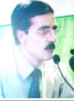
الشاعر العراقي / رمضان عيسى