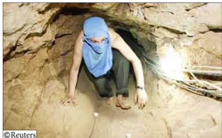
فلسطيني يعبر نفقا للتهريب في رفح جنوب قطاع غزة على الحدود مع مصر يوم 27 أبريل