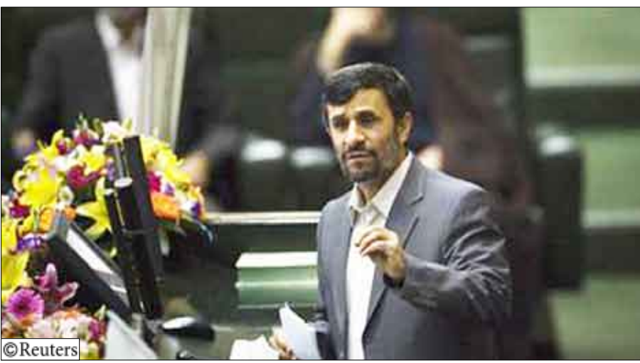
الرئيس الإيراني محمود احمدي نجاد في البرلمان بطهران أمس الأحد

وعمل مير كاظمي والمرشحان لوزارتي الاستخبارات والداخلية في الحرس الثوري شأنهم شأن أحمدي نجاد. وحقن الحرس الثوري المتمسك بشدة بيقين الجمهورية الإسلامية المزيد من النفوذ السياسي والاقتصادي فيما يبدو منذ تولي أحمدي نجاد منصبه قبل أربع سنوات. ويسيطر المحافظون على البرلمان لكن بعض أنصار أحمدي نجاد تخلوا عنه منذ الانتخابات حتى على الرغم من أنه يتمتع بمساندة الزعيم الأعلى آية الله علي خامنئي أعلى سلطة في إيران. فيما أشار خصوم الرئيس من المعتدلين إلى أن الانتخابات التي أجريت في 12 يونيو تم التلاعب فيها لصالحه ويرون أن الحكومة تفتقر للشرعية. وكانت السلطات قد نفت هذه الاتهامات، مؤكدة نفيها أيضا حدوث تزوير في الانتخابات. في غضون ذلك أبلغ أحمدي نجاد البرلمان أنه يعترم اتخاذ «خطوات مهمة إلى الأمام» خلال فترة حكمه الثانية التي تستمر أربعة أعوام بما في ذلك تطوير قطاع النفط الرئيسي وتشجيع المساواة الاجتماعية ودعم «الدول المقهورة» في العالم. وأوضح أن إيران ينبغي أن يكون لها تفاعل بناء مع جميع الدول فيما عدا الكيان الصهيوني غير الشرعي. في إشارة إلى إسرائيل عدو إيران اللدود. ويتضمن التشكيل الوزاري المقترح لأحمدي نجاد ثلاث نساء لوزارات التعليم والصحة والرعاية الاجتماعية ليصبح أول وزيرات في الجمهورية الإيرانية. وعلى السبيل نفسه أفاد النائب المحافظ كاظم ديلخوش لرويتزر أنه يعتقد أن البرلمان قد يرفض خمسة من الوزراء المعيّنين بينهم امرأتان.