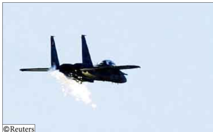
مقاتلة إسرائيلية تقصف قطاع غزة يوم 11 يناير