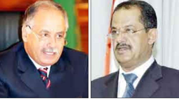
بعث رئيس مجلس الوزراء الدكتور علي محمد مجور برقية تهنئة إلى أمين اللجنة الشعبية العامة بالجمهورية الليبية الأثرية العظمى الشقيقة البغدادية على المحمودي بمناسبة احتفالات الشعب الليبي الشقيق بالعيد الأربعين لثورة الفاتح من سبتمبر.