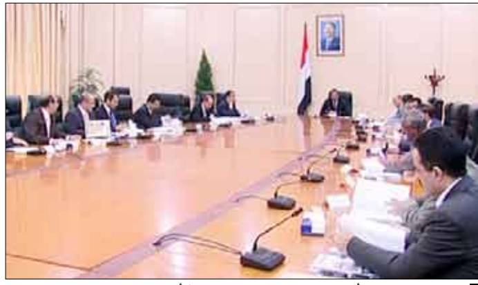
اجتماع المجلس الأعلى للسياسة برئاسة د. مجور / أمس

أقر المجلس الأعلى للسياسة في اجتماعه أمس برئاسة رئيس مجلس الوزراء الدكتور علي محمد مجور، مشروع الإستراتيجية الوطنية للتنمية السياحية 2010-2025م المقدم من وزير السياحة. وتهدف الإستراتيجية لتحقيق مجموعة من الغايات الرامية إلى تنمية الواقع السياحي وذلك من خلال مجموعة من السياسات والبرامج الرامية إلى تعزيز البناء المؤسسي لقطاع السياحة وتحديث أجهزة الإدارة السياحية وتزويدها بالكفاءات والمهارات التخصصية واستكمال إصدار وتحديث منظومة التشريعات السياحية إضافة إلى تطوير المنتج السياحي وتهيئة مناطق سياحية واعدة لمواكبة متطلبات الأنامط المختلفة للنشاط السياحي وكذلك تحفيز وزيادة الاستثمارات في هذا القطاع بما يتوافق والزيادة في أعداد السياح، عدا عن الارتقاء بجودة الخدمات السياحية بما يتلائم مع المواصفات الدولية وتقديم الخدمات اللازمة للسياح في المواقع السياحية والمحيط السياحي والعمل على زيادة عدد الموارد البشرية المؤهلة بما يتناسب والزيادة في حركة الاستثمارات السياحية. ووافق المجلس الأعلى على خطة وزارة السياحة لتنشيط السياحة في محافظة عدن للفترة 2010-2015م.