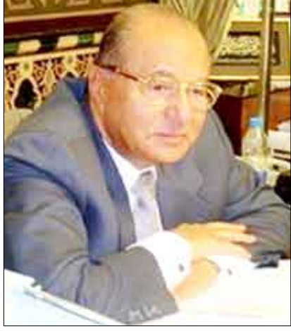
د. محمود حمدي زقزوق