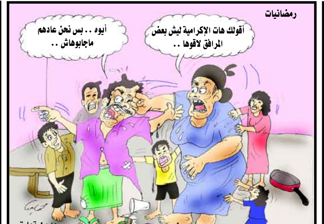
رمضانيات أقولك هات الإكرامية ليش بعض المرافق لا قوها.. أيوه.. بس نحن عادهم ماجاويهاش.. بدون تعليق

باختصار محمد الجراي يبدو أننا وصلنا إلى آخر الزمان، فيوم أبس تجرات واحدة من نسوان الخالفة على زوجها وكالت له اللطم والزبط والرفس من غير الرفس الآخر، وهذا كله علشان كل الموظفين في الخالفة تسلموا إكرامية رمضان وهو... لا. ولم ينفخ صراخ الأطفال أمام تلك المعركة التي كانت من طرف (على قولتهم الجنس الناعم) ولم ينفخ شرع الرجل لزوجته أن المرافق المستقلة مالي وإداريا دفعت لموظفيها إكرامية، أما المرتبطة بالموازنة فعادها (مدخله مخرجه). الزوجة لم تقنع واعتبرت زوجها كذاباً وقالت له: مشي الناس سواسية أمام القانون والدستور إذا لازم كلهم يلاقوا إكرامية وأنت لوتنتي تروح البيت لاترجع إلا والإكرامية بيك ولا خليك بالشوارع. اللهم عجل بالإكرامية ولاتؤجلها بقادر يا كريم.