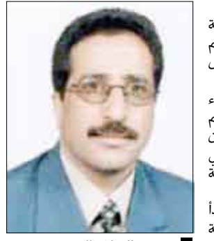
د. عبدالسلام الجوفي

أقرت وزارة التربية والتعليم بدء انتظام العاملين في الإدارات المدرسية وبدء عملية التسجيل والانتقال للطلاب للسنة الدراسية 2009م. 2010م ابتداء من يوم السبت الماضي 8 رمضان 1430هـ الموافق 29 أغسطس 2009م. وقال وزير التربية والتعليم الدكتور عبدالسلام الجوفي لوكالة الأنباء اليمنية (سبأ) إن التقويم المدرسي للعام الدراسي الجديد حدد بدء انتظام المدرسين في جميع المراحل الدراسية ابتداء من يوم السبت 15 رمضان الموافق 5 سبتمبر القادم، مؤكداً أهمية التزام العاملين والمعلمين في جميع المراحل الدراسية بالانضباط الوظيفي في جميع الإدارات المدرسية حسب التقويم المدرسي. وأوضح أن إجازة عيد الأظفار المبارك للإدارات المدرسية والمعلمين ستبدأ من يوم الخميس 20 رمضان الموافق 10 سبتمبر، على أن تبدأ الدراسة للفصل الدراسي الأول وانتهاء عمليات القيد والتسجيل