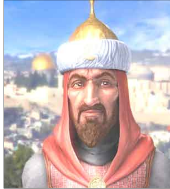
صلاح الدين الأيوبي

ميكرو فلم يفقد الأمل بل قام بالعديد من الإختراعات أبرزها طريقة برايل للقرأة والكتابة لدى العمي .