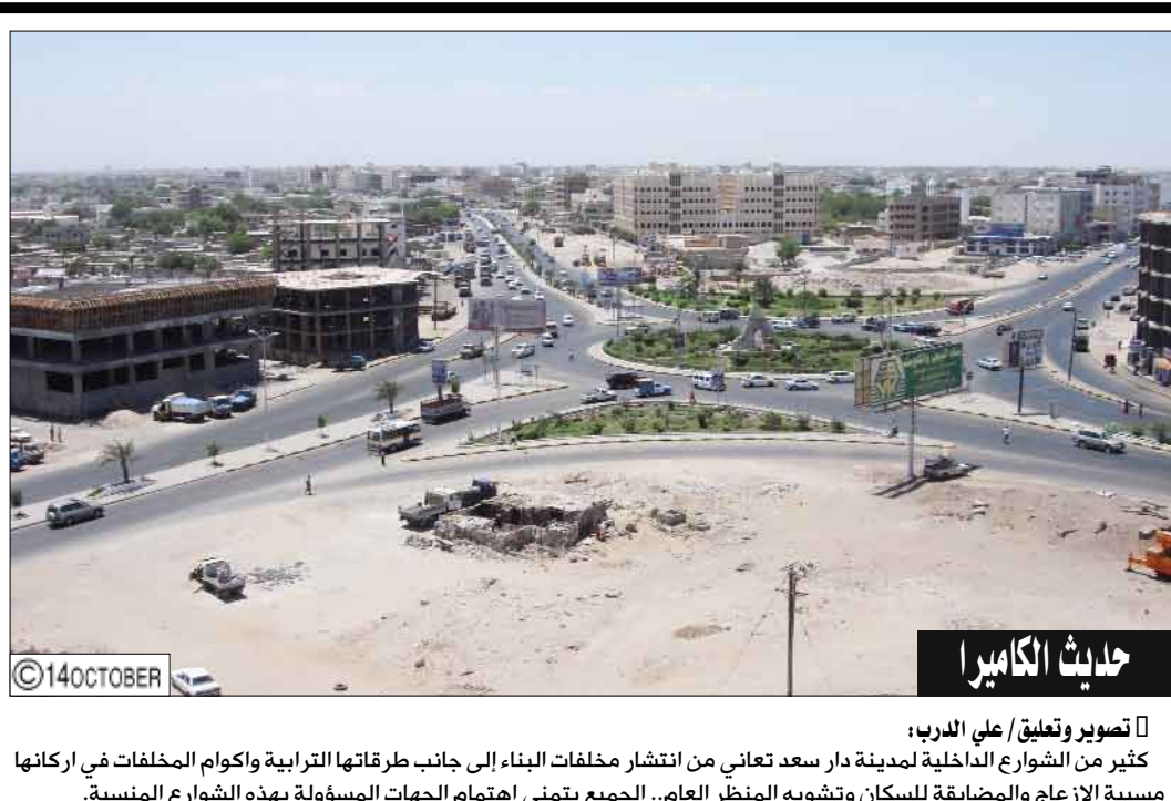
تصوير وتعليق علي الدرب: كثير من الشوارع الداخلية لمدينة دار سعد تعاني من انتشار مخلفات البناء إلى جانب طرقاتها الترابية واكوام المخلفات في اركانها مسببة الازعاج والمضايقة للسكان وتشويه المنظر العام.. الجميع يمتنى اهتمام الجهات المسؤولة بهذه الشوارع المنسية.

كانت دائما تود خلق شعرها ولكنها لا تستطيع بسبب القوة المودعة فيه، "أما اليوم فأنا أتخلى عنه من أجل الخير".