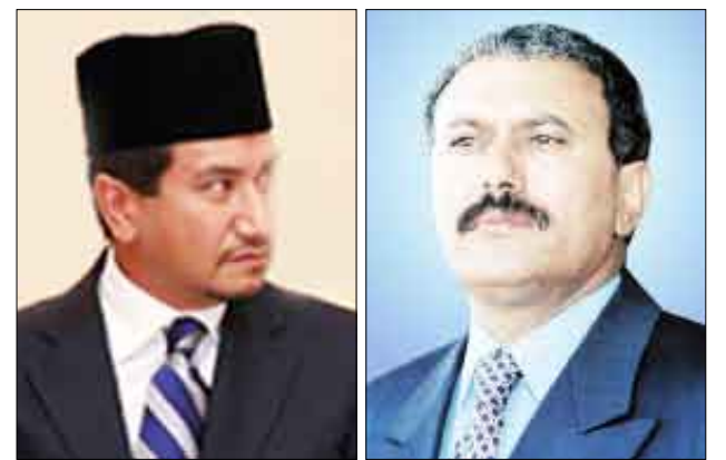
بعث فخامة الأخ الرئيس علي عبد الله صالح رئيس الجمهورية أمس برقية تهنئة إلى الملك توانكو ميزان زين العابدين ملك مملكة ماليزيا بمناسبة احتفالات الشعب الماليزي بالعيد الوطني.