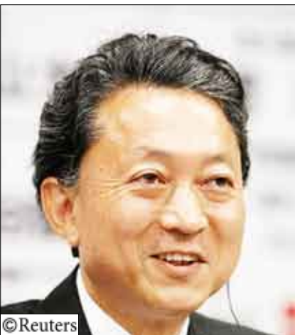
زعيم الحزب الديمقراطي المعارض يوكيو هاتوياما يتحدث إلى الصحفيين بمقر الحزب في طوكيو يوم أمس الأحد