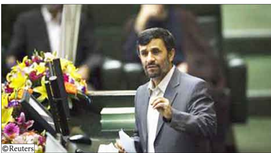
الرئيس الإيراني محمود أحمدى نجاد في البرلمان بطهران أمس الأحد

حين تقول إيران: إن الغرض الوحيد من برنامجها هو توليد الكهرباء. وعمل مير كاظمي والمرشحان لوزارتي الاستخبارات والداخلية في الحرس الثوري شأنهم شأن أحمدى نجاد. وحقق الحرس الثوري المتمسك بشدة بيقم الجمهورية الإسلامية المزيد من النفوذ السياسي والاقتصادي فيما يبدو منذ تولى أحمدى نجاد منصبه قبل أربع سنوات. ويسيطر المحافظون على البرلمان لكن بعض أنصار أحمدى نجاد تخلوا عنه منذ الانتخابات حتى على الرغم من أنه يتمتع بمساندة الزعيم الأعلى آية الله علي خامنئي أعلى سلطة في إيران. فيما أشار خصوم الرئيس من المعتدلين إلى أن الانتخابات التي أجريت في 12 يونيو تم التلاعب فيها لصالحه ويرون أن الحكومة تفتقر للشرعية. وكانت السلطات قد نفت هذه الاتهامات، مؤكدة نفيها أيضاً حدوث تزوير في الانتخابات. في غضون ذلك أبلغ أحمدى نجاد البرلمان أنه يعترم اتخاذ «خطوات مهمة إلى الأمام» خلال فترة حكمه الثانية التي تستمر أربعة أعوام بما في ذلك تطوير قطاع النفط الرئيسي وتشجيع المساواة الاجتماعية ودعم «الدول المقهورة» في العالم. وأوضح أن إيران ينبغي أن يكون لها تفاعل بناء مع جميع الدول فيما عدا الكيان الصهيوني غير الشرعي. في إشارة إلى إسرائيل عدو إيران اللدود. ويتضمن التشكيل الوزاري المقترح لأحمدى نجاد ثلاث نساء لوزارات التعليم والصحة والرعاية الاجتماعية ليصبح أول وزيرات في الجمهورية الإيرانية. وعلى السبيل نفسه أفاد النائب المحافظ كاظم ديلخوش روبرتزر أنه يعتقد أن البرلمان قد يرفض خمسة من الوزراء المعينين بينهم امرأتان.