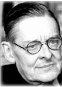
الشاعر الإنجليزي توماس البيوت

أين تكون الكلمة، أين تدوي هاتج البحر، في الجزر، على اليابسة في أرض المطر، أو أرض الرمل هنا، لا صمت يكفي أولئك الذين يسبرون أنحاء النهار وآناء الليل الزمن الصحيح غائب و المكان الصحيح غائب وتخلق العين العمياء أشكالاً فارغة بين الأبواب العاجية وتسترجع المالح للأرض الرملية هذا هو مكان الوحدة حيث تعبر الأحلام بين الصغور الرزق هذا هو زمن التوتيرين الموت والولادة.