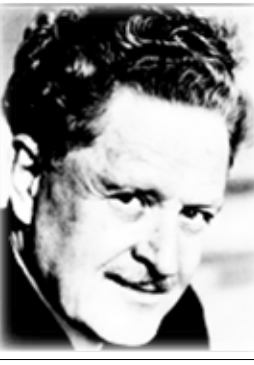
الشاعر التركي / ناظم حكمت