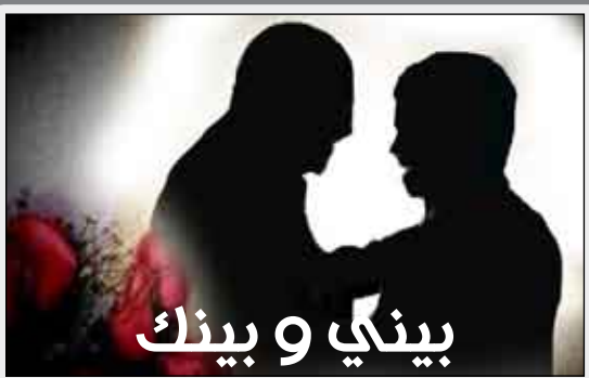
بينكي و بينك