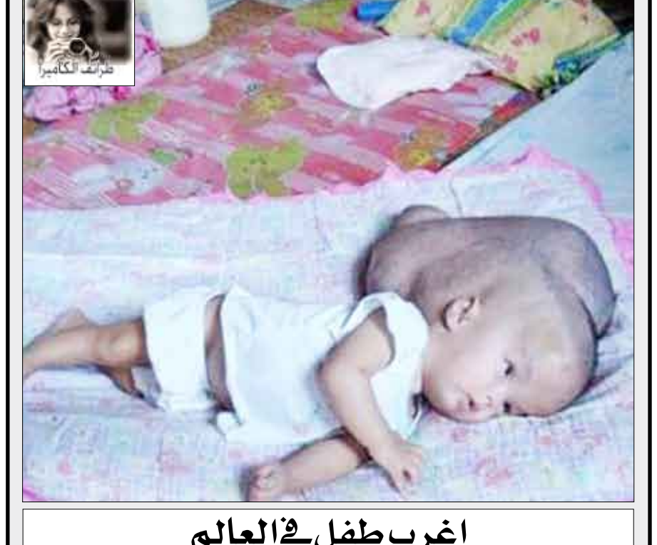
اغرب طفل في العالم

عند اكتمال واستخلاص الاسمين أو محتوى العمودين المذكورين اعلاه يسجل لديكم ويجمع حتى نهاية الشهر الكريم وترسل الإجابات على عناوين الصحيفة فيصبح عدد الإجابات 30×60 = 60 أسما أو محتوى. يرفق كويون المسابقة مع كل حل شبكة حسب رقم الحلقة. الفائزون سينالون جوائز مالية مغرية.