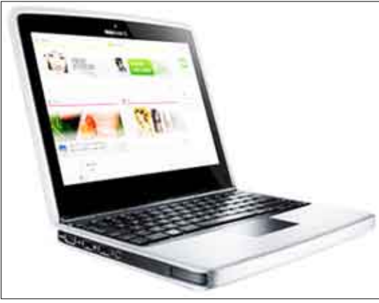
"ليل"، فضلا عن إطلاق "نوكيا" أيضا "97" الذي من المفترض أن يشكل منافسة على صعيد الهواتف الذكية.