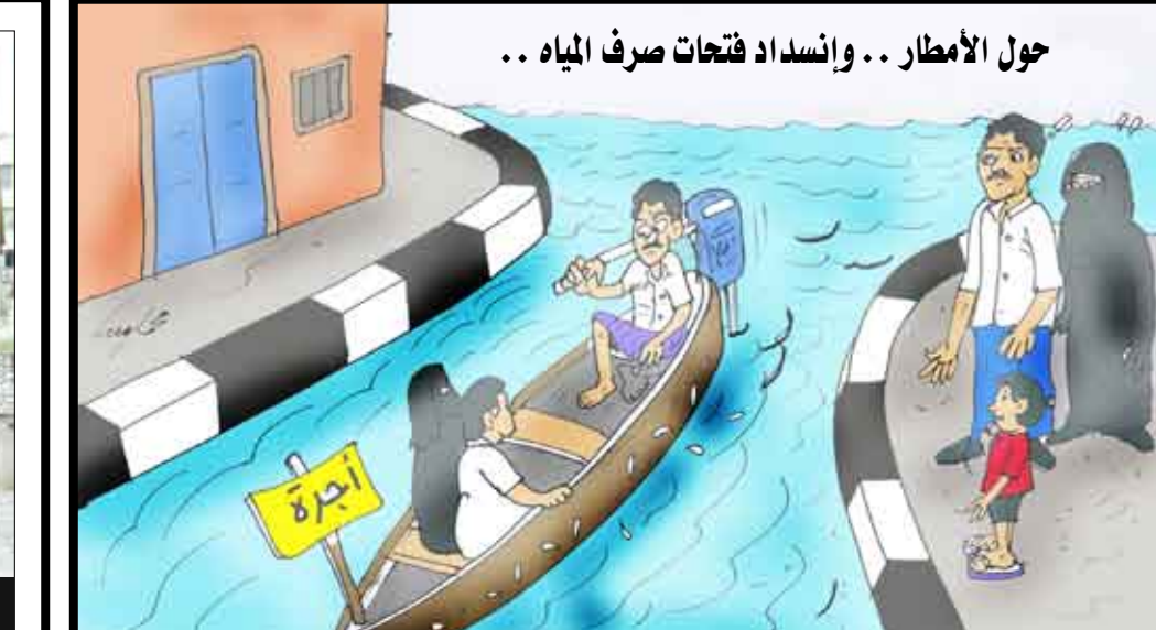
حول الأمطار .. وإنساد فتحات صرف المياه ..

بسبب السفلة فوق مصارف مياه الأمطار تجتمعت مياه الأمطار والمجاري مسببه عرقلة في الطرقات وإغراق بعض المحلات التجارية ما تسبب بخسائر مادية لأصحابها برغم أنها لم تكن غزيرة فلو اشتدت فما عساها أن تفعل ؟