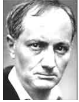
الشاعر الفرنسي شارل بودييه