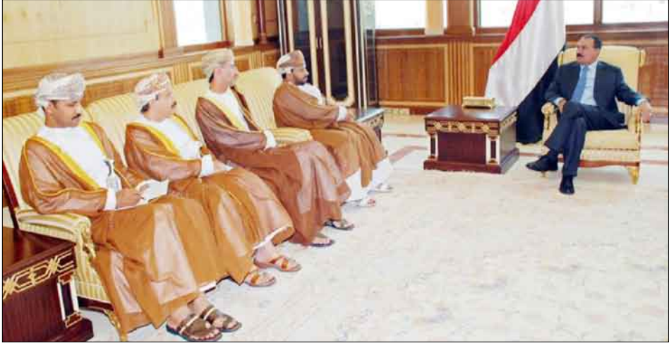
.. ويستقبل مبعوث جلالة السلطان قابوس

الرئيس رسالة من أخيه جلالة السلطان قابوس بن سعيد تتعلق بالعلاقات الأخوية ومجالات التعاون المشترك بين البلدين الشقيقين بالإضافة إلى المستجدات التي تهم البلدين والأمة العربية.. كما تضمنت الرسالة الاطمئنان على صحة فخامة الأخ الرئيس والتمنيات القلبية له بموفق الفصحى والعافية وكذا الاطمئنان على الأوضاع في