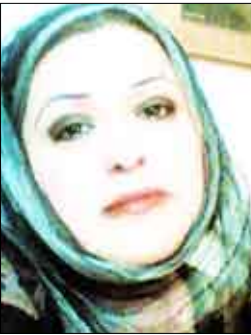
الشاعرة/ ابتهاج بلبل