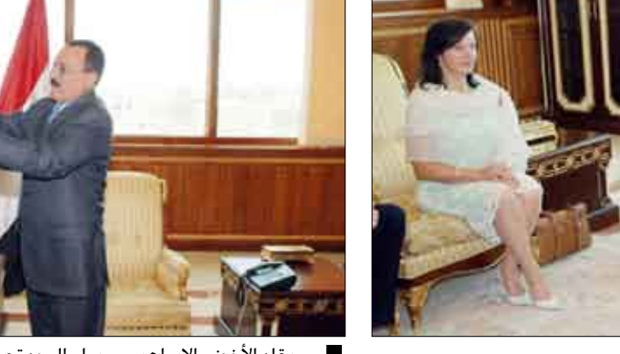
.. ويقلد الأخضر الإبراهيمي وسام الوحدة من الدرجة الأولى