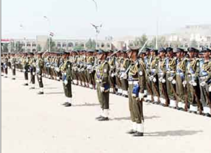
رئيس الجمهورية يخاطب أفراد القوات المسلحة الميامين