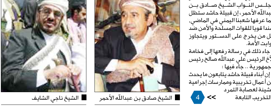
الشيخ صادق بن عبدالله الأحمر | الشيخ ناجي الشايف

صادق الأحمر والشايف يعلنان وقوف قبائل حاشد وبكيل بجانب الدولة في تصديدها للتمرد بصعدة