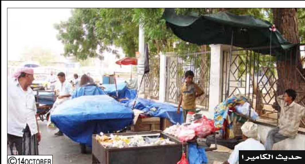
حديث الكاميرا المفرشون يغلقون الطريق إلى باب نقابة الصحفيين فرع عدن وهذا يسبب ازعاجاً للمارة لذا نأمل من الجهات ذات العلاقة عمل مايلزم.