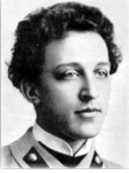
الشاعرة الروسية الكسندر بلوك

اقتراب، ملامسة، هرب الاحتراق الداخلي انهكني نحن التقينا في ضباب المساء مثل عصفورين عاشقين لكن جناحي المبلول بالبهزيمة قضم صوتي المبحوح. الشوق، والعشق، والزعل لمعت، أصابت، تألأت وصوت الجنازة القريب ضحّ في مشاعري كمجذاف مكسور.