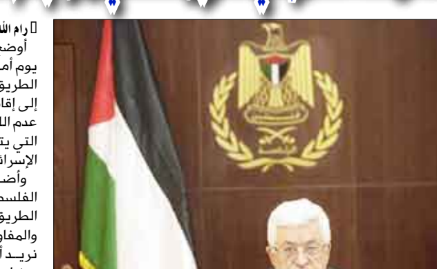
الرئيس الفلسطيني محمود عباس يرأس اجتماع اللجنة التنفيذية لمنظمة التحرير الفلسطينية في رام الله بالاضافة الغربية يوم السبت

وأضاف عباس في اجتماع للحكومة الفلسطينية: "نحن طلاب سلام. نحن نقول الطريق الأساسي والوحيد هو طريق السلام والمفاوضات. ليس لدينا أي طريق آخر ولا نريد أن نستعمل أي طريق. نريد سلاماً مبنياً على العدل والشريعة الدولية من خلال طولة المفاوضات ومن خلال القوانين الدولية ومن أسسها خطة خارطة الطريق".