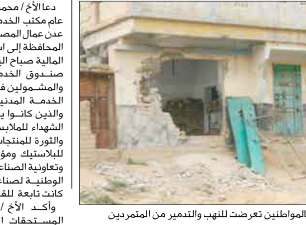
ممتلكات خاصة بالمواطنين تعرضت للنهب والتدمير من المتمردين

تواصل القوات المسلحة والأمن عملياتها البطولية في ذلك معقل وأوكر عناصر التخريب والتمرد والإرهاب في محافظة صعدة بنجاح كبير.