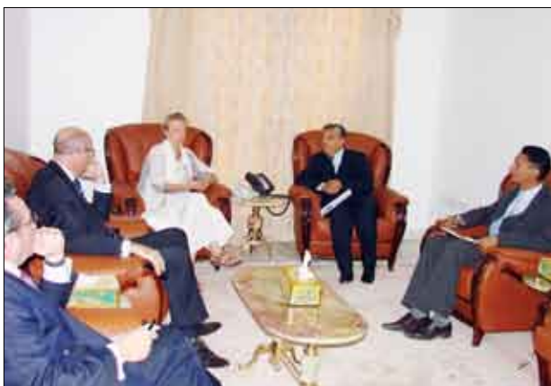
مدير مكتب رئيس الوزراء خلال لقائه الوفد الفرنسي

للمواقع التي يوجد فيها الصندوقان تطليل تحديد نوع المعونات المطلوبة في استكمال البحث.. مشيرة بهذا الصدد إلى أن الحكومة الفرنسية وجهت باستئجار سفينة متخصصة مزودة بروبوت متطور فيه كل إمكانيات البحث والتصوير والمسح لتتمكن من النزول إلى أعماق كبيرة في البحر تزيد على 1200 متر وتحديد موقعي الصندوقين وانتشالهما والتي ستتم إلى الموقع في اليومين القادمين.