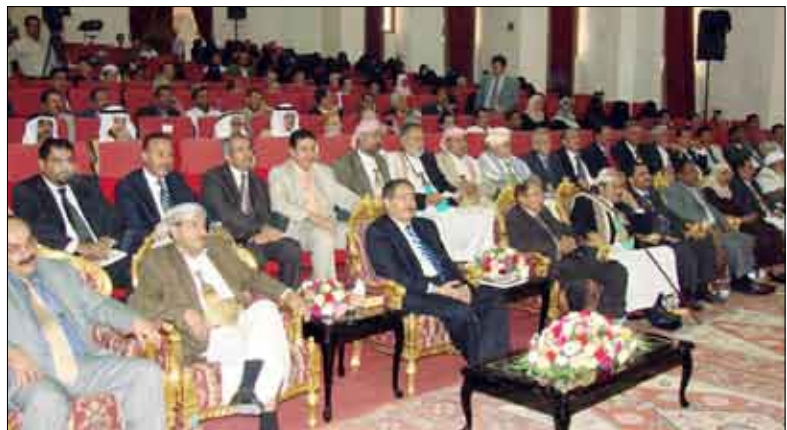
عبدالعزيز عبدالغني يبدشن الحملة الوطنية لدعم مرضى السرطان

دشن أمس بصنعاء الحملة الوطنية لدعم مرضى السرطان 2009م، وفي الحفل الذي أقيم برعاية فخامة الرئيس علي عبدالله صالح رئيس الجمهورية بقصر الشباب تحت شعار "يكرم تحيا الحياة" أعلن الأستاذ/ عبدالعزيز عبدالغني رئيس مجلس الشورى عن تبرع فخامة الأخ الرئيس علي عبدالله صالح بعشرة ملايين ريال لصالح مرضى السرطان.