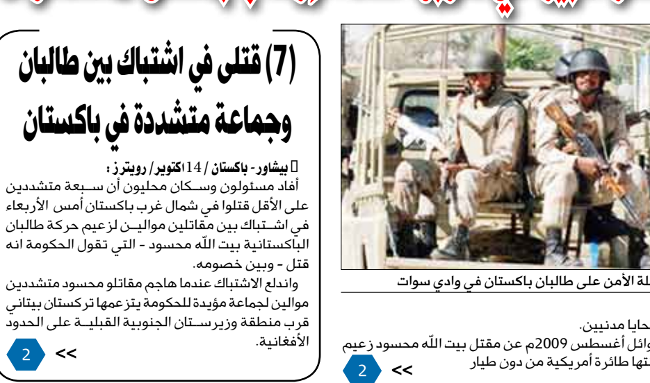
من حملة الأمن على طالبان باكستان في وادي سوات

بعد مرور أكثر من شهرين على بدء باكستان عملية عسكرية موسعة وشاملة في منطقة وادي سوات، وبعد خلافات طويلة مع واشنطن حول طبيعة الغارات الجوية التي تشنها على منطقة الحدود القبلية مع أفغانستان نجح التمركز العسكري وتخفف من حدة الانقسام مع واشنطن بسبب غاراتها الجوية التي غالبا ما تسفر عن سقوط ضحايا مدنيين. فقد أعلنت المخابرات الباكستانية في أوائل أغسطس 2009م عن مقتل بيت الله محسود زعيم حركة طالبان باكستان في غارة جوية شنتها طائرة أمريكية من دون طيار