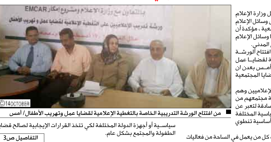
من افتتاح الورشة التدريبية الخاصة بالتغطية الإعلامية لقضايا عمل وتهريب الأطفال / أمس

سياسية أو أجهزة الدولة المختلفة لكي تتخذ القرارات الإيجابية لصالح قضايا الطفولة والمجتمع بشكل عام.