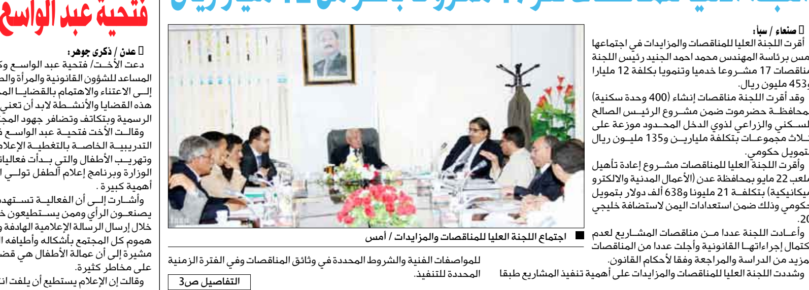
اجتماع اللجنة العليا للمناقصات والمزايدات / أمس

وأعدت اللجنة عددا من مناقصات المشاريع لعدم اكتمال إجراءاتها القانونية وأجلت عددا من المناقصات لمزيد من الدراسة والمراجعة وفقا لأحكام القانون. وشددت اللجنة العليا للمناقصات والمزايدات على أهمية تنفيذ المشاريع طبقا للمواصفات الفنية والشروط المحددة في وثائق المناقصات وفي الفترة الزمنية المحددة للتنفيذ.