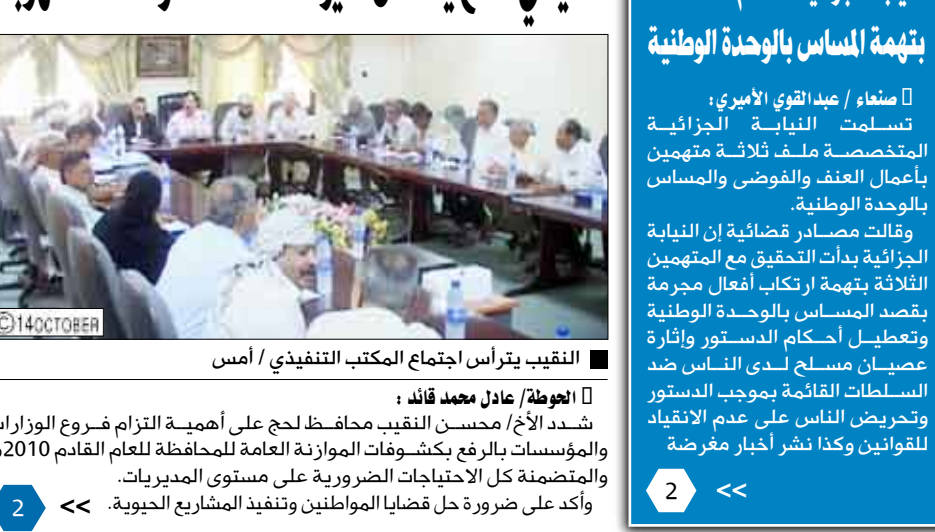
التقريب يترأس اجتماع المكتب التنفيذي / أمس

شدد الأخ/ محسن النقيب محافظ لبحر على أهمية التزام فروع الوزارات والمؤسسات بالرفع بكثافة الموانع العامة للمحافظة للعام القادم 2010م والمتضمنة كل الاحتياجات الضرورية على مستوى المديرية. وأكد على ضرورة حل قضايا المواطنين وتنفيذ المشاريع الحيوية.