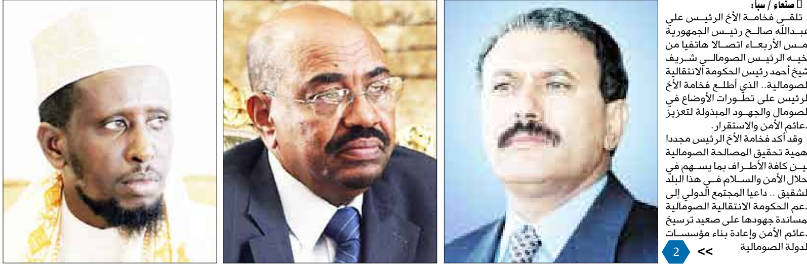
تلقى فخامة الأخ الرئيس علي عبدالله صالح رئيس الجمهورية أمس الأربعاء اتصالا هاتفيا من أخيه الرئيس الصومالي شريف شيخ أحمد رئيس الحكومة الانتقالية الصومالية. الذي أطلع فخامة الأخ الرئيس على تطورات الأوضاع في الصومال والجهود المبذولة لتعزيز دعائم الأمن والاستقرار. وقد أكد فخامة الأخ الرئيس مجددا أهمية تحقيق المصالحة الصومالية بين كافة الأطراف بما يسهم في إحلال الأمن والسلام في هذا البلد الشقيق. داعيا المجتمع الدولي إلى دعم الحكومة الانتقالية الصومالية لمساندة جهودها على صعيد ترسيخ دعائم الأمن وإعادة بناء مؤسسات الدولة الصومالية