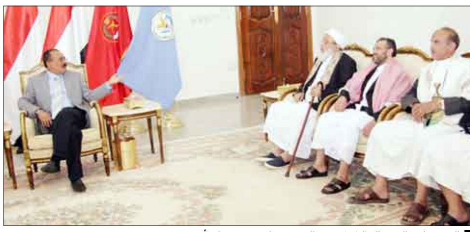
الرئيس لدى استقباله الشيخ محمد المؤيد ومرافقه محمد زايد أمس

استقبل فخامة الأخ الرئيس علي عبدالله صالح رئيس الجمهورية أمس الشيخ محمد علي المؤيد ومرافقه محمد زايد الذين وصلا صباح أمس إلى أرض الوطن عنادين من الولايات المتحدة الأمريكية بعد الإفراج عنهما نهاية الأسبوع الماضي. وقد رحب فخامة الأخ الرئيس بالشيخ المؤيد ومرافقه، وهما بعد عودتهما سالمين إلى أرض الوطن وبالإفراج عنهما بعد الاحتجاز اللا قانوني والمنافي لمبادئ العدالة وحقوق الإنسان الذي تعرض له. وأعتبر فخامة الأخ الرئيس إطلاق سراحهما بأنه انتصار للعدالة ولحقوق الإنسان وثمره لجهود اليمن ومتابعتها المستمرة لقضيتها منذ الأيام الأولى للاحتجاز، معبرا في الوقت ذاته ذاته عن شكره وتقديره لتفهم واستجابة الإدارة الأمريكية وخاصة في عهد الرئيس باراك أوباما لمطالب اليمن بالإفراج عنهما انطلاقا من يقين وإدراك اليمن لبراءتهما من أي تهم نسبت إليهما.