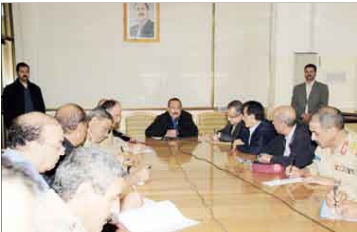
اللجنة الأمنية برئاسة فخامة رئيس الجمهورية أمس الأول

صنعاء / سيا: وقفت اللجنة الأمنية العليا في اجتماعها أمس أمام تطورات الأوضاع في محافظة صعدة.. في ضوء استمرار عناصر التمرد والإرهاب والتخريب في أعمالها العنصرية والإجرامية والتخريبية.. وعدم انصياعها لنداء السلام الذي أعلنته الدولة.. وكذا عدم التزامها بقرار وقف العمليات العسكرية الذي أعلنه فخامة الأخ الرئيس علي عبدالله صالح رئيس الجمهورية القائد الأعلى للقوات المسلحة في 17 يوليو من العام الماضي حقنا للدماء، وتهينة للأجواء الكفيلة بترسيخ الأمن والاستقرار ومواصلة عجلة التنمية في المحافظة واستكمال إنجاز المشاريع الخدمية التي تحتاجها محافظة صعدة.. وتبلي تطاعات المواطنين. كما وقفت اللجنة الأمنية العليا أمام مناقشة السلطة المحلية بالمحافظة للدولة والحكومة