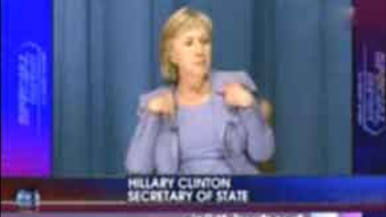
وزيرة الخارجية الأمريكية هيلاري كلينتون

الكونغو/ متابعات: قامت وزيرة الخارجية الأمريكية هيلاري كلينتون، والتي عادة ما تكون هادئة أمام الناس بزجر طالب كونغولي سألها عن آراء زوجها في قضية تتعلق بالسياسة الخارجية قائلة "زوجي ليس وزيرا للخارجية بل أنا". فبعد وصول كلينتون عصر أمس الأول الاثنين إلى الكونغو، في إطار جولتها على 7 بلدان أفريقية، اجتمعت بطلاب وطرح أحد الطلاب سؤالا على وزيرة الخارجية الأمريكية قائلا "حصل تدخل من قبل البنك الدولي والصين (...) ما رأي السيد كلينتون بهذا الشأن؟"، ملحما إلى العقود التي أبرمت بين الصين وجمهورية الكونغو الديمقراطية.