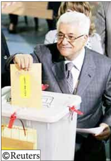
الرئيس عباس يدي بصوته في انتخابات فتح الأحد الماضي

بيت نعم (الضفة الغربية) 14 أكتوبر/رويترز: يبدو أن حركة فتح الفلسطينية عززت سلطة الرئيس محمود عباس واستعدادت الشرعية مع الناخبين أمس الثلاثاء بالتخلص من عدد كبير من "الحرس القديم" الذي هيمن عليها أثناء زعامة الرئيس الفلسطيني الراحل ياسر عرفات. وذكر محللون أن عباس (74 عاما) قام بالدعوة إلى عقد أول مؤتمر عام لحركته منذ 20 عاما وفاز عندما انتخب 2300 عضولا لجنة تنفيذية أصغر سنا ستجسد شباب فتح وتعزز وضعه كزعيم. ويعتقد أعضاء بارزون في فتح أن الحركة أصبحت الآن في وضع أفضل من أجل المصالحة مع خصمها اللدود حماس الإسلامية التي تسطيح على قطاع غزة واستعادة جزء من الوحدة للقضية الفلسطينية المقسمة.