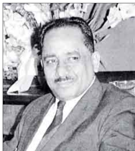
الشهيد قحطان الشعبي