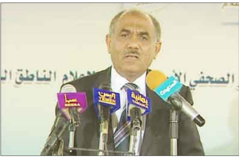
وزير الإعلام في المؤتمر الصحفي أمس

صنعاء/ سيا: كشف الناطق الرسمي باسم الحكومة وزير الإعلام حسن اللوزي عن توجهات جديدة لدى الدولة لتفعيل آلية العمل داخل الحكومة وأجهزتها المختلفة. مؤكداً أن هذه التوجهات تستلص الحكومة في الأيام القادمة عبر رسالة توضيحية بحسب النهج القيادي المتبع للوقوف أمامها في المجلس ومناقشتها. وقال في مؤتمره الصحفي الأسبوعي أمس بصنعاء: إن هذه التوجهات سيتم الشروع في تنفيذها قريبا إلى جانب ما يصل الحكومة من توجيهات من قبل رئيس الجمهورية تتعلق بتنفيذ البرنامج الانتخابي وتنفيذ برامج الحكومة والتصدي للقضايا الجوهرية وبالبلغة الأهمية. وقدم الوزير سردا لمصادر وبنود الوثيقة التي تركز في أول توجهاتها على تعزيز دور الحكومة وتطوير إمكانياتها من خلال تمكين قدرات جديدة للقيام بتحمل مسؤوليات في النطاق الحكومي. وأعتبر هذه الأولويات والتوجهات ذات أهمية كونها ستكفل حل جانب من مشكلاتي الفقر والبطالة وتوفير جزء من التمويل المطلوب عبر قرارات ذاتية والاستثمار المتاح وإيقاف بعض الإنفاق الذي يعد إهدارا في بعض القطاعات واختيار وسائل أقل كلفة.