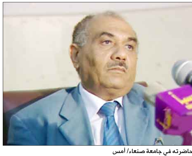
اللوزي يلقي محاضرته في جامعة صنعاء/أمس

صنعاء / سيا: أكد وزير الإعلام حسن اللوزي أن الوحدة اليمنية محمية بإرادة الشعب وشبابها الواعي بقيمتها وما تمثله من نواة لتحقيق وحدة أعم وأشمل لتتحم فيها أجزاء الوطن العربي للخروج من واقع الشتات الراهن الذي تعيشه دوله وشعبوه. جاء ذلك في محاضرته المعنونة بـ "الوحدة الأصل في التاريخ.. وحضارة المستقبل" التي ألقاها أمس بجامعة صنعاء أمام المشاركين في المخيم الوطني الصيفي الثاني الذي تنظمه الجامعة معيراً بالوحدة اليمنية نصر العودة إلى الحياة الحرة والكرامة في كمال الهيئة الوطنية راسخة الجذور منذ أول التاريخ اليمني الحضاري. واستعرض حسن اللوزي في محاضرته مراحل تحقيق الوحدة اليمنية في العصر الحديث قبيل العام 1990م وما شهدته اليمن من عمل وطني ذووب وإبرز محطات العمل في طريق الوصول إلى إعلان الوحدة وقيام الجمهورية اليمنية في 22 مايو 1990م. والتي كانت هدفاً استراتيجياً للثورة اليمنية 26 سبتمبر و 14 أكتوبر وقدم الشعب من أجلها أعلى التضحيات منوها بموقف الشعب اليمني بكل أطيافه وأفراده في الدفاع عن الوحدة حين تعرضت للضرر والخيانة في العام 1994 بفعل دوافع مغايرة للشعب ووحدة الوطن.