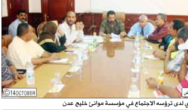
د. الجفري لدى ترؤسه الاجتماع في مؤسسة موانئ خليج عدن

عن/ واد سهيل: وجه الدكتور/ عدنان عمر الجفري محافظ عدن بصرف كافة مستحقات عمال رصيف الحاويات في الملاح من علاوات وبدل خطورة عمل والزمام شركة دبي بتنفيذ ما تم الاتفاق عليه عبر مؤسسة موانئ خليج عدن باعتبار عمال رصيف الحاويات في الملاح معارين وتنسري عليهم أي مستحقات أسوة بعمال