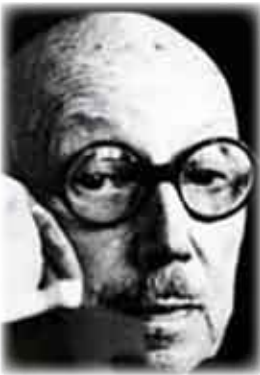
الشاعر الفرنسي / بيير جان جوف