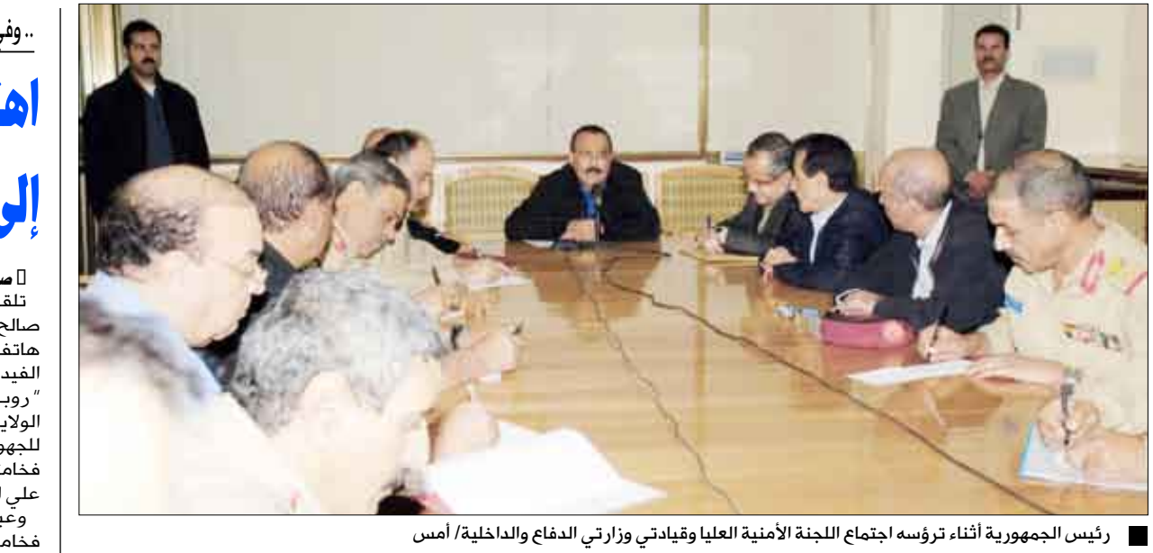
رئيس الجمهورية أثناء ترؤسه اجتماع اللجنة الأمنية العليا وقيادتي وزارتي الدفاع والداخلية/أمس

القضية. وقال: "إن هذا الاهتمام كان سبباً رئيسياً في الوصول إلى قرار إطلاق سراح المؤيد وزايد". من جانبه عبر فخامة الأخ رئيس الجمهورية عن شكره لحكومة الولايات المتحدة ومكتب التحقيقات الفيدرالي الأمريكي على التعاون والاستجابة للجهود التي بذلتها فخامتكم لتتابع هذه القضية وتكفل الوصول إلى الإفراج عن الشيخ محمد المؤيد ومرافقه محمد زايد.