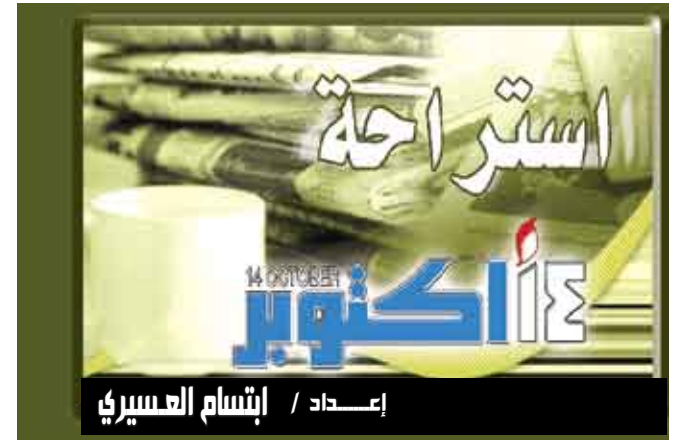
إعداد / إنشام العسيري