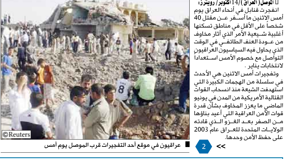
عراقيون في موقع أحد التفجيرات قرب الموصل يوم أمس

الموصل (العراق) 14 أكتوبر / رويترز: انفجرت قنابل في أنحاء العراق يوم أمس الاثنين ما أسفر عن مقتل 40 شخصاً على الأقل في مناطق تسكنها أغلبية شيعية الأمر الذي أثار مخاوف من عودة العنف الطائفي في الوقت الذي يحاول فيه السياسيون العراقيون التواصل مع خصوم الأمم استعداداً لانتخابات يناير. وتفجيرات أمس الاثنين هي الأحدث في سلسلة من الهجمات الكبيرة التي استهدفت الشيعة منذ انسحاب القوات القتالية الأمريكية من المدن في يونيو الماضي ما عزز المخاوف بشأن قدرة قوات الأمن العراقية التي أعيد بناؤها من الصفر بعد الغزو الذي قادته الولايات المتحدة للعراق عام 2003 على حفظ الأمن وحدها.