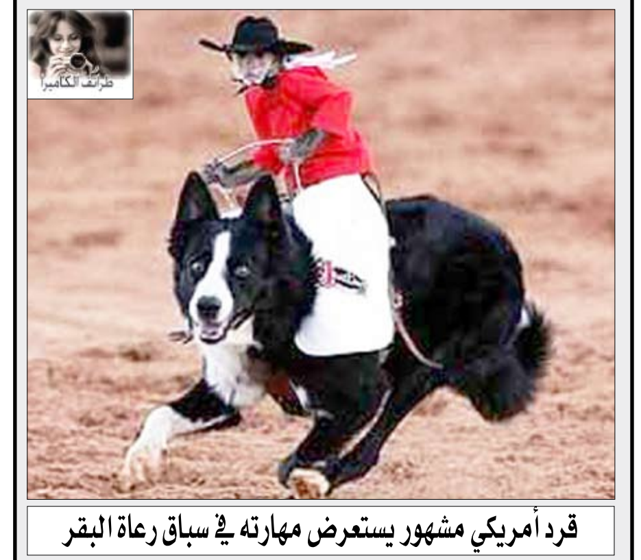
قرد أمريكي مشهور يستعرض مهارته في سباق رعاة البقر