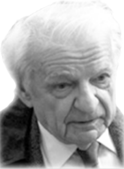
الشاعر الفرنسي إيف بونفوا