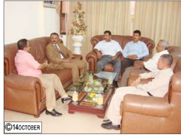
السكنية ببيع الأراضي التي صرفت لها ومن ضمنها الجمعية السكنية للصحفيين في مؤسسة (14 أكتوبر).