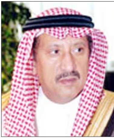
الأمير تركي بن ناصر بن عبد العزيز