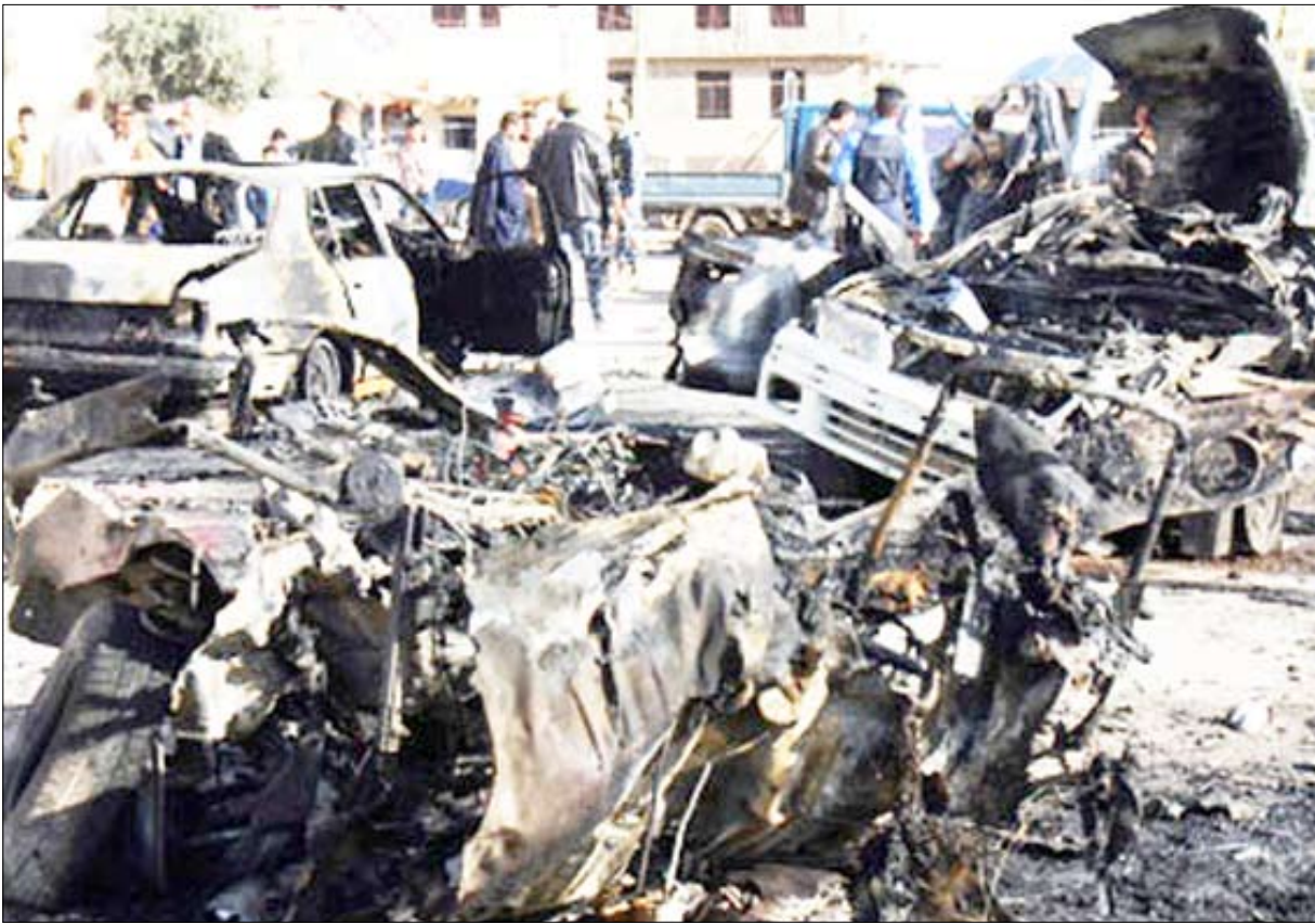
الموصل شهدت العديد من التفجيرات في الفترة الماضية

على التبرع بالدم وطالبت المركبات التي تستخدم في التشييد والبناء برفع الحطام الذي يحاصر ضحايا الهجوم. من جهته وصف المتحدث باسم القوات الأمريكية في شمالي العراق هجوم الموصل بأنه يأتي ضمن إستراتيجية تهدف لإضعاف السلطة بالمحافظات العراقية وكذلك دور القوات الأمنية فيها، وتغذية التوتر العرقي.