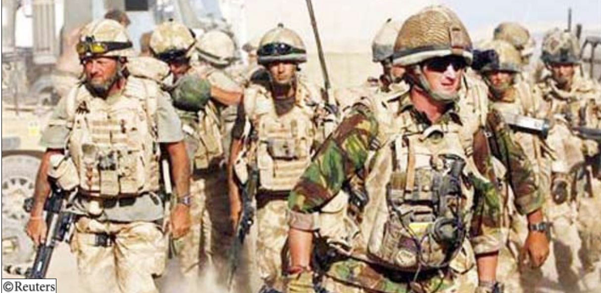
جنود بريطانيون خلال عملية عسكرية في إقليم هلمند بجنوب أفغانستان

يعرفوا أن هذا لا يعني تخليها عن المنطقة. ولعت في الإشارة إلى انسحاب القوات الغربية من أفغانستان بعد الموقعة من بينها التنمية والحكم وأصلاح قطاع الأمن". وأضاف "ستطور دور الجيش لكن العملية برمتها قد تستغرق ما بين 30 و40 عاما". وقال انه من غير الممكن في الإطلاق ان يسحب حلف شمال الاطلسي قواته من أفغانستان قبل أن تصبح قوات الامن الافغانية مستعدة. وقال للصحيفة "مثلما حدث في العراق خرجنا عسكريا لكن الشعب الافغاني وأعداءنا يجب أن