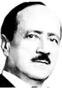
الشاعر الفرنسي / سان جون بيرس