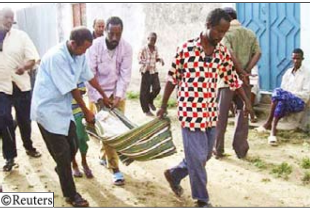
صوماليون يحملون جثة صبي قتل في معارك بين مسلحين مساء أمس السبت جنوبي العاصمة الصومالية مقديشو.