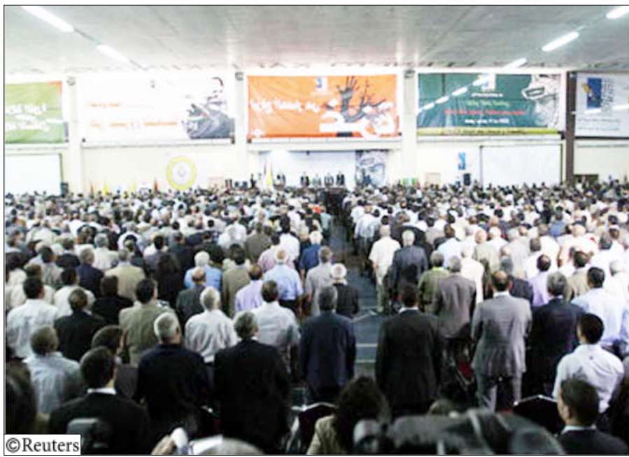
من وقائع مؤتمر فتح يوم أمس

أساليبها الملائمة ووقتها المناسب، رافضا الانجرار إلى ما يمكن أن يسيء إلى جد صمود ونضال فتح، على حد قوله. ويخصوص العلاقة مع إسرائيل، قال عباس إن رئيس الوزراء الإسرائيلي بنيامين نتنياهو يحاول حرفاً أنظار العالم من خلال اقتراح تسهيلات اقتصادية بديلاً عن الحقوق السياسية. وأضاف أن الهدف الوطني الأسمى هو الاستقلال وإقامة دولة فلسطينية عاصمتها القدس، مؤكداً أن السلطة لن توقع على أي اتفاق حتى يتم "تبييض" السجون الإسرائيلي جميعاً، مشيراً إلى أن ست قضايا يجب حلها مع إسرائيل وهي اللاجئين والقدس والمستوطنات والحدود والمياه والأمن.