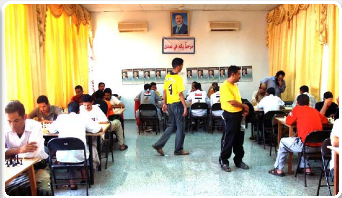
■ لقطة من البطولة