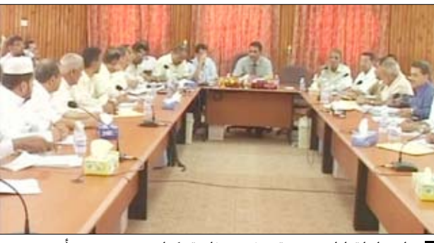
اجتماع لقيادات مديرية سيئون برئاسة وكيل حضرموت يوم أمس

سيئون / سيا : حدد منتصف الأسبوع المقبل موعداً نهائياً لتسليم الجانب الإداري 8 مواقع للمخططات السكنية الجديدة للمتضررين من السيول بواحي حضرموت بعد تجهيزها وتسويتها من قبل صندوق إعادة الإعمار للمنطقة المتضررة من السيول بمحافظتي حضرموت والمهرة ليتم الشروع في بناء تلك الوحدات ضمن المنحة الإماراتية لبناء