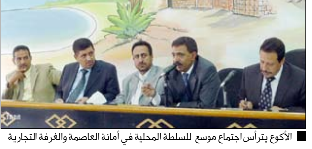
الأكوغ يتأسر اجتماع موسع للسلطة المحلية في أمانة العاصمة والغرفة التجارية

صنعاء / هشام الصبري : حث اجتماع موسع ضم السلطة المحلية في أمانة العاصمة والغرفة التجارية والصناعية للتجار على توفير المواد الغذائية والسلع الأساسية الرمضانية بما يلي احتياجات المستهلكين في السوق المحلي وإبقاء الأسعار بحدها الأدنى والاكتفاء بالبرح المعقول ومرعاة الجودة والمواصفات ووضع التسعيرة لكل سلعة. وأصدر مكتب التجارة والصناعة والغرفة التجارية والصناعية بالأمانة تعاميم تهيب كفتاح التجار القيام ببعض وإشهار أسعار جميع أنواع البضائع أمام المستهلك باستخدام مختلف وسائل الإعلان خاصة مع اقتراب شهر رمضان المبارك في الأسواق سواء كان سعرها محددًا رسميًا