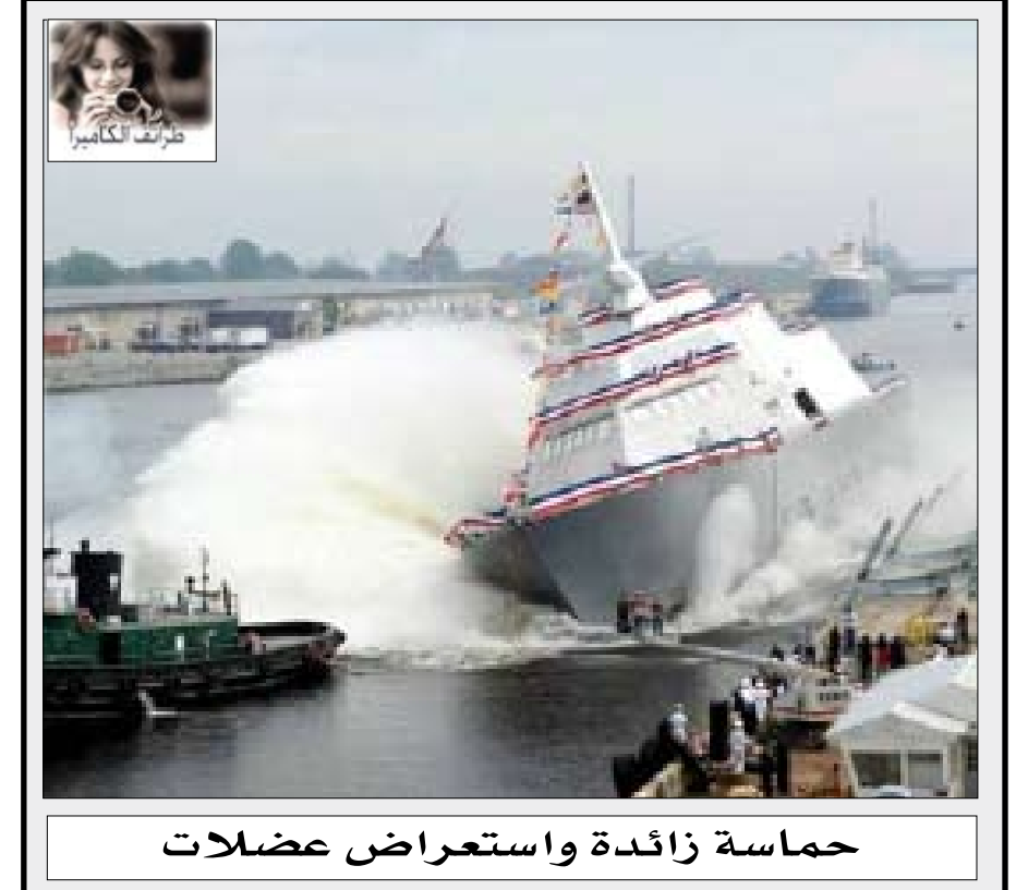
حماسة زائدة واستعراض عضلات