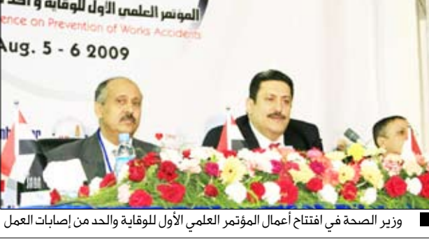
وزير الصحة في افتتاح أعمال المؤتمر العلمي الأول للوقاية والحد من إصابات العمل