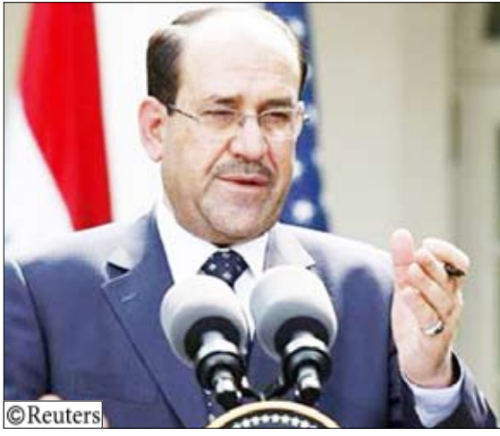
نوري المالكي رئيس الوزراء العراقي

التي شوهت إلى حد كبير معظم أحياء العاصمة والدخول والخروج إلى هذه الأحياء فيه الكثير من المشقة إضافة إلى أنها كانت السبب الرئيسي في خلق أزمة مرور خانقة في بغداد منذ سنوات. ومع تراجع حدة العنف في بغداد والارتفاع الملحوظ في الأمن عمدت الحكومة العراقية التي تسلمت الملف الأمني من القوات الأمريكية قبل عدة أشهر إلى رفع بعض هذه الحواجز وفتح العديد من الشوارع المهمة التي تربط أحياء وأجزاء المدينة. وساعدت عملية انسحاب القوات الأمريكية في الثلاثين من يونيو من المدن العراقية إلى تسهيل وتسريع عملية رفع هذه الحواجز من أماكنها.