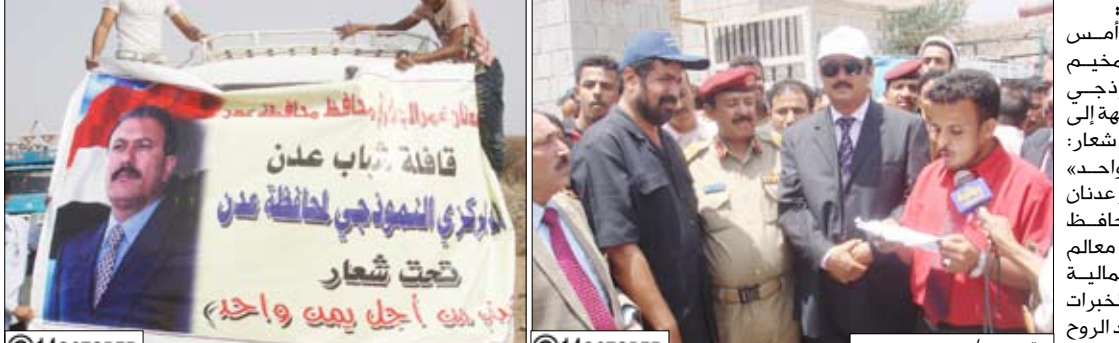
المحافظ الصوفي يستقبل القافلة الشبابية النموذجية لمحافظه عدن برئاسة الجفري

وكان في استقبال القافلة التي يتكون قوامها من 1800 شاب وشابة الأخ خالد الصوفي محافظ تعز وقيادة المحافظة. وخلال الاستقبال ألقى الدكتور عدنان الجفري محافظ عدن كلمة فيها أن انطلاق هذه القافلة يعد تظاهرة شبابية تعبر عن مدى تلاحم شباب هذا الوطن المحب لأرضه والحامل أمانة المحافظ على وحدته وكرامته، مؤكداً أن الشباب هم الصخرة القوية التي تتحطم عليها المؤامرات