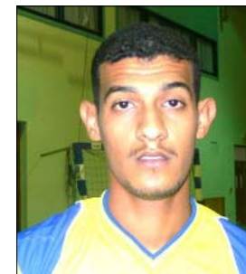
■ أسرار جلال