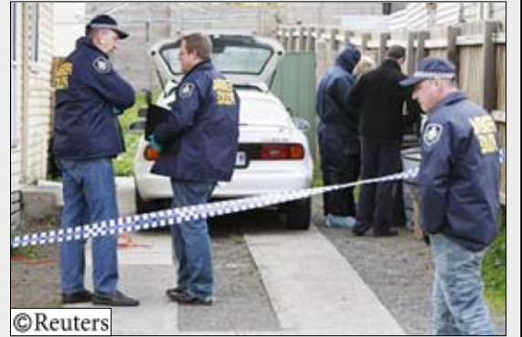
الشرطة الاسترالية وخبراء الأدلة الجنائية عند منزل في ضاحية جيلينروي في ملبورن داهمت الشرطة في إطار حملة لإحباط مخطط إرهابي

كانبير/14 أكتوبر/جيمس جرويل: وجهت الشرطة الاسترالية اتهامات إلى أربعة رجال يوم أمس الأربعاء بالتخطيط لهجوم على قاعدة عسكرية وفتح النيران على جنود فيما تبحث الحكومة فرض حظر على جماعة صومالية متشددة على صلة بالوامة.