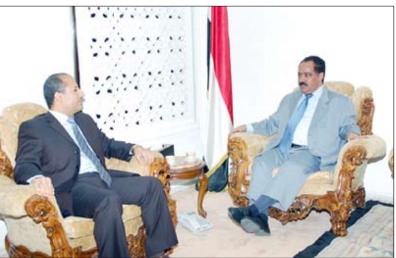
الراعي يستقبل ممثل رئيس الاتحاد الدولي للمخترعين

صنعاء / سيا : أشاد رئيس مجلس النواب يحيى علي الراعي بالمخترعين العرب ومورهم في جعل عملية الاختراع أداة فاعلة في الاقتصاد الوطني العربي والدفع بالتنمية الشاملة.. داعياً المبدعين اليمنيين إلى مزيد من الإبداع والابتكارات العلمية في شتى المجالات. وأشار رئيس مجلس النواب لدى استقباله أمس ممثل رئيس الاتحاد الدولي للمخترعين والمنسق العام ومفوض الشرق الأوسط الدكتور خالد نثنوان إلى أهمية الاختراع والابتكار كأحد العوامل الرئيسية الرافدة للاقتصاد الوطني والقومي وتحول الدول العربية إلى دول مصنعة ومصدرة للتكنولوجيا. وموضحاً بهذا الصدد مدى اهتمام الدولة اليمنية بعملية