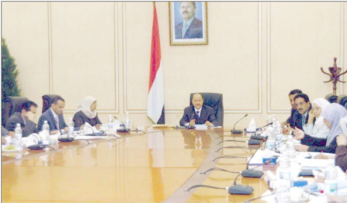
كما وافق المجلس على ماتضمنه مشروع التقرير الدوري الرابع حول مستوى تنفيذ اتفاقية حقوق الطفل والتوصيات الصادرة عنه.

وكان المجلس قد اطلع على محضر اجتماعه السابق واقره .