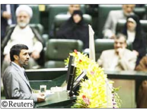
الرئيس الإيراني محمود أحمدي نجاد يتحدث أمام أعضاء البرلمان خلال حفل ادائه اليمين الدستورية يوم أمس الأربعاء

تهران/14 أكتوبر/باريسا حافني وزهرة: أدى الرئيس الإيراني محمود أحمدي نجاد اليمين الدستورية يوم الأربعاء بعد نحو ثمانية أسابيع من إجراء انتخابات متنازع على نتائجها والتي تسببت في أسوأ اضطرابات تشهدها البلاد منذ 1979 وأدت إلى انقسام النخبة من رجال السياسة والدين.