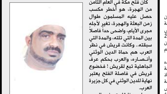
الشيخ / أنيس الحبشي

كان فتح مكة في العام الثامن من الهجرة، هو أخطر مكسب حصل عليه المسلمون طوال زمن البعثة والهجرة، تغير لأجله مجرى الأيام، وأضحى حداً فاصلاً بين الامة التي تلته، والامة التي سبقته.. وكانت قريش في نظر العرب هم حماة الدين الوثني وأنصاره، والعرب يحكم عرف الجاهلية تبع لقريش ؛ فخضوع قريش في فاصلة الفتح يعتبر نهاية للدين الوثني في كل جزيرة العرب . وعلى هذا قامت وفود العرب بالقدوم على الرسول صلى الله عليه وسلم - في سنة تسع للهجرة للإسلام والبيعة و الذي سمي بعام الوفود. وبعد فتح مكة، وفي سنة تسع للهجرة للإسلام والبيعة و الذي سمي بعام الوفود.