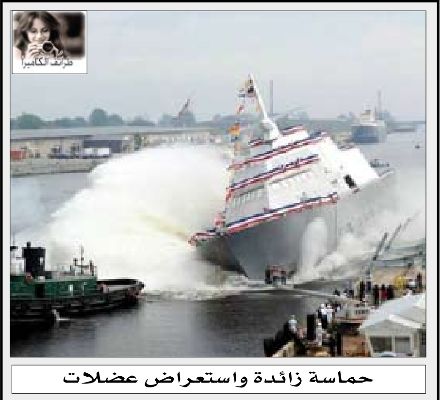
حماسة زائدة واستعراض عضلات