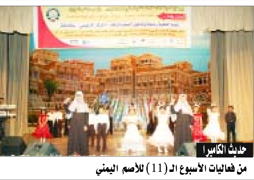
من فعاليات الأسبوع الـ (11) للأصم اليمني