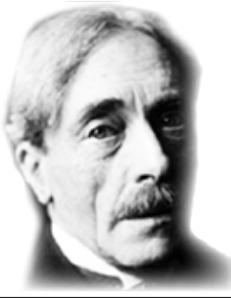
الشاعر الفرنسي بول فاليري

البحر البحر، بالنسبة إليّ، إحساس خياشيم ورثات، فضاء، انتصاب أمواج، شراب هوائي، عظمة، رائحة كبيرة وشائكة، شجرة معطرة وكبيرة، مشبعة بالهواء. إنه هواء شائك.