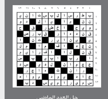
حل العدد الماضي

إعداد/ أشواق صالح أفقياً: 1- مؤلف فرنسي اشتهر برواياته العلمية منها (الرحلة الجوية في المركبة الهوائية) والرحلة العلمية في قلب الكرة الأرضية) وصف الكثير من الاختراعات الحديثة قبل ظهورها - في الفم. 2- ابن سام بن نوح وأبو الشعوب الأرامية - مجموعة تلال في أواسط روسيا غنية بالبحيرات والمستنقعات. 3- عتاب - أنثى الحمار - اقتراب. 4- كف - لمع البرق ضعيفا معترضاً نواحي الغيم - أحد أبناء نوح عليه السلام. 5- إحدى بنات النبي صلى الله عليه وسلم تزوجها عثمان بن عفان بعد وفاة أختها رقية - خاصتي. 6- وكالة أبحاث الطيران والفضاء الأميركية تأسست عام 1958م - يفهم - حرف أبجدي. 7- أحرف مكررة - ضمير. 8- تستخدم للكتابة - من سور القرآن الكريم. 9- ثري - غير ناضج - للاستفهام. 10- آله موسيقية - يتبع - رواسي. 11- من الطيور التي لا تطير - للتعريف - أداة جزم. 12- حرف نصب - ابل - عقل. عمودياً: 1- عالم إيطالي أول من استخدم التلسكوب