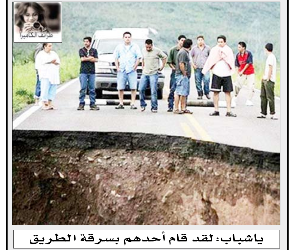
يا شباب: لقد قام أحدهم بسرقة الطريق