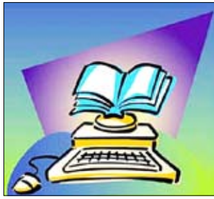
مائة ألف مؤلف.

من طريق الهواتف الخليوية. وقال وليام لينش مسؤول موقع «بي ان. كوم» الإلكتروني التابع ل«بارنز اند نوبلز»، «نريد ان نجعل الكتاب الإلكتروني مبسطا ومتوفرا وبخس الثمن وعمليا للجميع». والى الساعة تسيطر «أمازون» على السوق الأميركية للكتاب الإلكتروني من طريق كتابه الإلكتروني «كيندل» وهو يؤكد انه يخزن ثلاث