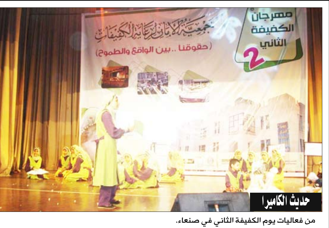
من فعاليات يوم الكيفية الثاني في صنعاء.