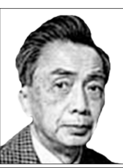
الشاعر الفرنسي / فرنسوا شانغ