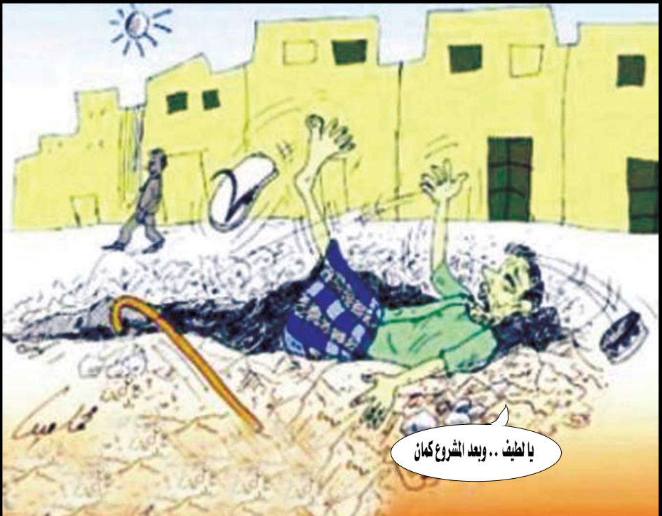
يا لطيف .. وبعد الشروع كان