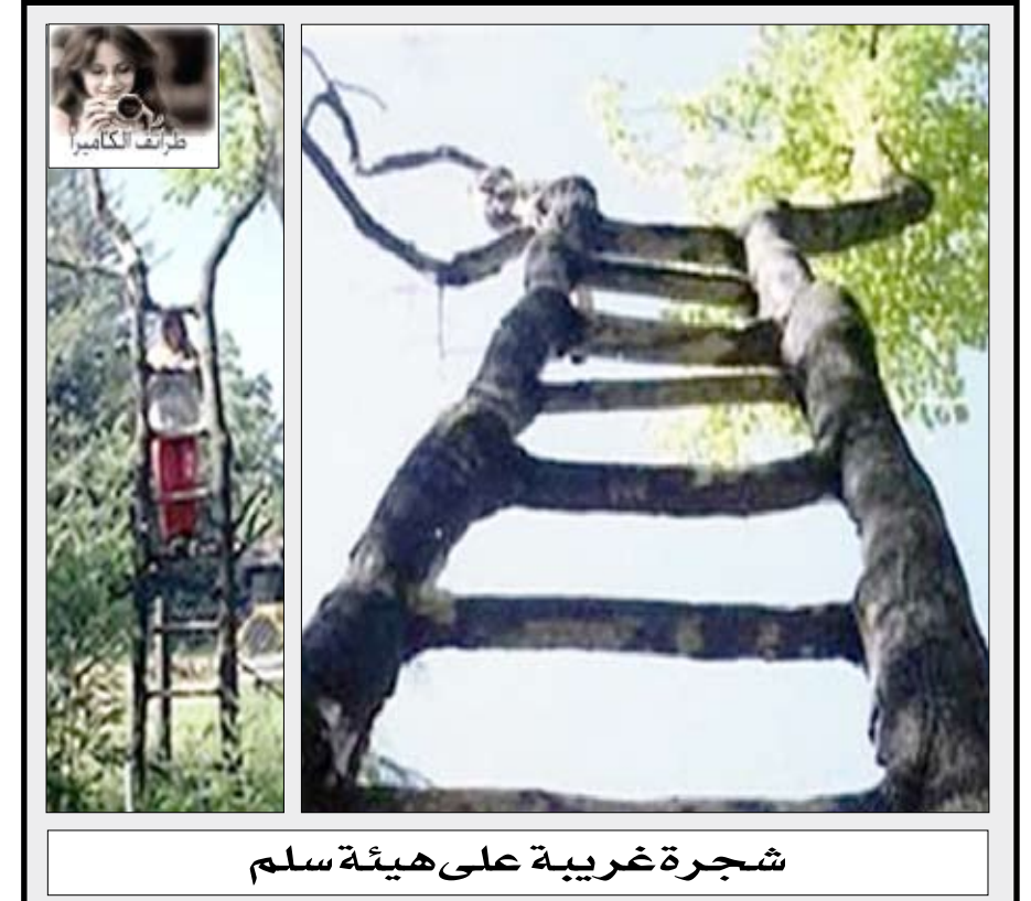
شجرة غريبة على هيئة سلم