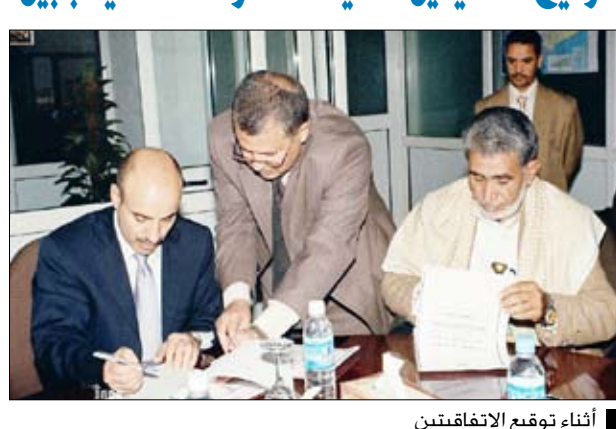
أثناء توقيع الاتفاقيتين

توقيع اتفاقيتين لتنفيذ 300 وحدة سكنية بأبين