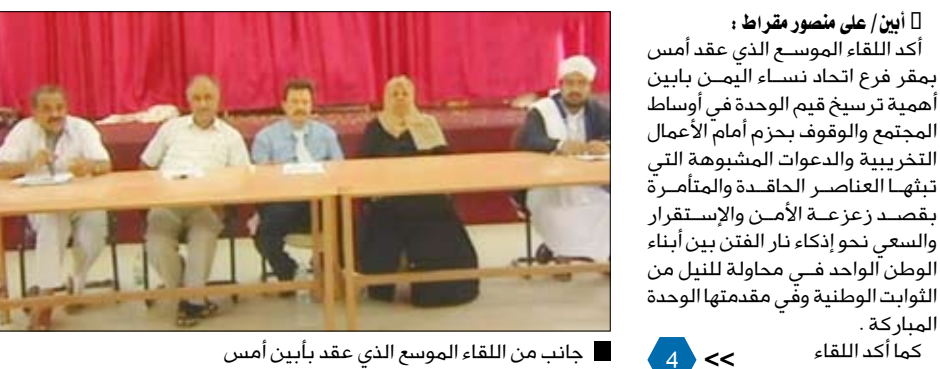
جانب من اللقاء الموسع الذي عقد بأبين أمس

أكد اللقاء الموسع الذي عقد أمس بمقر فرع اتحاد نساء اليمن بأبين أهمية ترسيخ قيم الوحدة في أوساط المجتمع والوقوف بحزم أمام الأعمال التخريبية والدعاوات المشبوهة التي تبثها العناصر الحاقدة والمتآمرة بغصد زعزعة الأمن والاستقرار والسعي نحو إنكاف نار الفتن بين أبناء الوطن الواحد في محاولة للثقل من الثواب الوطنية وفي مقدمتها الوحدة المباركة .