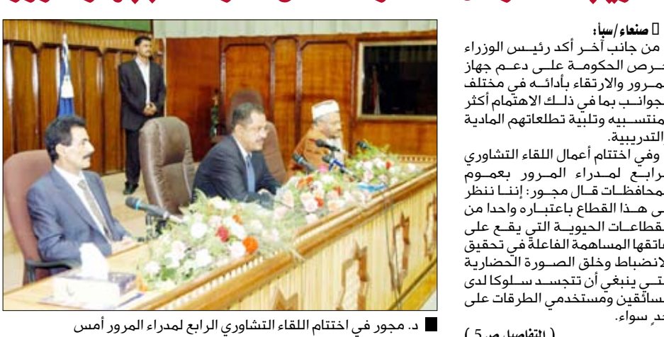
د. مجور في اختتام اللقاء التشاوري الرابع لمرور المرور أمس

.. ويجدد حرص الحكومة على الارتقاء بجهاز المرور