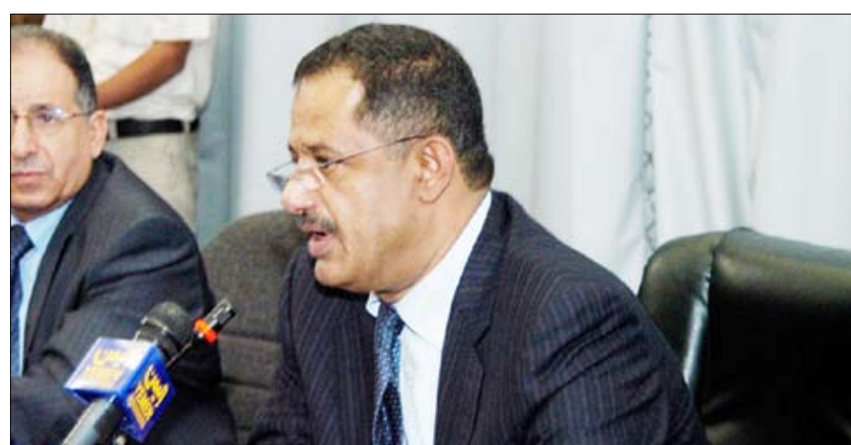
رئيس الوزراء لدى حضوره اختتام أعمال اللقاء الموسع لقيادات الوحدات الاقتصادية أمس

أكد الدكتور علي محمد مجور، رئيس مجلس الوزراء أن الوحدات الاقتصادية مثلت إحدى الآليات المهمة في تحقيق أهداف التنمية وبناء الاقتصاد الوطني، مشيراً إلى أهمية المخرجات التي أفضى إليها اللقاء الموسع لقيادات الوحدات الاقتصادية في تطوير وتحسين مستوى أدائها. وفي كلمة القاها لدى حضوره اختتام أعمال اللقاء الموسع لقيادات الوحدات الاقتصادية أمس بصنعاء قال مجور: " إنكم بهذا اللقاء قد انشغلتم بقضية مهمة من قضايانا الوطنية ووجهتم العناية إلى قطاع مهم، من بنيت اقتصادنا الوطني وهي الوحدات الاقتصادية التي القطاعين العام والمختلط وهو جهد مبارك يرسى تقليداً جديداً ومميزاً سيكون له أثره الإيجابي على مستوى تعاملنا مع مختلف القضايا ومظاهر الاختلال والإشكالات التي أثرت وتؤثر على أجندة الدولة في سعيها نحو بناء اقتصاد وطني وتنمية شاملة ومستدامة".