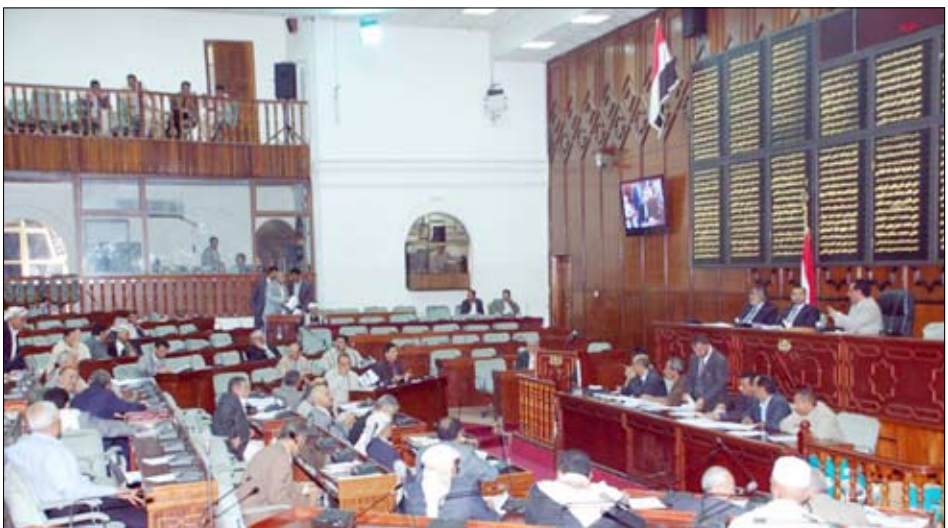
مجلس النواب في جلسته المنعقدة أمس

ناقش مجلس النواب في جلسته المنعقدة أمس برئاسة رئيس المجلس يحيى علي الراعي التقرير التكميلي للجنة المشتركة من لختي القوى العاملة والشؤون الاجتماعية والتنمية والنفط والثروات المعدنية بشأن اتفاقية القرض المبرمة بين حكومة بلادنا والصندوق الكويتي للتنمية الاقتصادية العربية بمبلغ 14 مليون دينار كويتي بما يعادل 50 مليون دولار أمريكي للمساهمة في تمويل مشروع الصندوق الاجتماعي للتنمية (المرحلة الثالثة). وبهذا الصدد أقر المجلس توجيه الحكومة بعدد من التوصيات التزم بها ممثل الجانب الحكومي وكيل وزارة التخطيط والتعاون الدولي عبدالله حسن الشاطر. حيث أكد المجلس في توصياته على أن