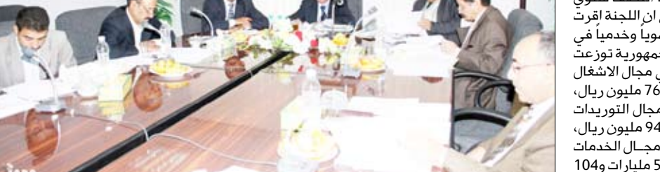
اللجنة العليا للمناقصات والمزايدات

أصدرت اللجنة العليا للمناقصات والمزايدات تقريرها النصف سنوي الذي أشار فيه إلى أن اللجنة أقرت (121) مشروعاً تنموياً وخدمياً في مختلف محافظات الجمهورية توزعت على 64 مشروعاً في مجال الأشغال بتكلفة 59 ملياراً و767 مليون ريال، و26 مشروعاً في مجال التوريدات بتكلفة 14 ملياراً و947 مليون ريال، و30 مشروعاً في مجال الخدمات الاستشارية بتكلفة 5 مليارات و104 ملايين ريال بتكلفة إجمالية قدرها 80 ملياراً و128 مليون ريال. وأوضحت اللجنة في تقريرها أن إجمالي التمويل الحكومي لتلك المشاريع المقررة بلغ 60 مليار و10 ملايين ريال فيما بلغ التمويل الخارجي 20 مليار و117 مليون ريال. وفيما يتعلق برفع السقف المالي للجان للمناقصات أكدت اللجنة على أهمية تفعيل دور الجهاز المركزي للرقابة والمحاسبة في أعمال الرقابة على تنفيذ إجراءات المناقصات في الوزارات والهيئات