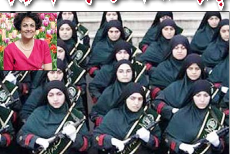
من جيش «أخوات الباسيج» وفي الإطار الناشطة الإيرانية جانباً إفرارياً

شهران / منابغات : قالت الناشطة الأمريكية من أصل إيراني، جانب إفرارياً، إن تنظيم "أخوات الباسيج" وهو الجناح النسائي لمنظمة الباسيج لعب الدور الأساسي في قمع الحركة النسائية التي تراكبت مع الاحتجاجات الحاصلة في بلادها أخيراً، مشيرة إلى أن "حارسة الخميني" سابقاً تعتبر ملهمة لهؤلاء المقاتلات، كما أنها من أبرز مؤسسي التنظيم. وتعتبر جانب إفرارياً من أبرز الناشطات الإيرانيات في الغرب، وتحظى كتبها عن النساء والسياسة في إيران بمنابع دائمة من كبريات الصحف الغربية . وتدر س إفرارياً الدراسات الدينية والنسوية في جامعة كاليفورنيا سانتا بربر، وآخر كتبها "السياسة الجنسية في إيران الحديثة" الصادر عن جامعة كامبريدج والذي يتحدث عن التمييز ضد المرأة عبر المراحل المختلفة في إيران، ودور النساء في السياسة. وتقول إفرارياً في حوار نشره موقع "العربية نت" إن أعمار المقاتلات اللواتي ينضوين في "أخوات الباسيج" تتراوح بين 18 و38 عاماً، لكن هناك من هن أكبر سناً بالنظر لوجوههن في التنظيم منذ البداية . وأشارت إلى أنه بعد بداية الحرب