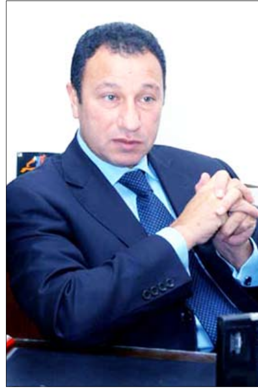
■ محمود الخطيب

من جانبه، لم يخف انشيلوتي رغبته في أن ينضم إليه بيرلو بعد أن ترك الأول ميلان منذ أسابيع. وذكرت وسائل الإعلام أمس أن تشيلسي عرض