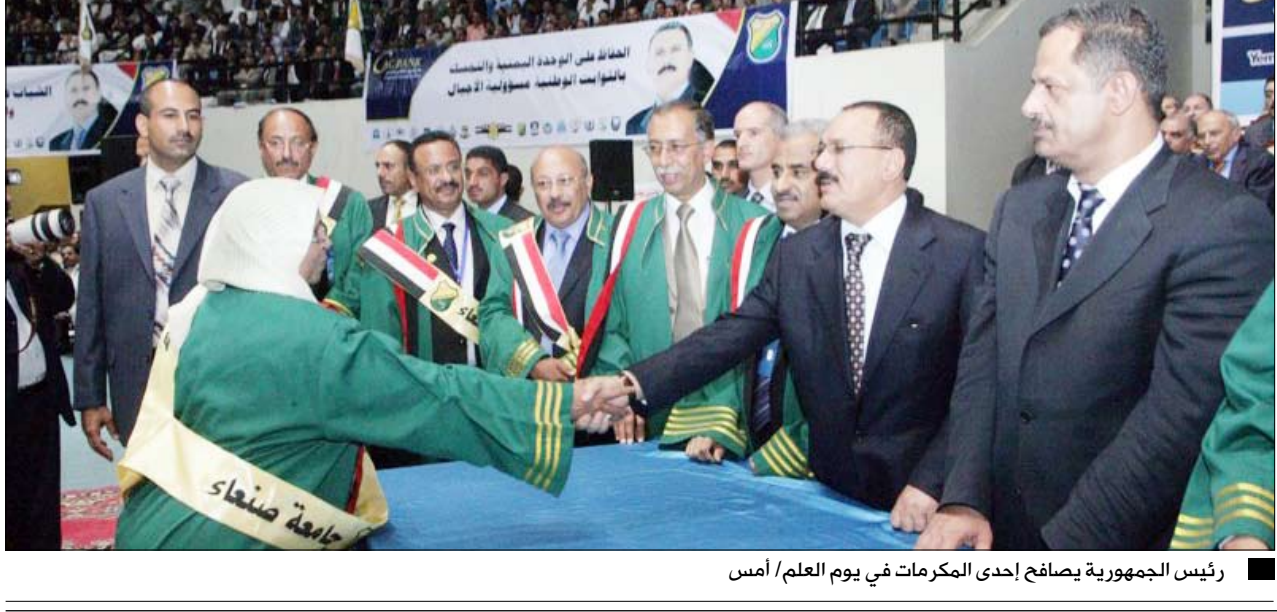
رئيس الجمهورية يصفح إحدى الكرمات في يوم العلم / أمس

في كلمة ألقاها نيابة عن رئيس الجمهورية .. مجور: ندعو (المشارك) مجدداً إلى الاستجابة للحوار والكف عن التبريرات فالوطن أكبر من الحسابات الحزبية