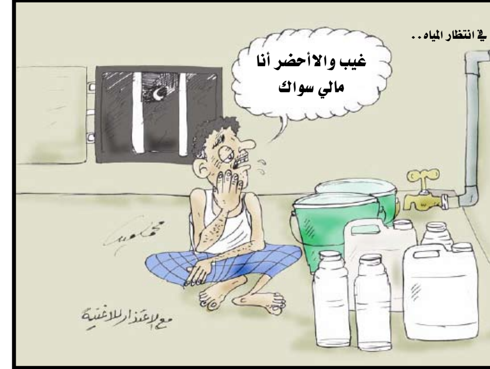
في انتظار المياه ..

تصوير وتعليق / علي الدرب: شارع السفينة من الشوارع الجديدة التي تكثر فيها الفنادق إضافة الى انه احد مداخل عدن لذا نتمنى ان تولى الجهات المسؤولة اهتماماً به من خلال النظافة والتحسين وصيانة طرقه العام حيث توجد على جانبه مساحة ترابية يمكن الاستفادة منها لتوسعة الطريق وزراعته حتى لا تشوه المنظر الجمالي لهذا الشارع أو تتعرض لتلوث العشوائيات.