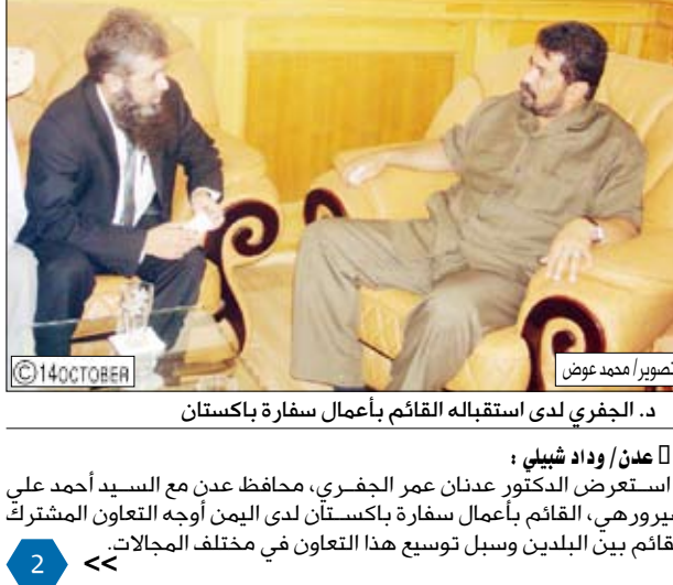
د. الجفري لدى استقباله القائم بأعمال سفارة باكستان

ناقش المجلس الوطني للسكان برئاسة رئيس مجلس الوزراء الدكتور علي محمد مجور جملة من المواضيع المرتبطة بالقضية السكانية بأبعادها الاجتماعية والتنموية والصحية والتعليمية والتوعوية والرسائل والبحوث السكانية إضافة إلى نتائج المراجعة نصفية للبعد السكاني في الخطة الخمسية الثالثة للتنمية الاقتصادية والاجتماعية والجهود المبذولة لإدماج القضايا السكانية في الخطة القطاعية على مستوى المحافظات. وتطرق الاجتماع إلى الجوانب المرتبطة بالتنسيق بين المجلس الوطني ومختلف الوزارات والجهات إزاء تنفيذ البرامج والأنشطة السكانية وأهمية العمل على إيجاد إستراتيجية للتواصل بين مختلف الأطر