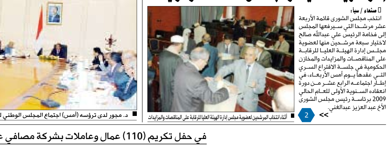
ثناء انتخاب المرشحين لعضوية مجلس إدارة الهيئة العليا للرقابة على المناقصات والمزايدات

انتخب مجلس الشورى قائمة الأربعة عشر مرشحاً التي سيرفعها المجلس إلى فخامة الرئيس علي عبدالله صالح لاختيار سبعة مرشحين منها لعضوية مجلس إدارة الهيئة العليا للرقابة على المناقصات والمزايدات والمخازن الحكومية في جلسة الاقتراع السري التي عقدها يوم أمس الأربعاء، في إطار اجتماعه الرابع عشر من دورة انعقاده السنوية الأولى للعام الحالي 2009 برئاسة رئيس مجلس الشورى الأخ عبد العزيز الغفني.