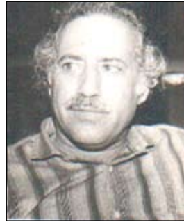
الممثل والمخرج المسيلي