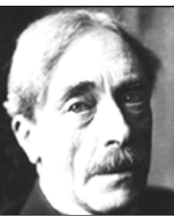
الشاعر الفرنسي / بول فاليري