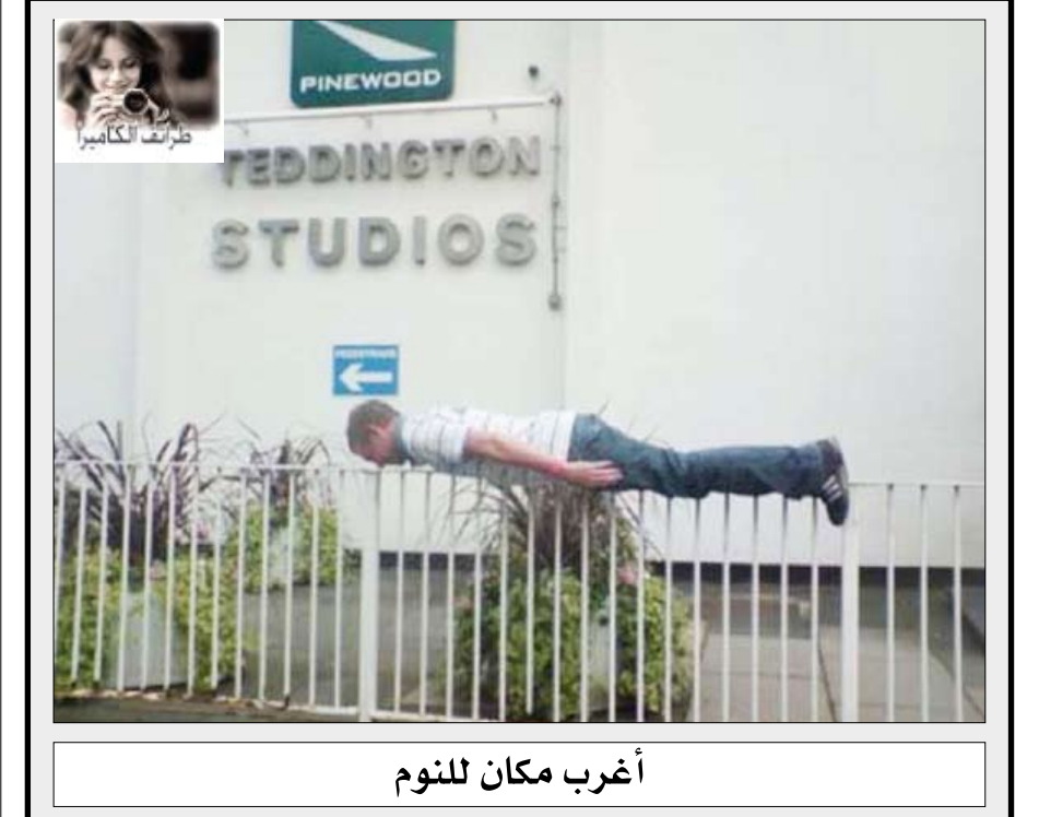
أغرب مكان للنوم

أفقياً 1- من مشاهير شعراء الانجليز فقد نظره فأملى على زوجته وابنتيه ملحمته الخالدة ( الفردوس المفقود ) توفي سنة 1674م - مدينة سورية . 2- يصاحب الرعد - بلد أسوي - للمعية. 3- من الحمضيات - مضيئ. 4- أشد وعظم - قرية في جبال اليمن الوسطى - فريدة. 5- شهر سرياني - ضمير. 6- قبيلة عربية يمانية قديمة سكنت مكة - مجموعة من النجوم - كف. 7- الريح الطيبة - كافر - اقترب. 8- مدينة فلسطينية - عاصمة أسبوية. 9- بيت الدجاج - الطي الأبيض - قلوي - عايش. 10- مثنى ( جريح ) - سنة. 11- من المعادن - 24 ساعة - ظهر. 12- انتشار وحمرة الشفق - جواب. عمودياً 1- أعلى جبال فلسطين يشرف على مدينة صفد - شعور. 2- مجرى دموعي - سقي النبات - مدينة - سعودية. 3- من جبال صنعاء - يتبع الليل - شك. 4- اليوم شديد الحر - نادر. 5- مدينة في الأرجنتين - صوت الثعبان. 6- مرتفع - أرواه ( ضد عطشه ) - شهر ميلادي. 7- خيال - من الزهور العطرية - ضياء. 8- أحرف مكررة - مدينة يمنية - للاستفهام. 9- إلهة الصيد عند الرومان - تقوى. 10- تمكن وثبت - أرشد - أحد الوالدين. 11- متشابهان - صوت الجرس - حيوان. 12- محافظة يمنية - قريب - كفاء.