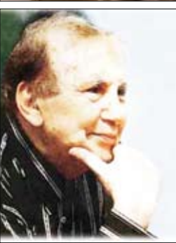
الشاعر / نزار قباني