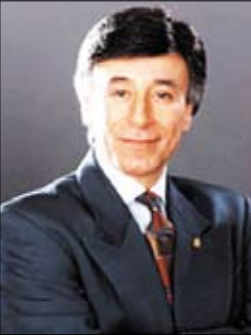
د. إبراهيم الفقي

إذا نظرت جيداً حولك، سوف تجد أن التحدي الحقيقي في الحياة هو أن تغير نفسك وتصبح الشخص الذي تريد أن تكونه وتستغل طاقاتك الكامنة وتعيش حياة أسعد.. حياة خالية من التعجيز والقيود والمشاغل السلبية كما إنك عندما تتركز انتباهك على إلقاء اللوم على غيرك، فإنك تبذل طاقاتك وقدراتك وتضيع وقتك.. بدلاً من ذلك حاول أن تركز حياتك على تغيير نمط حياتك، وابدأ باستمداد الطاقة اللازمة من مخزون القدرات الإيجابية الخفية المكسدة داخلك واستغل طاقاتك الكامنة لتصبح الإنسان الذي أردت أن تكون.