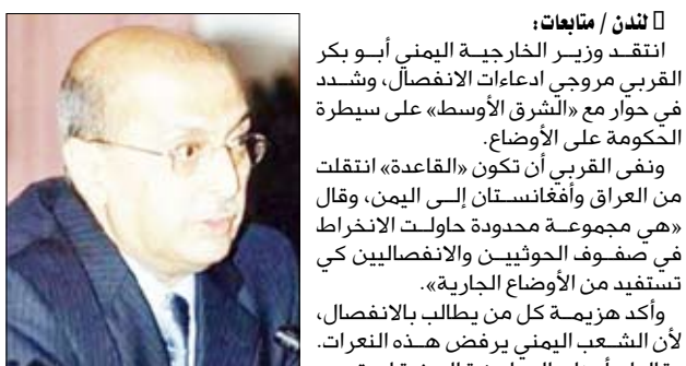
أبو بكر القريب

انتقد وزير الخارجية اليمني أبو بكر القريب مروجي ادعاءات الانفصال، وشدد في حوار مع «الشرق الأوسط» على سيطرة الحكومة على الأوضاع.