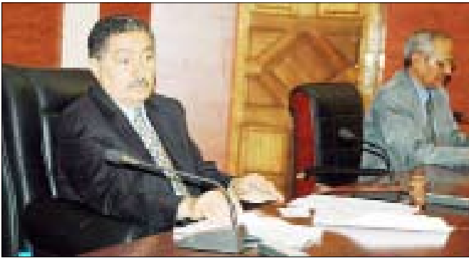
جلسة مجلس الشورى أمس

هذا المجال والمشاركة المستمرة في المعارض الإقليمية والدولية ذات العلاقة بالتسويق للمنتجات الزراعية وتنظيم دور المبيعات اليمنية بالخارج في دعم جهود الترويج للصادرات الوطنية.