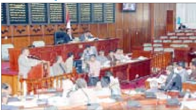
جلسة مجلس النواب أمس

هنأ مجلس النواب فخامة الرئيس علي عبد الله صالح ، رئيس الجمهورية وكافة أبناء الشعب اليمني وقواته المسلحة والأمن بمناسبة السابع عشر من يوليو المجيد ، يوم انتخاب فخامته رئيساً للجمهورية في عام 1978م ، مثنياً الدعوة الصادقة والمخلصة التي وجهها فخامته إلى الجميع من أجل التصالح والتسامح والحوار وتجنب المهادنة الإعلامية وكل الممارسات التي تخلف مناحات التوتر وتعكر صفو السلم الاجتماعي.