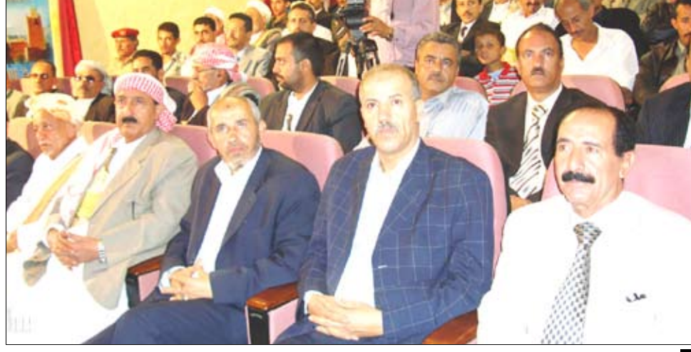
حفل فني خطابي في اب بمناسبة 17 يوليو

وفي الندوة أكد المحافظ علي سالم الخظمي ما تمثله ذكرى الـ 17 من يوليو من معان ودلالات عظيمة في تاريخ شعبنا اليمني المعاصر.. منوهاً إلى أن انتخاب فخامة الرئيس علي عبدالله صالح رئيساً للجمهورية جاء استجابة لضرورة وطنية وتاريخية فرضتها ظروف تلك المرحلة الصعبة من تاريخ اليمن.. مؤكداً أن فخامته استطاع أن يخرج البلاد من دوامة العنف التي كانت تعاني منها خلال تلك الفترة العصيبة والتي شهدت اغتيال ثلاثة من الرؤساء في اليمن في ظروف غامضة. ودعا محافظ ريمة إلى توحيد الصفوف للحفاظ على الوحدة،