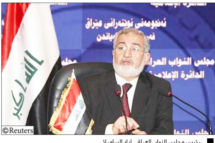
رئيس مجلس النواب العراقي ابياد السامراتي

وبالتالي فإن مجلس النواب بحاجة أن يطلع عليها. وأضاف "أنا أعتقد أن مجلس النواب سيطلب من الحكومة تزويده بنسخة من هذه العقود بعد أن تنتهي الحكومة منها ويطلب من الحكومة الترتيب بالتوقيع لكي يقول البرلمان رأيه". وتحدث السامراتي عن احتمال أن يقوم مجلس النواب مرة أخرى باستدعاء وزير النفط في جلسة استجواب هذه المرة إذا أصرت الجهات التي قدمت مثل هذا الطلب على وقفها وقال "نحن في نهاية الأمر لا بد أن نتجاوز مع رغبة النواب في هذه العملية وواجبنا أن نجعل هذه العملية تجري في إطارها المهني". ويمنح الدستور العراقي مجلس النواب حق طرح الثقة عن الوزراء لكنه يشترط الأغلبية المطلقة في أي عملية تصويت، ويتألف مجلس النواب من 275 نائباً. وتسعى الحكومة العراقية جاهدة لزيادة صادرات النفط إلى ستة ملايين برميل يوميا في السنوات المقبلة وهو إجراء سيؤدي إلى زيادة عائدات العراق الذي تعتمد ميزانيته بشكل رئيسي على النفط. وترى الحكومة أن التعاقد مع الشركات الأجنبية سيسمح لها بتحقيق هذا الهدف وترفض أي محاولة من شأنها عرقلة مساعيها في إبرام هذه الجولة. وقال علي الديباغ الناطق باسم الحكومة