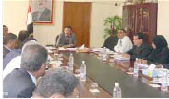
بمراجعة وتحليل التقارير والمؤشرات المقدمة من المكاتب والتأكد من صحة البيانات الواردة فيها بما من شأنه إظهار الأرقام الحقيقية لكميات الإنتاج السمكية ومعرفة الأسباب

ناقش اجتماع موسع عقده بصنعاء برئاسة وزير الثروة السمكية محمد صالح شمالان تقارير الأداء النصف سنوية للمكاتب والهيئات والمؤسسات السمكية في مختلف المحافظات الساحلية خلال النصف الأول من العام الجاري. واستعرض الاجتماع الذي ضم رئيس الاتحاد التعاوني السمكي علي بن شبا ومدراء عموم مكاتب وزارة الثروة السمكية والهيئات والمؤسسات التابعة لها التقرير الخاص بالإنتاج السمكي لتلك المكاتب وحصة الدولة من عائدات الصيد التقليدي والصادرات السمكية. وتضمن التقرير مستوى تحصيل الإيرادات والديون المتأخرة لدى الجمعيات للدولة التي تجاوزت 249 مليون ريال. وأوضح التقرير الصعوبات التي تواجهها المكاتب في ضبط عمليات الإنتاج وتحصيل إيرادات الدولة ومماثلة بعض الجمعيات السمكية في تسديد المبالغ المتأخرة عليها خلال السنوات الماضية. في الاجتماع وجه الوزير شمالان القطاعات المختصة