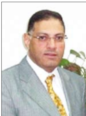
أ. محمد مرسي عوض

وأضاف قائلاً: ويكتسب احتفالنا في اليمن الشقيق بذكرى ثورة 23 يوليو المجيدة مغزى خاصاً. فبلاد اليمن السعيد تتحرك بخطى واثقة نحو المستقبل والتنمية والتقدم لكافة أبناء اليمن. تحت ظل الوحدة اليمنية المباركة التي حققت ولا تزال الأمن والاستقرار والتنمية وانتقلت بأبناء وطننا في اليمن نحو أفق أرحب وعهود جديدة من التقدم والنمو والازدهار. وأشار إلى أنه ومن حسن الحظ أن يتزامن احتفالنا بذكرى ثورة الثالث والعشرين من يوليو مع ذكرى تولي فخامة الرئيس علي عبد الله صالح مقاليد الحكم في اليمن في يوليو 1978م لتتواصل في عهده مسيرة التنمية والتقدم والاستقرار والوحدة.