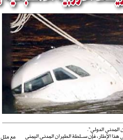
حطام طائرة (اليمنية)

شكلت لجنة تحقيق طبقاً للقواعد والنظم المنصوص عليها في اتفاقية "شيكاغو" للتحقيق في هذه الكارثة، والتحقيق مازال مستمراً بين الدولة التي وقعت فيها الحادث وسلطة الطيران المدني اليمنية: مبيناً أن سلطة الطيران المدني اليمنية دعت الجهات المعنية إلى التعاون معها بقصد التحقيق في الحادث والوصول إلى النتائج المطلوبة، ما أكد حرصها على إتباع مسلسل التحقيق النظامي المعمول به في مثل هذه الحوادث ولضمان الاستفاضة وتأكيد المصداقية بما يكفل تجنب الحوادث في المستقبل.