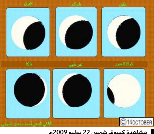
ملاحظة كسوف شمس 22 يوليو 2009م

وقال محافظ حضرموت سالم أحمد الخبثي في 17 يوليو 1978 مثل علامة تاريخية مضيفة ونقطة تحول بارزة في حياة شعبنا اليمني العظيم. جاء ذلك في كلمته في الفعالية التي شهدتها السلطة المحلية بمحافظة حضرموت في مركز بلقهبه بمدينة المكلا أمس لاستعراء الإنجازات والتحول التي شهدتها الوطن اليمني منذ انتخاب فخامة الأخ الرئيس علي عبدالله صالح من قبل ممثلي الشعب لقيادة مسيرة التنمية في الوطن.