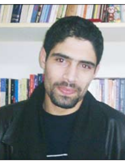
الشاعر الأردني / محمد عريقات