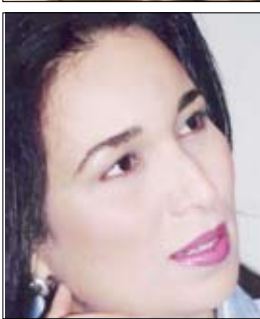
الشاعرة التونسية / أمال موسى