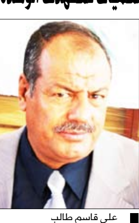
علي قاسم طالب

قال الأخ / علي قاسم طالب محافظ الضالع إن أبناء الضالع يمتلكون رصيداً نضالياً ناصع البياض، منوها بالدور البطولي والمشرّف لأبناء الضالع في الدفاع عن الثورة والوحدة الذي دون في تاريخ اليمن بأحر من نور عبر مختلف المراحل. وأضاف محافظ الضالع في تصريح خاص لصحيفة (14 أكتوبر): كانت من أبناء الضالع الدور الريادي في الدفاع عن الثورات المتعاقبة سبتمبر وأكتوبر فكم حصار السبعين يوماً وحماية الجمهورية، وفي الضالع ركلت براميل التشطير والتجزئة والتمزق ومحيت آثارها إلى الأبد ومن المستحيل إعادة عجلة التاريخ إلى الوراء. وأضاف: على الواهين والهاقدين على الوطن ووجدته ومنجزاته العملاقة أن يدركوا أن محافظة الضالع وأبنائها الوديعين الشجعان لن يسمحوا بتشويه تاريخ محافظتهم الباسلة تحت أي مسميات هدفها المساس بوحدة الوطن واستقراره وإعاقه التنمية والبناء. 2 <<