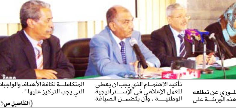
مجلس الشورى في أولى جلسات اجتماعه الحادي عشر من دورة انعقاده السنوية

أكد رئيس الهيئة الوطنية لمكافحة الفساد المهندس أحمد محمد الأنسي أهمية تحديد مجالات التنسيق والتعاون بين الهيئة ووسائل الإعلام لترجمة أهداف الإستراتيجية الوطنية لمكافحة الفساد. وقال في كلمة له أمس بورشة العمل الرابعة حول إعداد الإستراتيجية الوطنية لمكافحة الفساد والخاصة بفرع دور الإعلام في جهود مكافحة الفساد - " نسعى لجعل عمل الهيئة في نفس الاتجاه مع وسائل الإعلام حتى يصل إلى كل مكان". من جانبه أكد وزير الإعلام حسن أحمد اللوزي أن الإعلام يأتي في هذه المعركة في المرتبة الأهم بعد الهيئة الوطنية لمكافحة الفساد والسلطة القضائية ويعمل مع هذه الجهات في إطار المواجهة الحكيمه والصارمة لهذا الداء الويل والمدمر. وأضاف " الفساد يصبح أكثر وبالا عندما يتمكن من السلطات داخل الدولة والمجتمع ومؤسساته وفي مقدمتها السياسية والاقتصادية". ولفت إلى أن الفساد السياسي يفتك بجوهر الأخلاق الديمقراطية التي تمثل منهج الحكم وتفاعلات السلطات والمسئوليات وهو ما ينطبق أيضا على الفساد الاقتصادي والمالي (التفاصيل من 5)