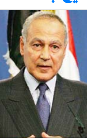
أحمد أبو الغيط

أكد وزير الخارجية المصري أحمد أبو الغيط مجدداً موقف بلاده الواضح والداعم لليمن ووحدة وأمنه واستقراره. وقال أبو الغيط في تصريح لمراسل وكالة الأنباء اليمنية (سبأ): "إن مصر تؤكد دوماً على أهمية وحدة اليمن وسلامه وأرضه، وتعتبر الوحدة اليمنية منجزاً قومياً يفتخر به جميع أبناء الأمة". وفي حين أكد وزير الخارجية المصري عمق ومناخ العلاقات الأخوية التاريخية التي تربط البلدين والشعبين الشقيقين اليمنيين والصصريين .. أشاد بالتطور المتسارع الذي تشهده حالياً العلاقات بين البلدين في مختلف المجالات. 2 <<