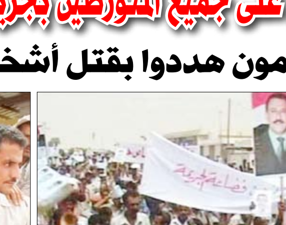
محافظة لحج يتحدث إلى المعتصمين