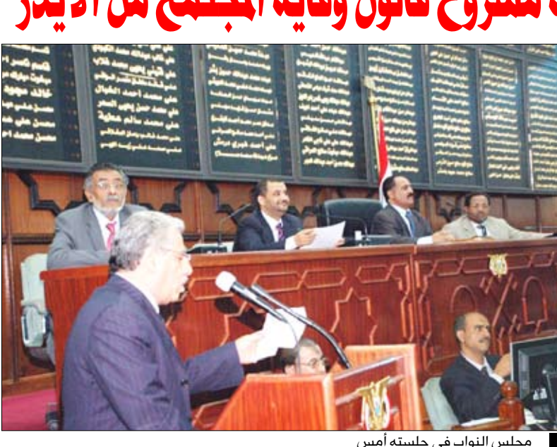
مجلس النواب في جلسته أمس

استكمل مجلس النواب في جلسته أمس برئاسة رئيس المجلس يحيى علي الراعي مناقشة مشروع قانون وقاية المجتمع من الإيدز وحماية حقوق المتعاشين مع الفيروس في ضوء تقرير لجنة الصحة العامة والسكان. حيث أوجب مشروع القانون مع التعديلات المطروحة عليه من جانب نواب الشعب على المتعاشين مع الفيروس (الإيدز) عند اكتشاف إصابته التوجه إلى الجهات المختصة لتلقي العلاج والمشورة والتوعية بمخاطر الإصابة وطرق انتقال الفيروس. كما أوجب على المتعاشين مع الفيروس فور معرفته بإصابته اتخاذ التدابير الوقائية والتقييد بالتعليمات التي تعطى له من الجهة المختصة بهدف الحد من انتقال الفيروس إلى الآخرين وعليه عند الإقدام على الزواج إخبار الطرف الآخر بحالته. وبين أنه إذا كان المصاب بالفيروس الزوج فمن حق الزوجة أن تطلب الفسخ للضرر وللقاضي أن يحكم به بناء على تقرير طبي من اللجنة المختصة. وحظر مشروع القانون على المتعاشين مع الفيروس فور علمه بإصابته القيام بأي سلوك من شأنه نقل الفيروس (الإيدز) إلى غيره. وأقر المشروع إنشاء لجنة وطنية 2 <<