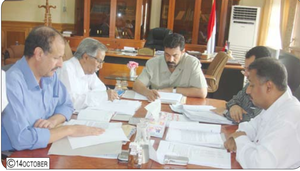
محافظ عدن خلال ترؤسه اجتماع مجلس إدارة صندوق النظافة وتحسين المدينة