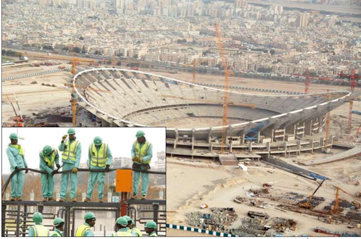
من ملاعب جنوب أفريقيا قيد الإنشاء

للمطالبة بزيادة الأجور بنسبة 13% وأن ثمة مخاوف من احتمال أن يؤدي هذا الإضراب إلى تأخير استكمال خط حديدي جديد للقطارات السريعة يتم إنشاؤه خصيصاً لكأس العالم. كما يذكر أنه يتم تنظيم هذا الإضراب بدعوة من النقابة الوطنية لعمال المناجم التي تضم عمال البناء أيضاً في عضويتها وأن أصحاب الأعمال يعرضون زيادة الأجور بنسبة 10% من أجل إنهاء الإضراب. وأشار التلفزيون البريطاني إلى أنه كان من المقرر - قبل هذا الإضراب - أن يتم استكمال الـ (ستادات) الجديدة بحلول شهر ديسمبر المقبل بما في ذلك إقامة 5 (ستادات) جديدة وتحديث 5 قائمة بالفعل.