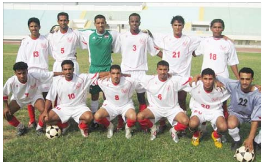
فريق أهلي صنعاء

□ صنعاء/ سبأ: بلغ فريق أهلي صنعاء دور الـ 16 لبطولة كأس رئيس الجمهورية لكرة القدم في نسختها الـ 12، إثر فوزه الثمين على مضيفه نصر الضالع بثلاثة أهداف مقابل هدف في المباراة التي جرت بينهما أمس على ملعب معاوية بلحج في إياب دور الـ 32 من المسابقة الكروية. وكان أهلي صنعاء قد فاز بصعوبة على النصر في لقاء الذهاب بهدف وحيد في المباراة التي جرت بين الفريقين على ملعب ذمار الدولي وفي أول مباراة يخوضها الأهلي على ملعب ذمار الدولي تنفيذاً لقرار اتحاد كرة القدم القاضي بنقل خمس مباريات للأهلي إلى