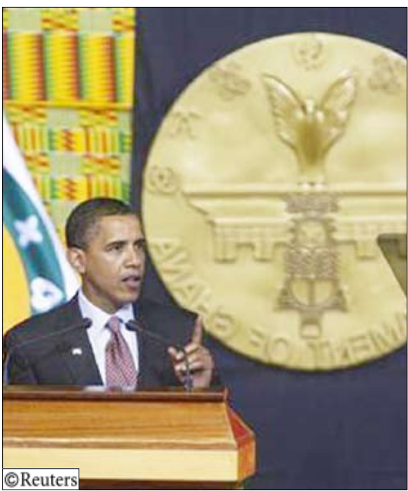
أوباما يلقي كلمة أمام البرلمان الغاني

أبلغ الرئيس الأمريكي باراك أوباما الأفارقة أمس السبت بأن المساعدات الغربية يتعين أن تجر في المقابل حكاما رشيدا وحتمهم على تحمل مسؤولية أكبر في القضاء على الحروب والفساد والأمراض في القارة. بعد أوباما بهذه الرسالة في أول زيارة يقوم بها لأفريقيا جنوب الصحراء منذ توليه الرئاسة في يناير ي كأول رئيس أسود للولايات المتحدة، واختار غانا التي تتمتع بالاستقرار والديمقراطية لاعتقاده بأنها يمكن أن تكون نموذجا لبقية دول أفريقيا. وبعد حضوره قمة الثماني التي اتفق الزعماء فيها على إنفاق 20 مليار دولار لتحسين الأمن الغذائي في الدول الفقيرة شدد أوباما على أن الولايات المتحدة مستعدة لتقديم المساعدة لكنه أوضح أنه يتعين على الأفارقة القيام بدور قيادي في تسوية مشاكلهم الكثرية. وأكد أوباما في كلمة أمام برلمان غانا أن التنمية تعتمد على الحكم الرشيد مضيفا "هذا هو العنصر المفقود في أماكن كثيرة للغاية ومنذ وقت طويل للغاية. هذا هو التغيير الذي يمكن أن يطلق طاقات أفريقيا. وهذه هي المسؤولية لا يمكن أن يفي بها سوى الأفارقة أنفسهم". وفي كلمة شملت أكبر تفصيلات لوجهة نظره بشأن سياسته الأفريقية انتقد أوباما الفساد وانتهاكات حقوق الإنسان الشائعة بأفريقيا محذرا من أن النمو والتنمية سيتأخران ما لم يتم التصدي لهذه المشاكل. وأضاف أوباما "لا يمكن لدولة أن تكون ثروة إذا استغل زعمائها الاقتصاد لإثراء أنفسهم أو إذا أمكن شراء دعم رجال الشرطة من قبل مهربي المخدرات. لن نرغب أي جهة أعمال في الاستمرار في مكان تقتطع فيه الحكومة 20 في المئة منه". وأكد أن الولايات المتحدة لن ترفض أي نظام للحكم ولكنها ستزيد المساعدة لأولئك الذين يتصرفون بصورة مسؤولة.