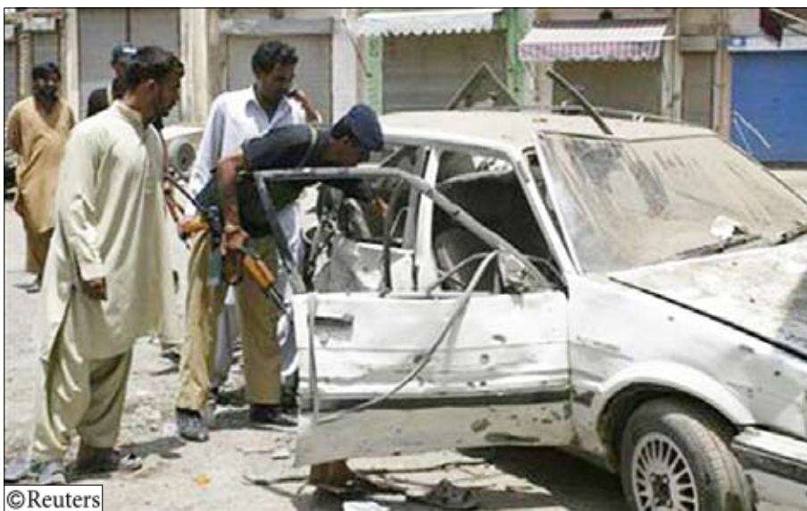
بعض الأضرار التي خلفتها الطائرة الأمريكية على منطقة قبلية في باكستان

وبدا الجيش الأمريكي رحلات الاستطلاع الجوي فوق الأراضي الباكستانية في منتصف مارس آذار لكنه توقف بعد شهر بعد أن كفت باكستان على نحو مفاجئ عن طلب المعلومات. وقال بعد ما هاجم متشددون نقطة تفتيش في منطقة زهوب في إقليم بلوخستان جنوب غرب باكستان. ويقع إقليم بلوخستان على حدود مع جنوب أفغانستان حيث أطلقت مشاة البحرية الأمريكية هجوما كبيرا جديدا قبل اسبوع. وأبدت باكستان التي تقاتل بالفعل متشددين في الشمال الغربي قلقا من تدفق المتمردين على أراضيها اذا اشتد القتال في جنوب أفغانستان.