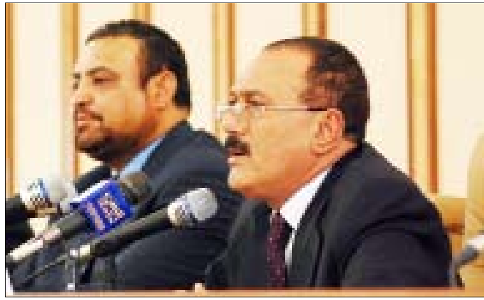
رئيس الجمهورية أثناء اللقاء كلمته في الملتقى الشبابي لأبناء مديريات ردفان أمس

صنعاء / سيا : التقى فخامة الأخ الرئيس علي عبد الله صالح رئيس الجمهورية أمس بالمشاركين في الملتقى الشبابي لأبناء مديريات ردفان الذي نظمته وزارة الشباب والرياضة لمدة أربعة أيام بمشاركة 300 شاب من مديريات (الحبيبين - الملاح - حالمين - حبل جبر) بمحافظة لحج. وقد تحدث فخامة الأخ الرئيس بكلمة عبر في مستهلها عن سعادته بلقاء الشباب المشاركين في هذا الملتقى من أبناء مديريات ردفان. وأعرب فخامة الأخ الرئيس عن أسفه للحادث الإجرامي الذي وقع أمس الأول في حبل جبر وراح ضحيته ثلاثة مواطنين مسلمين. وقال : " إن مرتكبي هذا الحادث الإجرامي لا يمثلون أبناء ردفان ولا أبناء حبل جبر ، وإنما يمثلون الأصوات النشاز التي قد تتواجد في أي مكان ". وأضاف : " أن الجناة أرادوا من خلال ارتكابهم هذه الجريمة الإساءة إلى أبناء ردفان ، ونحن نقول إن أبناء ردفان هم ثوار سبتمبر وأكتوبر و22 مايو العظيم ولا يمكن بأي حال من الأحوال أن نشك فيهم ". ومضى قائلاً : " لن نسمح بانجرار الوطن إلى المخططات التأميرية التي رسمها الحاقدون والمأجورون لإذكاء نار الفتن والصراع بين أبناء الوطن الواحد ". وقال الأخ الرئيس : " نحن شعب ومجتمع واحد ، لسنا قطرين ويجب أن يعي من يحاولون تزييف حقائق التاريخ والجغرافيا هذه الرسالة فنحن شعب واحد لا شعبين ، قطر واحد لا قطرين ، حتى لا نكون أغبياء في التاريخ كما هو الحال في السياسة".