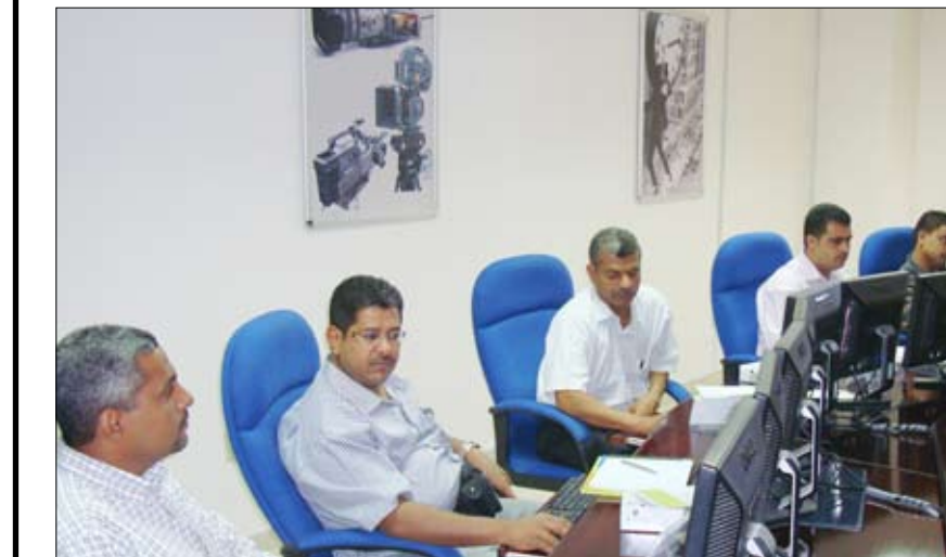
من فعالية تدريب الإعلاميين اليمنيين في مجال التصوير التلفزيوني بالرياض

للعمل الإعلامي. كما سيتعرف المشاركون في الدورتين على تجربة المملكة العربية السعودية الإعلامية في مختلف التخصصات من خلال زيارة عدد من المؤسسات الإعلامية للتعرف على بيئات عمل اعلامية جديدة فضلاً عن الأطلاع على معالم المملكة التاريخية والثقافية ونهضتها العمرانية. يذكر ان معهد الأمير احمد بن سلمان للإعلام التطبيقي بالرياض نظم خلال الفترة الماضية دورات متخصصة في مجالات الإعلام المختلفة شملت (98) إعلامياً وعاملياً من مختلف المؤسسات الإعلامية اليمنية في مجالات التحرير الصحفي والتحقيق والخبر والقصة الخبرية والصحافة الإلكترونية والتحرير الإخباري الإذاعي والتلفزيوني ومهارات التعامل مع الراي العام والتصوير الصحفي الإحتراقي.