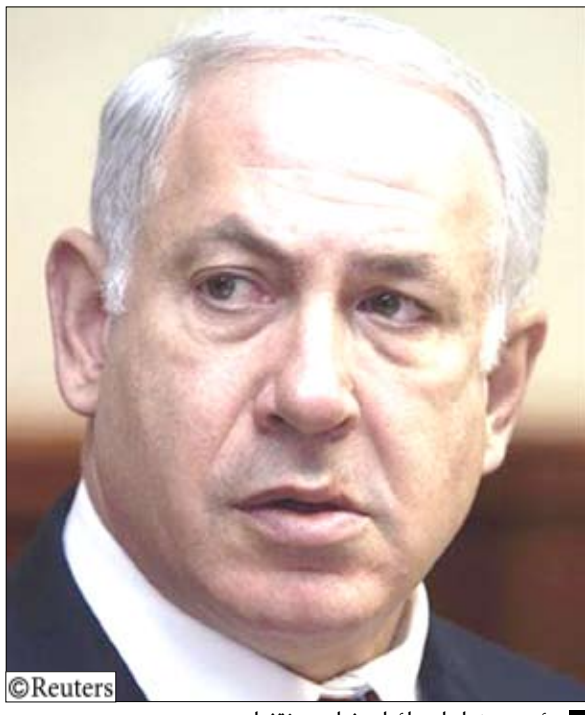
رئيس وزراء اسرائيل بنيامين نتنياهو

يجب منح اسرائيل عضوية حلف الاطلسي وتحالف عسكري مع الولايات المتحدة "كشيء مقابل شيء". وعند سؤاله عن صعد نادر في العلاقات بين اسرائيل والولايات المتحدة بسبب بناء المستوطنات اليهودية في الضفة الغربية قال اراد ان من الضروري ان تحتفظ اسرائيل بتحالف وثيق مع حليفها القديمة وفي نفس الوقت ترسخ لعلاقات مع قوى أخرى مثل الاتحاد الاوروبي وروسيا والصين والهند.