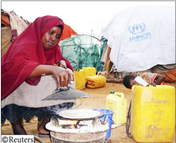
صومالية في مخيم للنزوحين بضواحي مقديشو أمس السبت

الموترو ونيران المدافع الرشاشة. وقال علي موسى وهو سائق سيارة إسعاف لرويترز "الشوارع مروعة وتفوح منها رائحة الدم". وقال ضابط كبير بالشرطة ان مدير ادارة الامن بمقديشو قتل في اشتباكات في وقت مبكر من صباح أمس السبت. وعرضت الحكومة جثة قالت انها لمواطن افغانى يقاتل مع الحزب الاسلامي وهو مظلة لجماعات المعارضة يقودها المتشدد شيخ حسن ضاهر عويس. وأبلغ المتحدث العسكري فرحان ارسانيو رويترز "اسرنا آخرين من باكستان وافغانستان واليمن وستعرضهم قريبا".