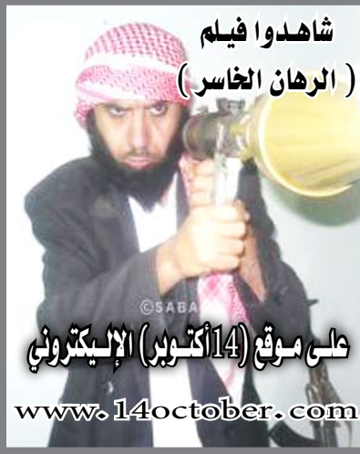
شاهدوا فيلم (الرهان الخاسر) على موقع (أكتوبر) الإلكتروني