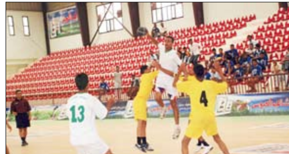
من مباريات كرة اليد