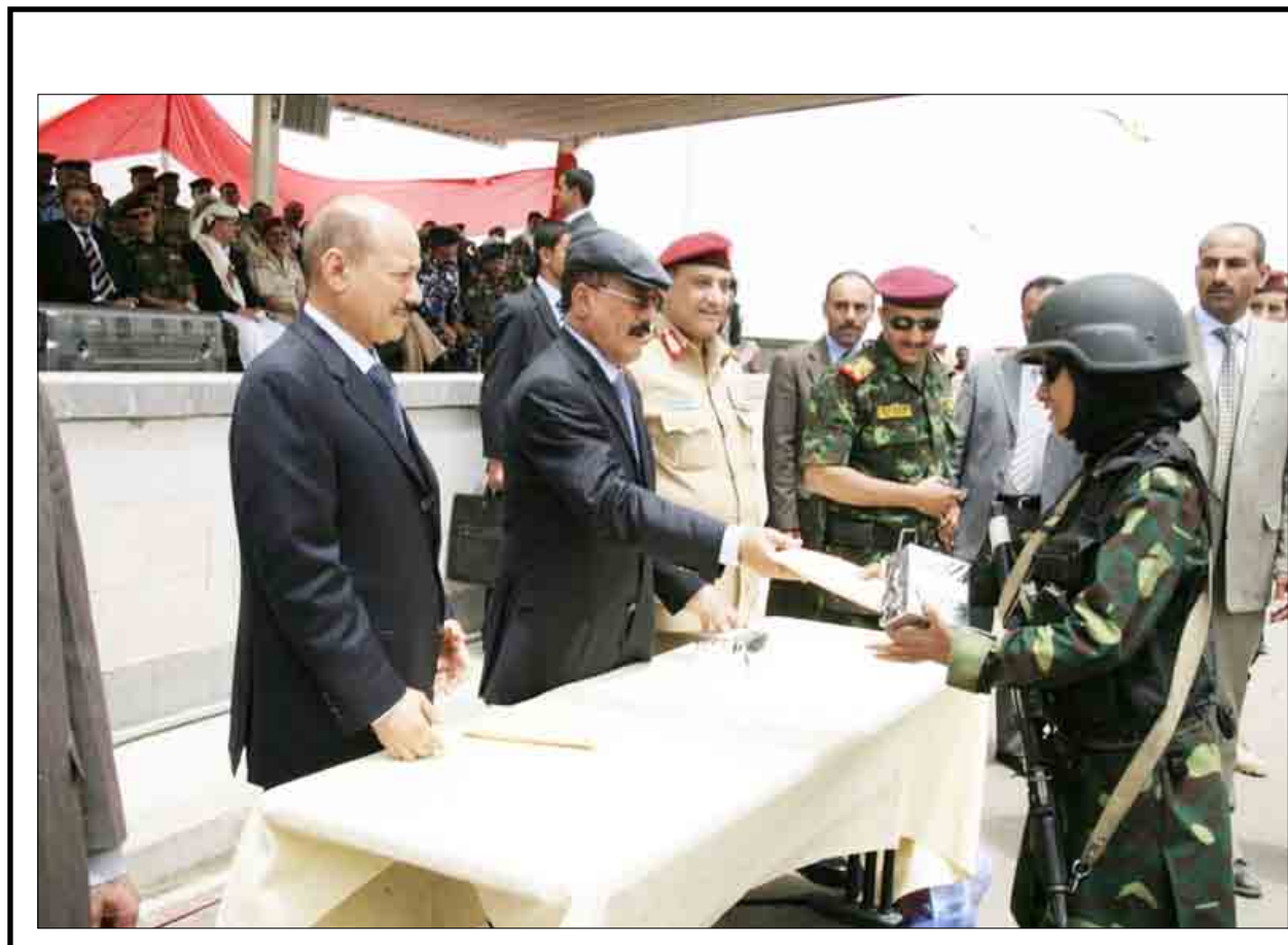
الفتاة اليمنية أثبتت جدارتها في حفظ الأمن والاستقرار وترسيخ دعائم الوحدة الوطنية ولذلك استحققت تكريمها من قبل القيادة السياسية ممثلة بفخامة الأخ علي عبدالله صالح رئيس الجمهورية أول أمس.

لم يسبق أن ذكرت في كتب الفقه المتداولة. ولفت إلى حاجة طلاب العلم خصوصاً الدعوة إلى الله وسائر المسلمين عموماً إلى آراء فقهية مستندة إلى أدلة صحيحة من الكتاب والسنة غير متحيزة إلى مذهب من المذاهب الإسلامية في كثير من قضايا العبادات والمعاملات ولإضافة في المسائل التي لم ترد بشأنها نصوص صحيحة صريحة تبين حكم الشرع فيها. وأوضح أن الكتاب مفيد لطلاب العلوم الشرعية والدعاة ومدرسي الفقه في الجامعات والطلقات والمدارس وقضاة المحاكم الشرعية، بالإضافة إلى صلاحيتها لأن يكون مرجحاً في البيت لكل مسلم ومسلمة للاستفتاء عن الأحكام الشرعية التي قد تستدعي الحاجة وجوب معرفتها في أي باب من أبواب الفقه سواء كانت في عبادات أو معاملات أو أحوال شخصية أو غيرها من أحكام الفقه الإسلامي.