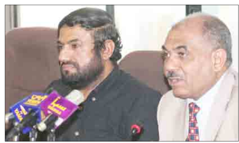
وزير الإعلام لدى ترؤسه اجتماع اللجنة العليا للتخطيط البرامجي

اختتمت اللجنة العليا للتخطيط البرامجي بالمؤسسة العامة للإذاعة والتلفزيون اجتماعها أمس برئاسة وزير الإعلام رئيس مجلس الإدارة حسن الوزني لمناقشة برامج الدورة الرضائية القادمة للقنوات الفضائية والإذاعات الوطنية والمحلية. وناقشت اللجنة في ثلاثة أيام نتائج الاستبيان الخاص بالدورة البرامجية الرضائية الماضية ومشروع الخارطة البرامجية لدورة رمضان المقبل لجميع القنوات والإذاعات، ووقفت أمام تصورات برامج وأعمال تلفزيونية جديدة. وتمثلت أعمال اليوم الأخير للاجتماع في مناقشة الخارطة البرامجية الخاصة بالإذاعات والوطنيتين والإذاعات المحلية التي سيتم بثها في شهر رمضان المقبل.