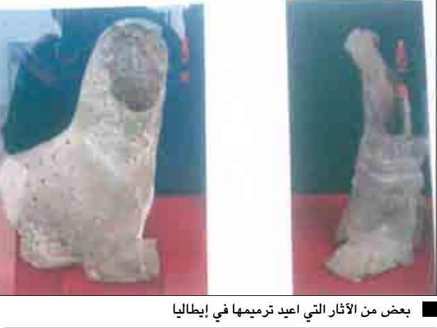
بعض من الآثار التي أعيد ترميمها في إيطاليا

صنعا / سبأ: تصل إلى صنعا اليوم الثلاثاء 19 قطعة أثرية يمنية بعد الانتهاء من ترميمها وعرضها بمعامل ومختبرات جامعة بيزا في إيطاليا. وقال رئيس الهيئة العامة للآثار والمتاحف الدكتور عبدالله باوزير "إن القطع الأثرية الـ 19 استصلت اليوم الثلاثاء، إلى صنعا، بعد أن تم صيانتها وترميمها وعرضها بجامعة بيزا الإيطالية في إطار التعاون بين الهيئة والجامعة". وأشار إلى أن القطع الأثرية التي تضم تماثيل لأشكال بشرية وحيوانية، وأواني وأساوور جميعها من البرونز، وتعود إلى العصور الحجرية، سيتم عرضها بالمتحف الوطني بصنعا لمدة يومين قبل إعادة ترميم مكانها الأصلي بمتحف بينون بمديرية الحعاء محافظة ذمار. وكانت القطع الأثرية غادرت صنعا في 13 أكتوبر من العام الماضي، من جهة أخرى يبد فريق من جامعة بيزا الإيطالية غدا تصوير فيلم وثائقي عن المعالم التاريخية والبيئية والطبيعية في اليمن. وبحسب رئيس هيئة الآثار والمتاحف فإن الفريق الذي يضم مصورين وخبيرين في مجال ترميم وتوثيق التراث الثقافي، سيوزر متاحف: "بينون" وعدن وذمار، لتحديد احتياجاتها من المعامل وأجهزة ترميم الآثار التي تكلفت جامعة بيزا بتقديمها بالتعاون الثلاثة في إطار اتفاقية للتعاون الموقعة مع العام الماضي.