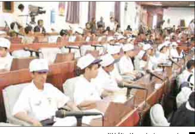
جانب من جلسات برلمان الأطفال

صنعا / سبأ: بدأ أمس برلمان الأطفال أولى جلسات أعمال فترة انعقاده الحالية والتي ستستمر حتى 8 يوليو الجاري تحت شعار الزواج المبكر مسؤولية المشرع برئاسة رئيسة البرلمان ندى الشراعي وذلك بالقاعة الصغرى لمجلس النواب. وفي الجلسة تحدث وكيل وزارة التربية والتعليم محمد هادي طواف عن الدور الذي تضطلع به الوزارة في التوعية بالظواهر السلبية للزواج المبكر للأطفال لاسيما في اوساط الفتيات وأثر ذلك سلبا على الفرد والأسرة والتنمية. وأكد أن الوزارة تعمل للحد والقضاء على هذه الظاهرة من خلال برامجها المختلفة والمنهج المدرسي والأنشطة الصيفية، وكذا من خلال البرامج والمشورات التي تصدرها الإدارة العامة للاعلام التربوي على المستوى المهني والمحلي ومن خلال برنامج الإذاعة المدرسية الذي يبيث يوميا عبر إذاعة صنعا، والتي تخصص حلقات حول هذه الظاهرة السلبية التي تسهم في تشجيع الطلاب والطالبات على التسرب من المدرسة. وأشار إلى أن الوزارة تعمل عبر المجتمعات والمراكز الصيفية والمسابقات والأنشطة الثقافية والعلمية والاجتماعية لتوعية المجتمع بالآثار السلبية لهذه الظاهرة على الجانب الانتاجي والمعيشي لاسوة. كما تحدث في الجلسة وكيل وزارة الادارة المحلية خديجة ردمان ومدير ادارة المرأة بوزارة الصحة الدكتورة ايمان قباطي ومدير البرامج بمنظمة رعاية الأطفال لوشيان حول مدى اهتمام تلك المرافق والمؤسسات بشؤون الطفل ومناهضة الزواج المبكر لما له من آثار سلبية ليس على الفتاة فحسب بل على الأسرة والمجتمع بشكل عام.