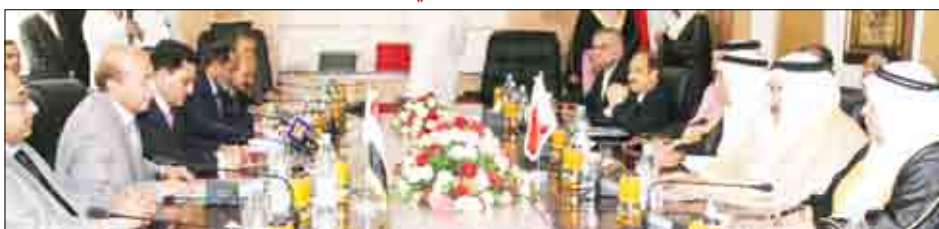
جلسة مباحثات يمنية بحرينية

وأسمى الشيخ خالد بن أحمد بن محمد آل خليفة، وذلك بالتوقيع على محضر اجتماعات الدورة والذي تضمن مذكرتي تفاهم وسبعة برامج تنفيذية للتعاون بين البلدين. أكد وزير الخارجية البحريني دعم بلاده لتضامن اليمن إلى مجلس التعاون لدول الخليج العربية مجدداً موقف مملكة البحرين الداعم لليمن ووحدته وأمنه واستقراره.