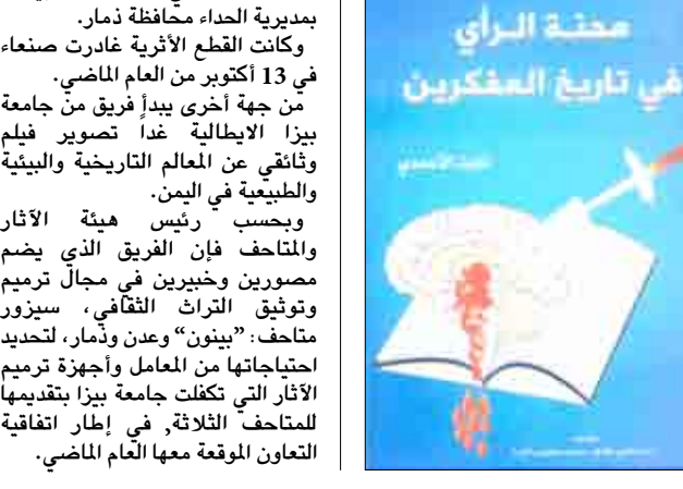
صدر مؤخرًا للباحث والكاتب ثابت الأحمد كتاب بعنوان "محنة الرأي في تاريخ المفكرين".