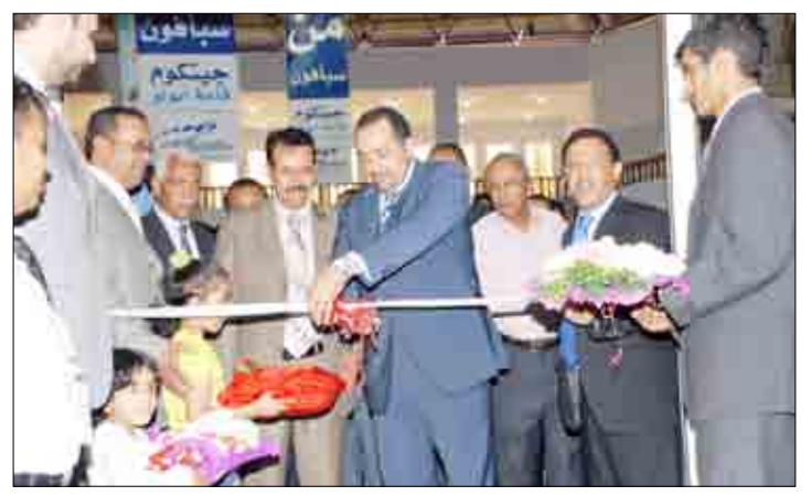
الجبري وشملان لدى افتتاحهما معرض الجزيرة الـ (11) لتقنية المعلومات جينكوم 2009م

صنعا / سبأ: افتتح وزير الاتصالات وتقنية المعلومات المهندس كمال حسين الجبري ووزير الثروة السمكية محمد صالح شملان أمس بصنعا معرض الجزيرة الـ 11 لتقنية المعلومات والاتصالات "جينكوم 2009م". وتشارك في المعرض 32 شركة عالمية متخصصة في مجال الاتصالات وتقنية المعلومات. وعقب الافتتاح، طاف وزير الاتصالات وتقنية المعلومات بأقسام المعرض، واطلع على محتوياته من مختلف الماركات الالكترونية الحديثة من مختلف الماركات والشركات والمؤسسات التجارية المشاركة في المعرض. وأستمع إلى شرح من مدير عام المعرض بشركة أبولو توفيق النهي عن محتويات المعرض من منتجات الشركات المحلية العربية والدولية العاملة في مجال الكمبيوتر وتقنية المعلومات والاتصالات والموبايلات وخدمات الهاتف والشبكات والانترنت.. مشيرا إلى أن المعرض يغطي احتياجات قطاعات الأعمال والاستثمار وغيرها من القطاعات التي تستند بشكل أساسي في نشاطها على التقنيات الحديثة. كما أطلع وزيرا الاتصالات والثروة السمكية على الخدمة الجديدة التي تقدمها مؤسسة الاتصالات السلكية واللاسلكية والمتصلة بخدمة الهاتف المرئي التي تم إدخالها بتقنية الجيل التالي (إن. جي. إن) الذي يدعم العمل بمجموعة الشبكات المختلفة من حيث التقنيات التي تقوم عليها.