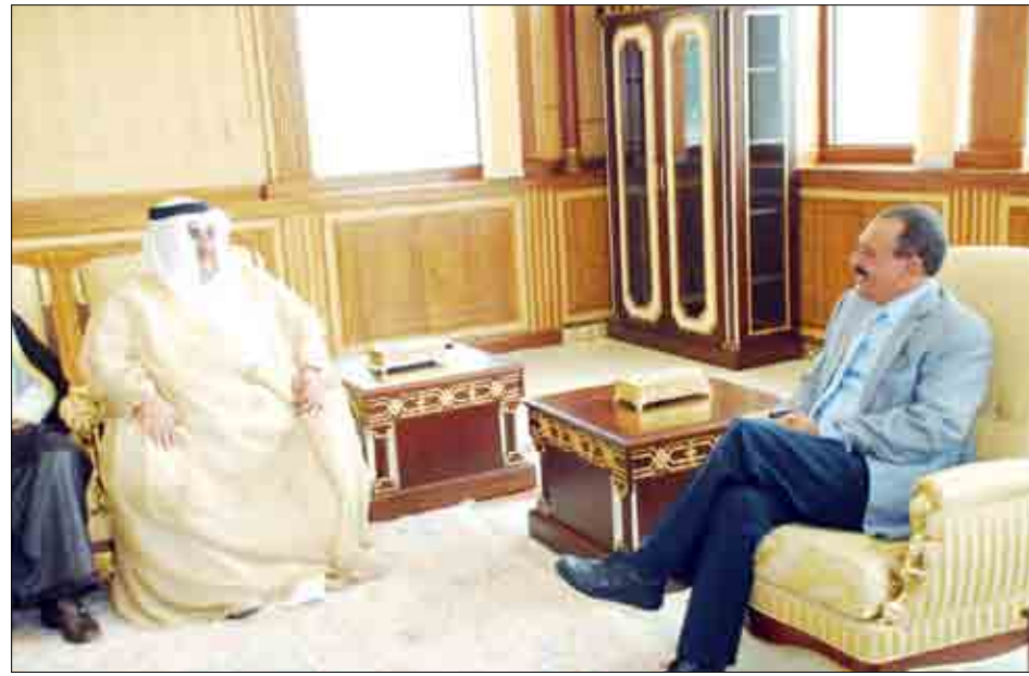
رئيس الجمهورية أثناء استقباله وزير خارجية البحرين

استقبل فخامة الأخ الرئيس علي عبدالله صالح رئيس الجمهورية أمس ومع الأخ عبد ربه منصور هادي نائب رئيس الجمهورية الأخ الشيخ خالد بن أحمد آل خليفة وزير خارجية مملكة البحرين الشقيقة رئيس الجانب البحريني في اللجنة اليمنية - البحرينية المشتركة التي انعقدت في العاصمة صنعاء. وقد نقل وزير الخارجية البحريني لفخامة الأخ رئيس الجمهورية تحيات جلالة الملك حمد بن عيسى بن سلمان آل خليفة ملك مملكة البحرين وتمنياته لفخامته بموفور الصحة والسعادة وللشعب اليمني الشقيق دوام التقدم والازدهار. وجرى خلال المقابلة تناول العلاقات الأخوية ومجالات التعاون المشترك بين بلادنا والبحرين على مختلف الأصعدة وتناقل اجتماعات اللجنة اليمنية - البحرينية المشتركة التي انعقدت بصنعاء وأسفر عنها التوقيع على