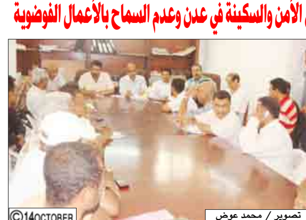
عبدان الجفري أثناء اجتماعه بأعضاء السلطة المحلية والشخصيات الاجتماعية

عبدان الجفري: أكد الدكتور عدنان عمر الجفري ، محافظ عدن أهمية استتباب الأمن والسكينة بجميع مديريات محافظة عدن ، داعياً إلى ضرورة الحفاظ على سلامة المواطنين وممتلكاتهم وعدم السماح لأية ممارسات او محاولات قد تقوم بها العناصر الخارجة على القانون بغرض إثارة الفوضى والعنف بالمحافظة. جاء ذلك أثناء الزيارة التي قام بها الأخ المحافظ ومعه الأخ عبدالكريم شائف، الأمين العام لمحلي عدن أمس لمديريتي الشيخ عثمان والمنصورة ، حيث عقدا لقائين