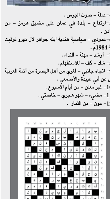
حل العدد الماضي

أفقياً: رحلة أندلسي أصله من بنسبة سافر إلى مكة ماراً بتونس والسنكرية وصف رحلته في كتاب مشهور (الرحلة المغربية) - حرف جر. شهر ميلادي - من الحمضيات. بابسة - ضياء - حرف انجليزي - بحر. للاستفهام - في البيضة - من الطيور. من كبار شعراء الفرس حج إلى مكة وزار البلاد العربية دون أخبار رحلته في كتاب مشهور ( سفر نامه ) . جمع ابرة - من الفصول الأربعة - نقيض أيسر. خاصتي - اله - من جبال عدن - فاصل. أحرف مكررة - خراب . عملة - من الألوان . عبودية - ضمير - برد . من أسماء الشمس - عقائد - للنفي . عاصمة قبرص - بساند .