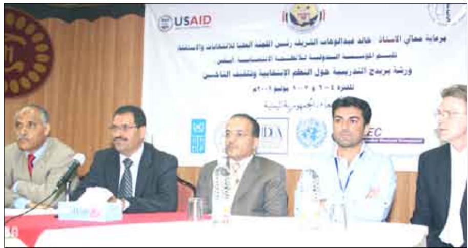
البرنامج الدولي المسمى ( بناء القدرات في مجالات الديمقراطية والحوكمة والانتخابات )