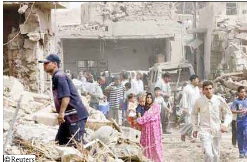
سكان يتجمعون عند موقع انفجار في كركوك يوم 20 يونيو 2009

ويخشى عراقيون أن يصبحوا أكثر عرضة لهجمات المسلحين بعد انسحاب القوات الأمريكية إلى قواعدها تماشياً مع الخطوة الأولى تجاه الانسحاب الأمريكي الكامل بحلول عام 2012 وفقاً لما تنص عليه الاتفاقية الأمنية بين العراق والولايات المتحدة. وتصر الحكومة العراقية على أن قواتها الأمنية قادرة على التعامل مع أي تهديدات. على صعيد آخر اجتمع نائب الرئيس الأمريكي جو بايدن مع القوات الأمريكية التي احتفلت بعبلة عيد الاستقلال أمس السبت في اليوم الثالث من زيارة استخدمها في حد السباسبين العراقيين على بذل مزيد من الجهد من أجل مصالحة القراء المتناهسين. كما ترأس بايدن الذي طلب منه الرئيس الأمريكي باراك أوباما القيام بدور رئيسي في تنسيق السياسة الأمريكية العراقية مراسم منح الجنسية الأمريكية إلى 237 جندياً من 59 دولة أثناء أداء القسم.