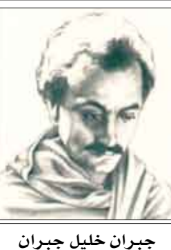
جبران خليل جبران