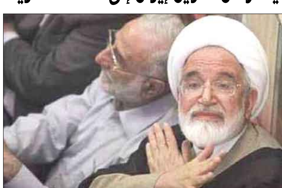
الزعيم الإصلاحي المعارض مهدي كرويبي

14 طهران/مناياعات: زار الزعيم الإصلاحي مهدي كرويبي أمس السبت منازل المعتقلين في السجون الإيرانية ومنهم محمد علي ابطحي، وأحمد زيداآبادي، ومحمّد قوجاني وعبدالله مومني، وموجها انتقادات شديدة للحكومة وقال أن السياسة الحالية تحول إيران إلى ثكنة عسكرية. من جانبه وجه الرئيس الإيراني السابق محمد خاتمي رسالة إلى رئيس القضاء محمود هاشمي شاهرودي طلب منه الإفراج عن المعتقلين من الناشطين السياسيين والصحافيين والطلاب. واستدعت دول الاتحاد الأوروبي سفراء إيران في الاتحاد: لاجتجاج على اعتقال موظفين إيرانيين يعملون في السفارة البريطانية في طهران.