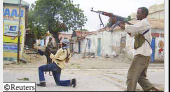
متشددون من شباب المجاهدين قرب القصر الجمهوري

مقديشو/وكالات: وقد شنت القوات المتحدة الأمريكية استعدادها لتقديم دعم لوجستي ومالي لحكومة الرئيس الصومالي شريف شيخ أحمد التي تخوض صراعاً مسلحاً مع مقاتلي حركة الشباب المجاهدين والحزب الإسلامي على مشارف القصر الرئاسي في العاصمة مقديشو. وجاء هذا الوعد الأمريكي في لقاء جمع الرئيس الصومالي مع جوني كارسون مساعد وزير الخارجية الأمريكية للشؤون الأفريقية على هامش قمة الاتحاد الأفريقي التي عقدت بمدينة سرت الليبية. وذكر مصدر صحفي في مقديشو إن الحكومة الصومالية إذا شعرت بالخطر يتزايد عليها فقد تطلب تدخلا عسكرياً أميركياً على شكل قصف جوي للمواقع التي تسيطر عليها المعارضة المسلحة.