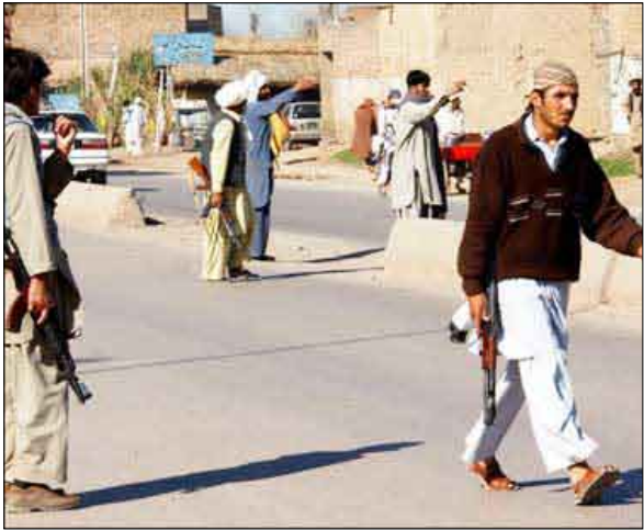
مظاهر مسلحة في شمال غرب باكستان

14 أكتوبر/رويترز: أفاد مستوطن باكستانيون إن 16 شخصاً على الأقل قتلوا في أحد اشتباكات بين مسلحين من حركة طالبان باكستان وعناصر قبليّة موالية للحكومة في شمال غرب باكستان. ووقعت الاشتباكات التي أسفرت عن 12 قتيلاً من رجال القبائل وأربعة من طالبان في منطقة مهمنند، وهي جزء مما يعرف بالحزام القبلي الذي يبعد عن سيطرة الدولة القانونية قرب الحدود مع أفغانستان. وتعد تلك الاشتباكات هي الأولى في غضون عدة شهور بين مسلحي طالبان ورجال القبائل الذين تلقوا تحذيرات من الجيش الباكستاني بالتدخل في حالة عدم قتل أو طرد "للمتمردين". وقد تعرض رجال القبائل لهجمات من قبل المسلحين منذ