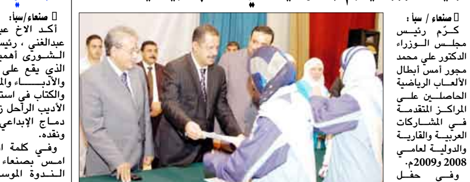
صنعاء/ سبأ : كرم رئيس مجلس الوزراء الدكتور علي محمد مجور أمس أبطال الألعاب الرياضية الحاصلين على المركز المتقدم في المشاركات العربية والقارية والدولية لعامي 2008م. وفي حفل التكريم الذي حضرته قيادة الشباب والرياضة، وعدد الوزراء الكبير الذي توليه الحكومة في رعاية الألفية والدولية. (التفاصيل 15)

وزير الإعلام خلال اجتماع اللجنة العليا للتخطيط البرامجي بالمؤسسة العامة للإذاعة والتلفزيون حضرها على تطور الوطن وتقديم المضطر في مختلف المجالات. وفي كلمته أمس خلال اجتماع اللجنة العليا للتخطيط البرامجي بالمؤسسة العامة للإذاعة والتلفزيون شدد الوزير على ضرورة مواصلة تجويد ثمار هذه الحرية لخدمة الوعي والعلم 2 <<