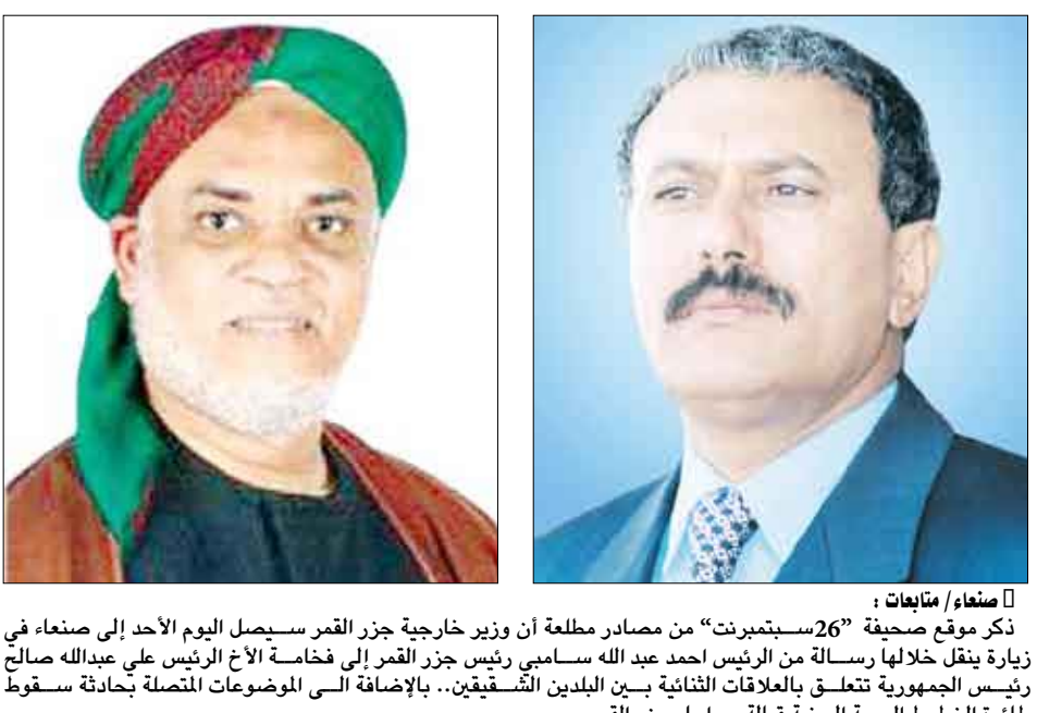
صنعاء/ متابعات : ذكر موقع صحيفة «26 سبتمبر» من مصادر مطلعة أن وزير خارجية جزر القمر سيسهل اليوم الأحد إلى صنعاء في زيارة ينقل خلالها رسالة من الرئيس احمد عبد الله سامبي رئيس جزر القمر إلى فخامة الأخ الرئيس علي عبدالله صالح رئيس الجمهورية تتعلق بالعلاقات الثنائية بين البلدين الشقيقين. بالإضافة الى الموضوعات المتصلة بجادة سقوط طائرة الخطوط الجوية اليمنية قبالة سواحل جزر القمر.