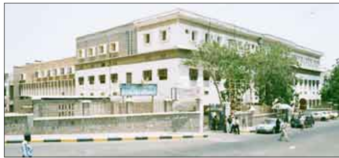
منى كلية الهندسة بالمعلا

إ/عدن/سيا: بلغ عدد المتقدمين لامتحانات القبول للالتحاق بكلية الهندسة بجامعة عدن للعام الدراسي 2009 - 2010 بكافة تخصصاتها 3627 طالباً وطالبة يتنافسون على 500 مقعد للدراسة في الكلية. وأوضح عميد كلية الهندسة بجامعة عدن الدكتور صالح محمد مبارك لوكالة الأنباء اليمنية (سبأ) أن المتقدمين سيخضعون لامتحانات قبول للدراسة في الكلية بكافة تخصصاتها المتمثلة بالهندسة المدنية والميكانيكية والكهربائية وعلوم الكمبيوتر والهندسة المعمارية والإلكترونية والاتصالات وتكنولوجيا المعلومات. وتوقع الدكتور مبارك أن يتخرج من الكلية