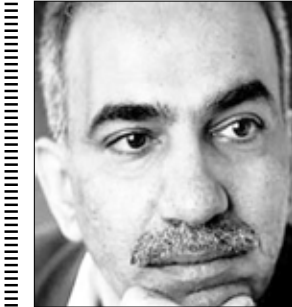
الشاعر العراقي / عبدان الصانع

للحزن نافذة، في القلب، سيدي وللمساءة.. أشعار ومصباح معتق خمر احزاني.. أيشربه قلبي، وفي كل جرح منه أفدأح تسافر الريح، ولي، في ضفائرها ومن يطارد ريحاً كيف يرتأح أيواب أطرق باباً أفتحه لا أبصر إلا نفسي باباً أفحه أدخل لا شيء سوى بابٍ آخر يا ربي كم بابايفلني غني