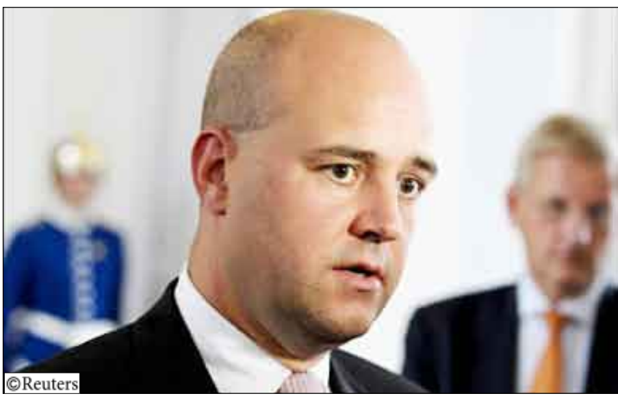
رئيس الوزراء السويدي فريدريك راينفيلد

الناجم عن تصدي الشرطة للمتظاهرين الذين خرجوا إلى الشوارع للاحتجاج على نتيجة الانتخابات لكنها تركت الباب مفتوحا أمام إيران للدخول في مفاوضات بشأن برنامجها النووي السري. وأدت المظاهرات العارمة التي خرجت إلى الشوارع بسبب مزاعم بتزوير انتخابات 12 يونيو حزيران الرئاسية التي فاز فيها الرئيس محمود أحمدي نجاد إلى اخذ الشرطة والمليشيات الإسلامية إجراءات صارمة، وتقول السلطات الإيرانية ان الانتخابات كانت نزيهة. وانتقد قادة الاتحاد الأوروبي الشهر الماضي الطريقة التي تعاملت بها إيران مع الاحتجاجات وطالبوا بالتحقيق في الانتخابات.