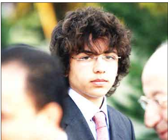
الحسين بن عبدالله بن الحسين