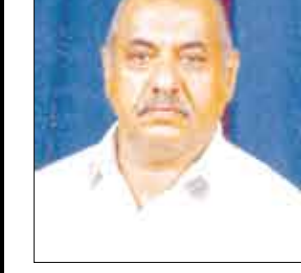
الشيخ الدكتور/ علوي عبدالله طاهر

منذ بزغ نور الإسلام في مكة المكرمة وقيام دولته في المدينة المنورة، كانت الوحدة هي الهدف الأول من رسالته بعد التوحيد، فكل التشريعات الإسلامية تدعو إلى الوحدة، وتعتمد عليها، حتى العبادات امتزجت طقوسها بالوحدة، والقرآن الكريم يقرر أن المسلمين أمة واحدة، قال تعالى: ( وأن هذه أمتكم أمة واحدة وأنا ربكم فاعبدون ) . ولقد قامت هذه الوحدة على أصول واستقرت على دعائم، واستندت إلى منطق قانونية لا يمكن تجاهلها أو ردها.