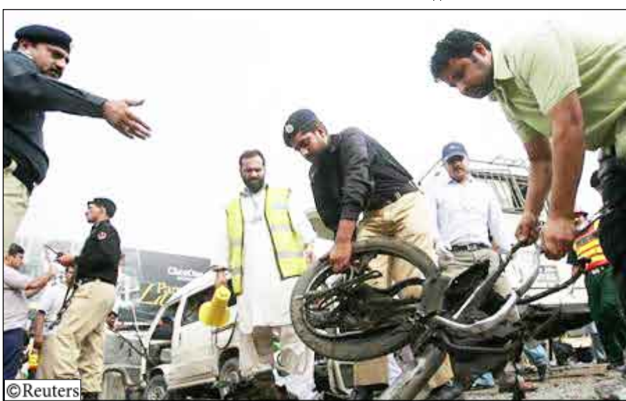
الشرطة بموقع هجوم في روابندي يوم الخميس