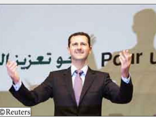
الرئيس السوري / بشار الأسد

14 أكتوبر / رويترز: وجه الرئيس السوري بشار الأسد دعوة بشكل غير رسمي للرئيس الأمريكي باراك أوباما لزيارة دمشق لاجراء محادثات في علامة على إمكانية تحسن العلاقات بين البلدين تدريجيا. وقال الأسد في حديث لشبكة سكاي نيوز في حديث بثت أمس الجمعة «نحن نرحب به في سوريا بالتأكيد...أنا وأضح تماما فيما يتعلق بهذا الأمر».