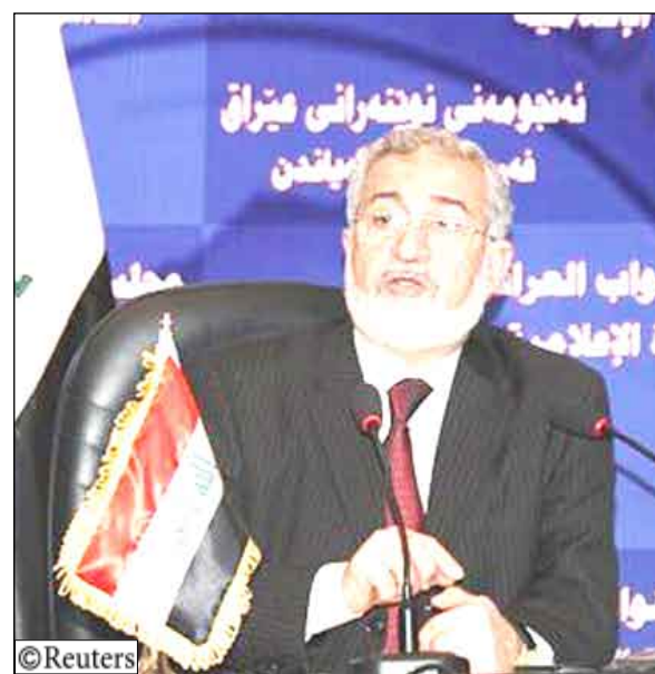
رئيس البرلمان العراقي أياد السامرائي

في تنسيق السياسة بشأن العراق في حين يضع مسؤولون أمريكيون الأساس لانسحاب كامل للقوات الأمريكية بحلول 2012. وفي خطوة مهمة تجاه ذلك انسحاب الكامل سلمت القوات الأمريكية السيطرة على المناطق الحضرية إلى قوات الأمن العراقية هذا الأسبوع. وقال بايدن «هذه لحظة ينبغي علينا أن نتأكد فيها من أن العراقيين لا يصرفون أبصارهم عن الجائزة الأسمى». وقال مسؤولون في البيت الأبيض إن بايدن سيجتمع مع الرئيس جلال الطالباني ورئيس الوزراء نوري المالكي وسيشاور أيضا القادة العسكريين الأمريكيين والقوات الأمريكية بمناسبة عطلة عيد الاستقلال الأمريكي في الرابع من يوليو تموز. وقال مكتب نائب الرئيس في بيان أنه «سيبحث مع زعماء العراق أهمية تحقيق التقدم السياسي الضروري لضمان الاستقرار طويل الأجل للبلاد». وهذه ثاني زيارة يقوم بها بايدن إلى العراق هذا العام وهي الأولى له ككاتب للرئيس. وزار أوباما العراق في إبريل نيسان. وأقام مسؤولون إن بايدن ربما يلتقي مع ابنه جو بايدن الذي يخدم في العراق ضمن وحدة من الحرس الوطني في ديلاوير أرسلت إلى العراق أواخر العام الماضي.