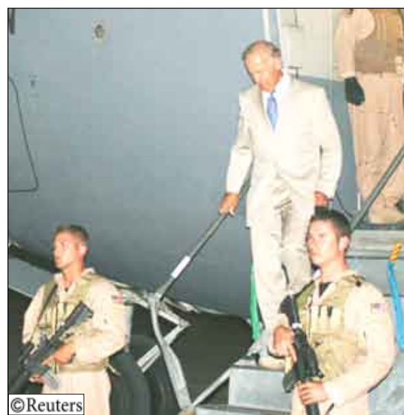
نائب الرئيس الأمريكي / بايدن في بغداد