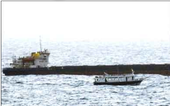
السفينة التي حاولت كسر الحصار عن غزة

عنها إسرائيل الأربعة الماضي لبني مزارو إن كلمة قرصنة تصف بدقة ما قام به الجنود الإسرائيليون، وأكدت أن الحركة «ستستمر بإرسال سفن أخرى إلى غزة لكسر الحصار عن غزة وبقية أنحاء فلسطين». وأضافت الناشطة أن السلطات الإسرائيلية قامت بتفتيش ركاب السفينة في ميناء أسدود فرديا وجماعيا، ووزعت الرجال والنساء، وقتشت حقائبهم الشخصية، ونوهت إلى أن الجنود الإسرائيليين عدوا إلى البحر عن طاقم الجزيرة على متن السفينة ثم أخذوا كاميراتهم. وهذه الرحلة هي السابعة التي تنظمها حركة «غزة الحرة» من قبرص باتجاه القطر الحاصر، وقد أكدت المتحدث باسم الحركة جريتا برلين أنها ستواصل تنظيم رحلات إلى غزة بغض النظر عن اعتراضها، وقالت للمصنفين في قبرص «التأكد سذهب (إلى غزة) حتى لو اضطرتنا للتجديف».