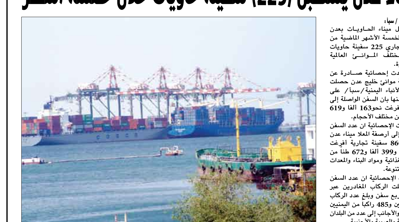
✎ عدن/سبأ؛ استقبل ميناء الحاويات بادن خلال الخمسة الأشهر الماضية من العام الجاري 225 سفينة حاويات من مختلف الموانئ العالمية والمجاورة. وأفادت إحصائية صادرة عن مؤسسة موانئ خليج عدن حصلت وكالة الأنباء اليمنية/سبأ/ على نسخة منها بأن السفن الواسلة إلى الميناء. أفرغت نحو163 ألفا و619 حاوية من مختلف الأحجام. وذكرت الإحصائية أن عدد السفن الوافدة إلى أرصفة ميناء عدن بلغت 860 سفينة تجارية أفرغت مليونين و399 ألفا و672 طناً من المواد الغذائية ومواد البناء والعدوات الفنية المتنوعة. وبينت الإحصائية أن عدد السفن التي أقلت الركاب المغادرين عبر الميناء أربع سفن وبلغ عدد الركاب نحو الفين و485 راكباً من اليمنيين والعرب والأجانب إلى عدد من البلدان الأفريقية والعربية والأجنبية.