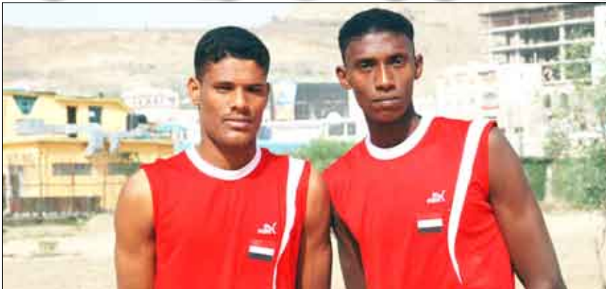
لاعبا المنتخب الوطني لكرة الطائرة الشاطئية