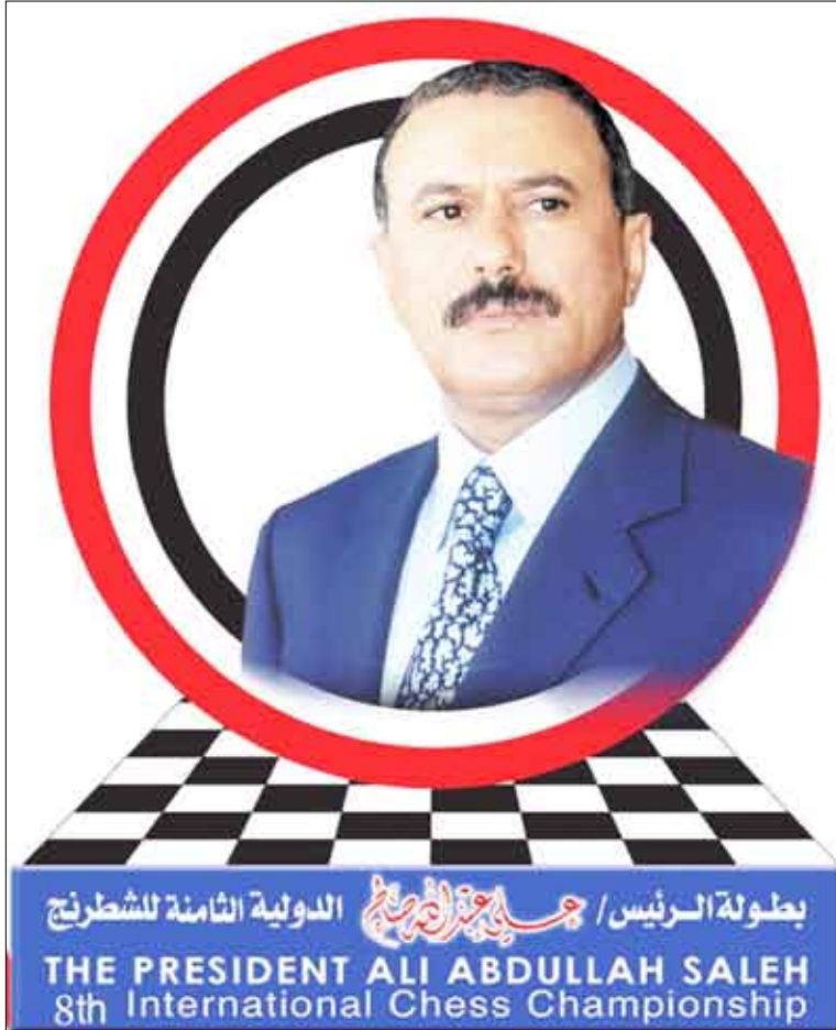
بطولة الرئيس / حمد بن علي الدولية الثامنة للشطرنج THE PRESIDENT ALI ABDULLAH SALEH 8th International Chess Championship

الأكبر إلى مواصلة الجهود في تنظيم أوسع وأشمل للبطولة وتوجيه الدعوة إلى لاعبي وأساتذة دوليين كبار ومصنفين دوليين من أكثر من خمسة وعشرين دولة خلال هذا العام.