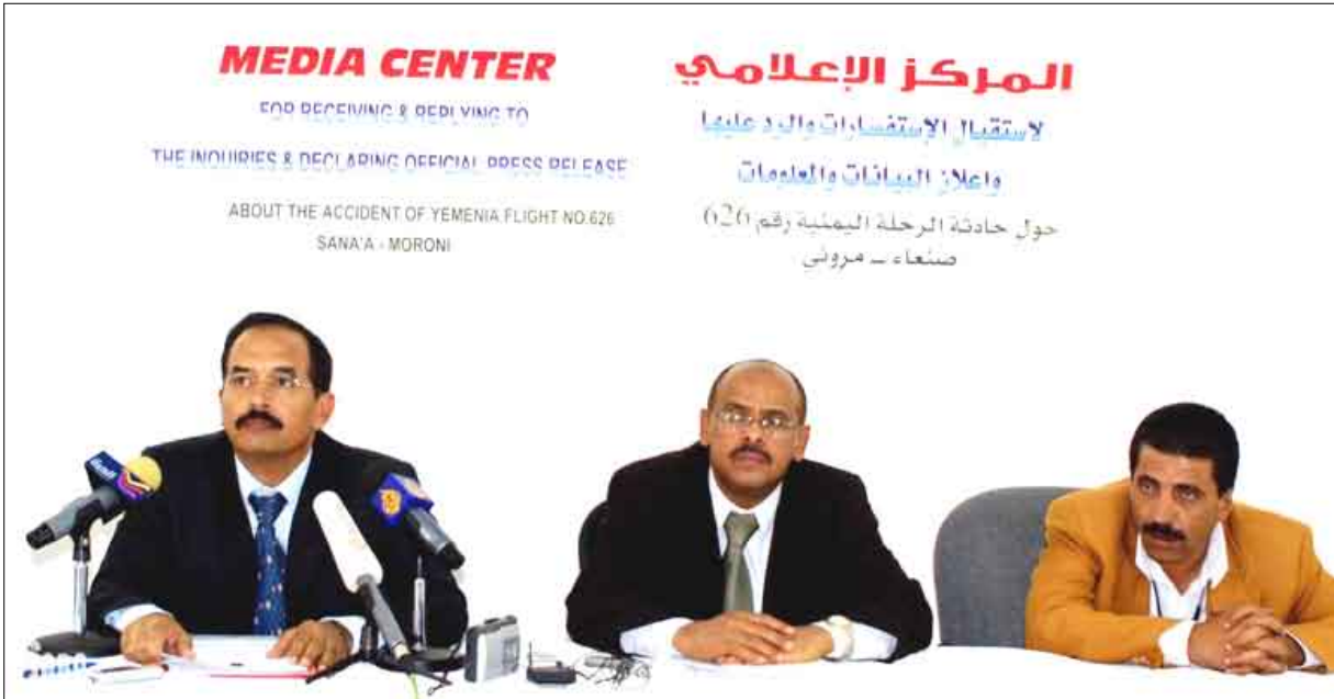
المؤتمر الصحفي حول الطائرة اليمنية المنكوبة

اللجنة لعدة جهات رسمية فإنه لم يتم ما تناقلته بعض وسائل الإعلام وان التاجي الوحيد حتى أمس اليوم هي الفتاة الفرنسية البالغة من العمر 14 عاماً.