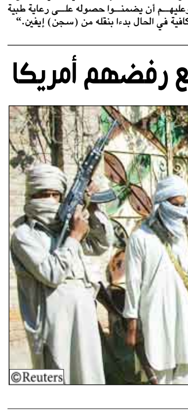
بعض من متشددتي طالبان

واشنطن/ 14 أكتوبر/يو بي سي: أظهر استطلاع للرأي أمس الأربعاء إن الرأي العام في باكستان انقلب بشكل حاد على طالبان وغيره من المتشددين ولكن الباكستانيين ما زالوا لا يتفوقن بالولايات المتحدة وبالرئيس باراك أوباما. وجاء الاستطلاع الذي أجراه موقع وورد بابلوك أوبيتيو دوت أورج في الشهر الماضي فيما يقابل الجيش الباكستاني حركة طالبان في وادي سوات. وتوصل الاستطلاع إلى أن معظم الباكستانيين يرون طالبان الباكستانية وتنظيم القاعدة تهديدا كبيرا للبلاد. وتوصل مشروع الاستطلاع الذي أجرته جامعة مارييلاند إلى أن عدد الباكستانيين الذين يعتبرون المتشددين الإسلاميين وطالبان باكستان تهديدا كبيرا لبلادهم زاد إلى 81 في المائة ارتفاعاً من 34 في المائة في استطلاع مماثل أجري أواخر عام 2007. وارتفع عدد من وصفوا أنشطة طالبان بأنها تهديد خطير للبلاد 41 نقطة مئوية ليصل إلى 82 في المائة في الفترة ذاتها. ويجري برنامج الجامعة الخاص بالسلك إزاء السياسات الدولية استطلاعات على مستوى العالم. وفي الاستطلاع أيدى 70 في المائة من المشاركين تعاطفهم مع حكومتهم فيما يتعلق بالقتال في وادي سوات وهي منطقة اجتاحتها المتشددون في وقت سابق هذا العام. وقال 72 في المائة إنهم وافقون من أن جيش باكستان بمقدوره التكفل بنشوطهم. وقال مدير بحوث الاستطلاع كلاي رامزي في بيان إن التغيير في الرأي العام الباكستاني فيما يتعلق بالمتشددين داخل باكستان يشكل "تغيراً كبيراً" سببه "النقد الواسع" للسلطات والحكومة والسياسات غير الديمقراطية التي تتبناها طالبان بينما سيطرت لفترة وجيزة على سوات. وأضاف أن الاستطلاع أشار إلى "أن الاتحاد المزمع ما زالت مرفوضة كما