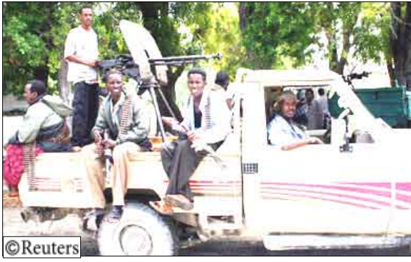
بعض المتشددين الصوماليين

وأضاف "لا يمكننا أن نقول إن هذا خطر واضح يحدق بإثيوبيا". وأوضح بركات "إذا هوجمنا فسندافع عن أنفسنا. لكن ليس لدينا خطط في الوقت الراهن لإرسال قوات إلى هناك من جديد. ليس لديهم القدرة على تهديدنا الآن". وكان الرئيس أحمد وهو معتدل قد فر إلى المنفى بعد تدخل القوات الإثيوبية لكنه انضم إلى عملية السلام في العام الماضي وانتخب في يناير. وتقاتل حكومته المتمردون المتشددين الذين كانوا يوما خلفاء في الحركة المتشددة. وأشارت أديس أبابا إلى أنها تؤيد الحكومة الجديدة لكنها تشجع بالوقت بشأن المتشددين الذين ينظر إليهم على أنهم وكلاء لتنظيم القاعدة لأنهم يسيطرون على مساحات كبيرة من الصومال وهددوا بزعة الاستقرار في كينيا وإثيوبيا.