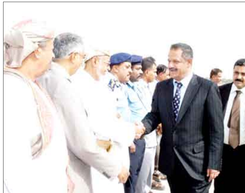
رئيس الوزراء خلال زيارته للمركز الاعلامي بمطار صنعاء الدولي ومتابعته آخر التقارير عن حادثة الطائرة المنكوبة