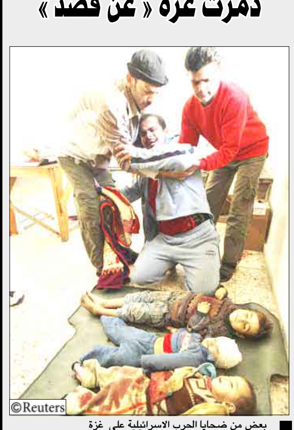
بعض من ضحايا الحرب الاسرائيلية على غزة