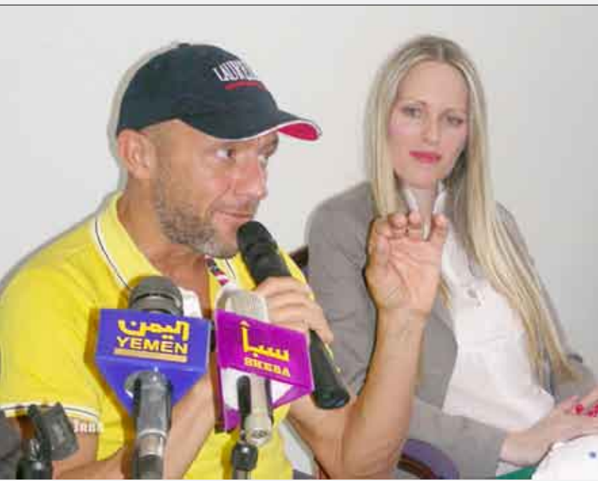
الرحالة الإيطالي وزوجته في المؤتمر الصحفي

اليمني كافة خاصة وأنه قد تعرض قبل سفره إلى اليمن لعدد من النصائح لإثباته عن الذهاب إلى اليمن بسبب سوء الفهم لدى العالم الغربي عن الوطن العربي ولكن هذا لم يثنه عن زيارة الأراضي المقدسة في القدس وقطع صحراء سيناء عابراً حدود عدد من الدول. وقال لقد سمعت عن اليمن الكثير وأردت الاطلاع عليها عن قرب لمعرفة حقائق ما يروج له الإعلام الغربي من سوءة سيناء لليمن فاليمن بلد جميل ليس بما تحوي من بنى سياحية فقط وإنما بأخلاق وقيم سكانها الطيبين وهو ما جعلني أكثر تعلقاً بهذا البلد المحب للحب والسلام.