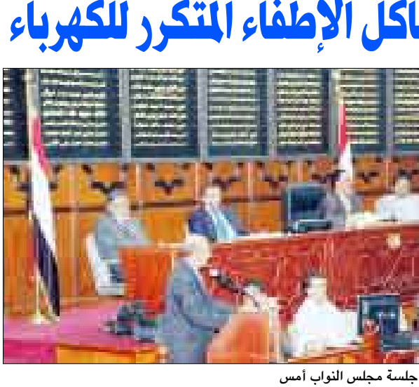
من جلسة مجلس النواب أمس

بدأت محكمة الميناء الابتدائية بعدن أمس محاكمة /22/ صوماليا بتهمة التورط في عمليات قرصنة ضد السفن أثناء مرورها في الخطوط الملاحية الدولية بخليج عدن. واستمعت المحكمة في جلستها برئاسة القاضي / محمد حمود أحمد الأبيض، إلى قرار الاتهام الموجه من النيابة والذي تضمن توجيه تهمة اختطاف السفن إلى 10 متهمين وكذا تهمة الشروع باختطاف لـ 12 متهما. ووجهت المحكمة بتوفير مترجم للمتهمين لعدم إجادتهم اللغة العربية. ووافقت على طلب محامى الدفاع بتسليمه نسخة من ملف القضية ليتمكن من الاطلاع عليه ودراسة تمهيدا لإعداد الرد.