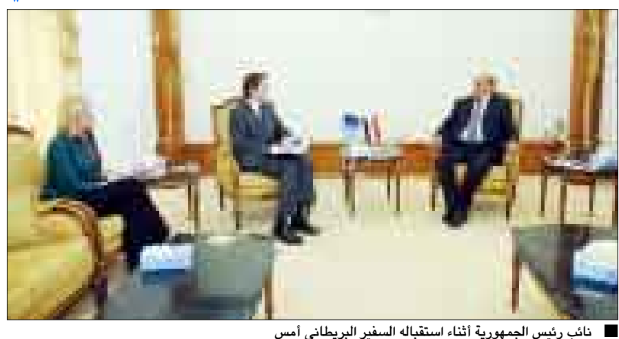
نائب رئيس الجمهورية أثناء استقباله السفير البريطاني أمس

استقبل الأخ عبدربه منصور هادي نائب رئيس الجمهورية أمس سعادة تيم تورتو سفير بريطانيا لدى صنعاء ومعه السيدة هيلين فلوكر - مسئولة شؤون اليمن بوزارة الخارجية البريطانية، وتناول اللقاء عدداً من القضايا والموضوعات المتصلة بالعلاقات الثنائية بين البلدين الصديقين وأوجه التعاون في مجال مكافحة الإرهاب والقرصنة البحرية. وبهذا الصدد عبر الأخ نائب رئيس الجمهورية عن تقديره وشكره لما تقدمته الحكومة البريطانية من مساعدات لتدريب وتأهيل الكوادر العسكرية اليمنية المتخصصة في مكافحة الإرهاب والقرصنة، مشيداً بتطور العلاقات اليمنية البريطانية في مختلف المجالات. من جانبه أكد السفير البريطاني موقف بريطانيا الثابت تجاه وحدة اليمن وأمنه واستقراره.