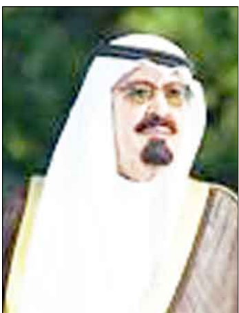
الملك عبدالله بن عبدالعزيز

الوحدة الوطنية، وأن هذا الملتقى المبارك يهدف بناء على ذلك إلى تسليط الضوء على أهمية الحوار في رقي المجتمعات، ويحث سبل نشر ثقافة الحوار وتعزيزها في المجتمع، والتعريف بجهود المركز في نشر ثقافة الحوار، وتعزيز التواصل بين المدرّبين المعتمدين ومركز الملك عبدالعزيز للحوار الوطني، وتطوير البرامج التدريبية لنشر ثقافة الحوار، كما يهدف إلى تفعيل التواصل بين المركز والمدرّبين المعتمدين في مختلف مناطق المملكة، والوقوف على اللامح الجديدة لفعاليات المركز التي تستهدف مختلف شرائح المجتمع. من جانبه أكد الأمين العام للمركز الملك عبدالعزيز للحوار الوطني معالي الأستاذ فيصل بن عبدالرحمن بن معمر أن هذا الملتقى الموسع سوف يشارك فيه مئات من المدرّبين والمدربات حيث تم تدريب أكثر من 1200 من المدرّبين والمعتمدين، ويأتي في سياق الجهود التدريبية المتواصلة من قبل المركز لإعداد مجموعة كبيرة من المدربات والمدرّبين المعتمدين يقودون ركب التعريف بثقافة الحوار وقيم الوسطية والتسامح والاعتدال في مختلف أنحاء المملكة، وأن الجهود التي يقوم بها مركز الملك عبدالعزيز للحوار الوطني سوف تتواصل حتى يتم تاصيل هذه الثقافة الحوارية في المجتمع السعودي، عبر كل بيت ومسجد ومدرسة، وحتى يصبح الحوار قيمة أساسية وجوهريّة في حياة أبناء الوطن.