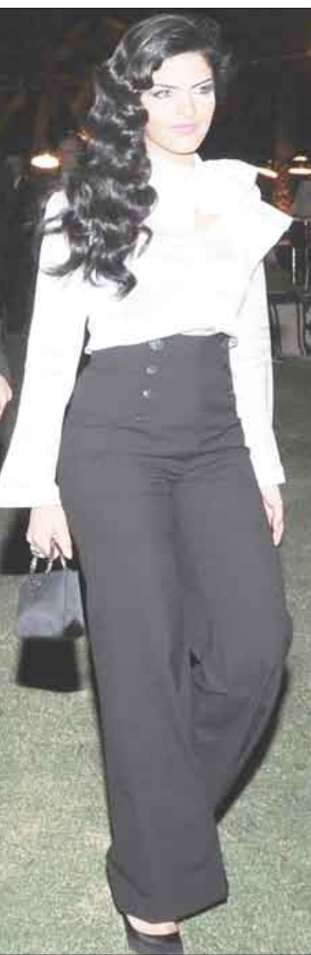
سمو الأميرة أميرة الطويل

تحتضن من جراء فيضانات انهيار السد الجاور.