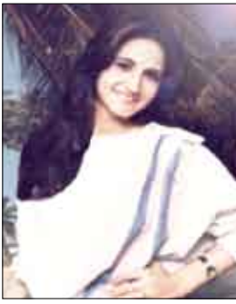
الشاعرة السورية / سوسن السباعي