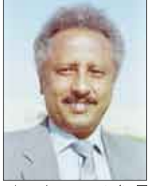
الروائي/ زيد مطيع دماج

سيتم خلال الندوة إعلان موقع الأديب الراحل على شبكة الانترنت. وتقام هذه الندوة بعد تسعة أعوام من رحيل الأديب الكبير والشخصية الوطنية والاجتماعية البارزة زيد مطيع دماج، الذي عرف بآراء وتجربته ونوعه أسلوبه وقدرته موهبته المبكرة في إقبال عطائه السريدي بتأثير إلى ذاكرة القارئ العربي، إضافة إلى القارئ العالمي، عبر ترجمات لبعض أعماله وأهمها روايته "الرهينة"، التي تعد أشهر رواية في اليمن، والمتخذة كواحدة من أهم مائة رواية عربية خلال القرن العشرين.