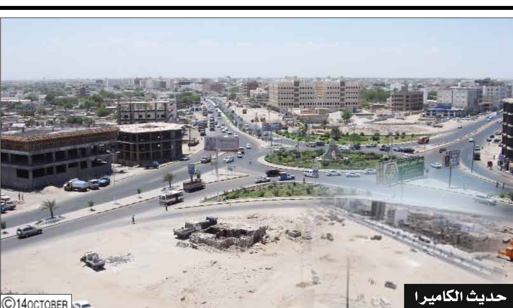
حديث الكاميرا تصوير وتعليق / علي الدرب: كثير من الشوارع الداخلية لمدينة دار سعد تعاني من انتشار مخلفات البناء إلى جانب طرقها الترابية واكوام المخلفات في أركانها مسببة الإزعاج والمضايقة للسكان وتشويه المنظر العام.. الجميع يمتن اهتمام الجهات المسؤولة لهذه الشوارع المنسية.