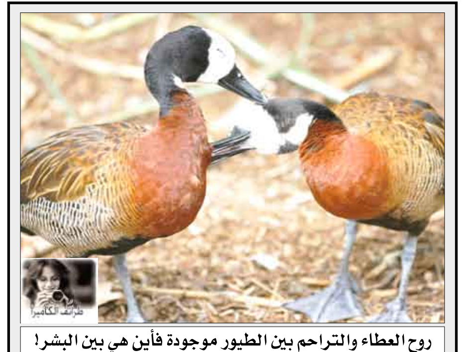
روح العطاء والتراحم بين الطيور موجودة فأين هي بين البشر!

أفقيا: أشهر علماء اللغة وواضع علم العروض من أهل البصرة معلم سيبويه والأصمعي له ( كتاب العين ) أول معجم عربي على الحروف توفى سنة 786م. البقرة الجميلة العينين - بيت الدجاج - برهان . لاعب كرة قدم برازيلي عالمي - حرف جر . عملة - من الزهور العظمية - شتم . واحة في الجزائر بولاية الوحات قرب الحدود التونسية - قاسط . حليب - للاستفهام - مدخل . بلد أوروبي - حرف نصب ( معكوس ) . متشابهان - قريب - رفيع الشأن والمكان . فيلسوف يوناني ولد في أثينا وعلم فيها فأحدث ثورة في الفلسفة بأسلوبه وفكره حارب السفسطة وانتقد الحكم فاتهمه أخصاهم بالزندقة وحكموا عليه بالإعدام فشرّب السم ومات في سجنه - منطقة بمنية . مادة توجد في الملح - من الطيور - نوع من الخيول . عون - نفع - قسم . من أقسام الجسم - مضي . عموديا: من أشهر شعراء الجاهلية صاحب المعلقة الأولى ومطلعها: