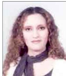
الشاعرة العراقية / أفرح الكبيسي