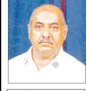
الشيخ الدكتور/ علوي عبدالله طاهر

التعصب خلق مذموم، وصفة مردولة، وعادة قبيحة، والحول عن التقليد الأسمى أو الحول المتطرف، ودافع الأناثية وحب الذات وعدم التقدير لشعور الغير وحقوقهم والواجبات الاجتماعية، وهو في جميع أشكاله وظواهره له نتائج خطيرة وأثار سيئة له الفرد والمجتمع، ولهذا فإن الإسلام يحبطه، ولا يرضى لأي شخص أن يتعصب لرأي لم يقطع به دليل ولم تؤيده برهان. ويرفض الإسلام رفضاً قاطعاً أن يتمسك المرء برأيه إلى الحد الذي يجعله يأبى النصح ولا يقبل المناقشة ، أو يلجأ في العناد والمجادلة بالباطل، وربما يحمله ذلك إلى المهاترة والقول الفاحش، وقد يزین له غروره سوء رأيه وخطأ منهجه، فيعتقد أن رأيه صحيح، ومنهجه صائب، ويعمد إلى فرض رأيه على غيره، أو يحاول إجبار الآخرين على اتباعه، والسبيل على منواله، فيتصرف على مزاجه وهواه، ولا يقبل النقد فيما يقول أو يفعل. وفي هؤلاء يقول الله تعالى : ( أفرايت من اتخذ إلهه هواه وأضله الله على علم ويختم على سمعه وقلمه وجعل على بصره غشاوة فمن يهديه من بعد الله ) (الجاثية: 33). والإسلام لا يريد لأية جماعة من الناس أن تتعصب لذهب سياسي أو نظام اجتماعي أو رأي فقهي، ويترك على أي جماعة أن تتعرض لخصومها أو مخالفتها بالنقد الجارح والالتهامات الباطلة، وربما تشن الحملات الإعلامية للتشهير بمخالفاتها، وتعتمد إلى إثارة الفتن والقلاقل، بما تبتكره من وسائل التحريض والإفارة، ويكون وراء ذلك تفريق المجتمع، وتمزيق الوحدة الوطنية، وتشثيت الشمل، واستنفاد الجهود والموارد في أمور لا طائل منها ولا فائدة.