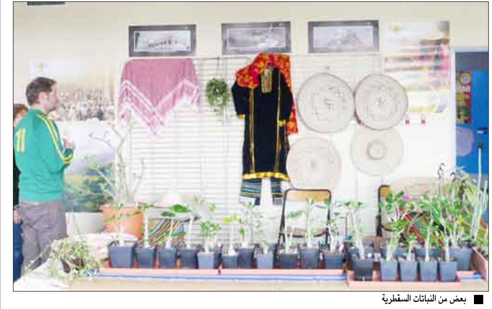
بعض من النباتات سقطرية ذاته على الحفاظ عليه. وأشادت بتعاون المحفظة السياحية بسفارة اليمن بباريس والتي سهلت زيارات العالمة النباتية للمعرض.