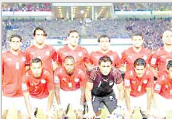
القاهرة / 14 أكتوبر / منايعات:

أكدت مساعدة وزير الخارجية المصري للشؤون الإفريقية السفيرة منى عمر، أن سفارة بلادها في جنوب إفريقيا تتابع بصفة يومية نتائج التحقيقات في حادثة السرقة التي تعرض لها أعضاء المنتخب الأول خلال مشاركتهم في بطولة كأس القارات الثامنة لكرة القدم. ونقلت وكالة الأنباء الشرق الأوسط المصرية عن منى عمر قولها إن شرطة جنوب إفريقيا لا تزال تجري تحقيقاتها حول الأمر، وأن الحكومة هناك حرصت على احتواء هذا الحدث وعدم تصعيده، حرصا على مئة العلاقات بين مصر وجنوب إفريقيا. وأضافت أن وزارة الخارجية تلقت عدة بقرات من سفارة جنوب إفريقيا في القاهرة تشدد فيها بأداء وسلوك بعض «الفاعنة» خلال البطولة، وتتمنى مشاركتهم في بطولة كأس العالم التي تحتضنها