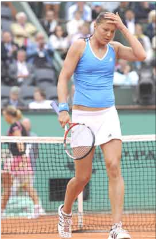
ندن / 14 أكتوبر / منايعات:

تأهلت الروسية دينارا سافينا المصنفة أولى إلى الدور الثالث من بطولة ويمبلدون الإنجليزية، ثالث البطولات الأربع الكبرى لكرة المضرب، بفوزها على البارغوانية روسانا دي لوس ريوس 6-3 و 7-5 يوم أمس الخميس. وتواجه سافينا في الدور المقبل البريطانية إيلينا بلاتاشا أو البلجيكية كيرستن فليكنز. كما تأهلت الأميركية فينوس وليامس المصنفة ثالثة وحاملة لقب إلى الدور الثالث بفوزها على الأوكرانية كاترينا بوندراكوت 6-3 و 6-2. وتواجه فينوس بطله ويمبلدون 5 مرات (2000 و 2001 و 2005 و 2007 و 2008) في الدور المقبل الروسية إيكاتيرينا ماكوروا أو الإسبانية كارلا سواريز. وكذلك عبرت الروسية سيفلانا كوزنتسوفنا المصنفة خامسة إلى الدور الثالث أيضا بفوزها على الفرنسية بولين بارمانتييه 6-1 و 6-3. وتلتقي كوزنتسوفنا، والتي توجت في السادس من الشهر الحالي بلقب بطولة رولان غاروس الفرنسية ثاني البطولات الأربع الكبرى لتضيفه إلى لقب بطولة فلاشينغ ميدوز الأميركية عام 2004، في الدور المقبل مع الألمانية ساين ليسيكي الفائزة على النمساوية باتريسيا ماير 6-2 و 6-4. وفي الدور نفسه، فازت البولندية انيسكا رادفانسكا الحادية عشرة على الصينية شواي بينغ 6-2 و 6-7 (8) و 9-7، والصربية آنا إيفانوفيتش الثالثة عشرة على الإيطالية سارا پراياني 7-5 و 6-1، والصينية نالي التاسعة عشرة على اليلوارية أولغا غوفورتسوفنا 6-2 و 6-6. وفازت الأسترالية سامانثا ستوسور الثامنة عشرة على الألمانية تاتيانا ماليك 6-4 و 7-6 (8) و 6-4، والإسبانية كارلا سواريز على الروسية إيكاتيرينا ماكوروا 7-5 و 6-4 و 6-1.