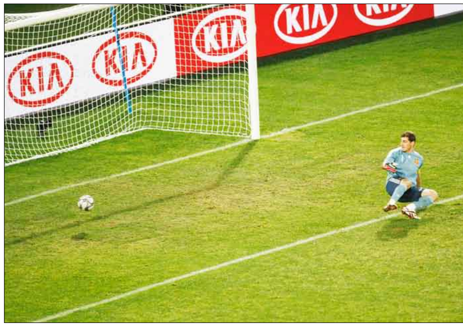
ومصر بطلة إفريقيا بفارق الأهداف، محتلاً المركز الثاني في المجموعة الثانية بـ 3 نقاط «الفراعنة» 3 - صفر في آخر جولات الدور الأول.