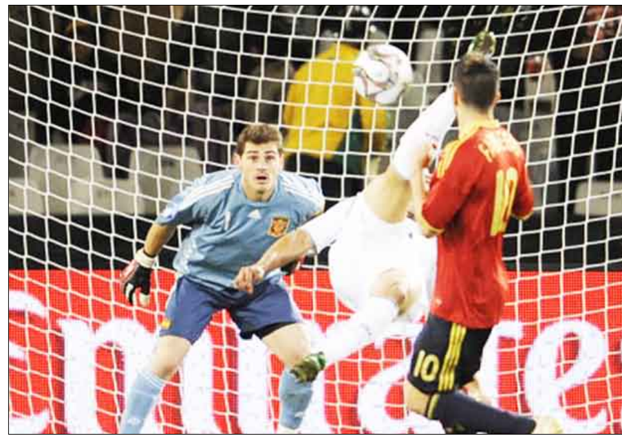
أما المنتخب الأمريكي، فمقل من العيار الثقيل، إذ تفوق على منتخبى إيطاليا وبلجة العالم وصولاً إلى نصف النهائي مفاجأة

جوهانسبورغ / 14 أكتوبر / متابعات: حقق المنتخب الأمريكي لكرة القدم مفاجأة من العيار الثقيل عندما أقصى نظيره الإسباني - بطل أوروبا - من الدور الثاني وتأهل إلى المباراة النهائية بعد فوزه بهدفين نظيفين في اللقاء الذي جمعها على ملعب «فري ستايت» في بوليفورتين يوم أمس الأربعاء في افتتاح الدور نصف النهائي من كأس القارات الثامنة لكرة القدم التي تستضيفها جنوب إفريقيا حتى الـ 28 من يونيو الجاري. وتمكن لاعبو منتخب بلاد «العم سام» من إنهاء السجل الناجح للمنتخب الإسباني، وأصبح هذا الانتصار الذي حطم بها الرقم القياسي في عدد الانتصارات المتتالية بعدما حقق فوزه الخامس عشر على التوالي أمام العراق.