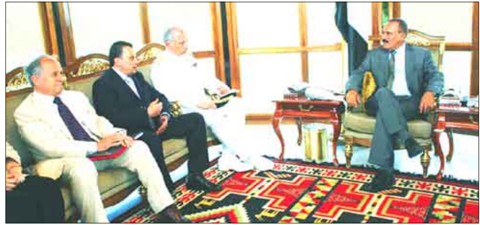
لدى استقبال رئيس الجمهورية لوفد الإيطالي برئاسة رئيس خفر السواحل الإيطالية أمس

صنعاء / سيا: استقبل فخامة الأخ الرئيس علي عبدالله صالح رئيس الجمهورية أمس الوفد الإيطالي برئاسة رئيس خفر السواحل الإيطالية اللواء بورس تيني الذي يزور اليمن حالياً . حدث جرى بحث التعاون بين اليمن وإيطاليا وفي مقدمتها التعاون في مجال خفر السواحل . كما جرى تناول مشروع المرحلة الأولى من شبكة الرادارات البحرية الذي تم تدشينه أمس الأول، بالإضافة إلى الاستعدادات لتنفيذ المرحلة الثانية من المشروع والذي يشمل توفير عدد من القوارب والطائرات العمودية الخاصة بخفر السواحل . وتطرق الحديث خلال اللقاء إلى رغبة عدد