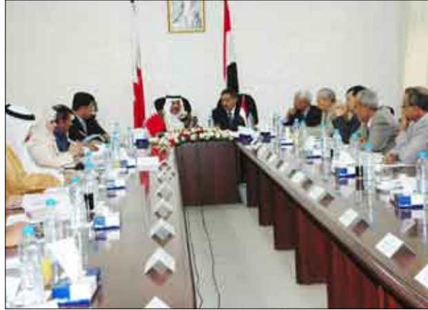
جلسة المحادثات الشورية الرسمية بين اليمن والبحرين

صنعاء / سيا: أكد رئيس مجلس الشورى عبد العزيز عبد الغني ، ونظيره رئيس مجلس الشورى البحريني الأخ علي بن صالح الصالح ، معاتة وعمق العلاقات الأخوية بين اليمن والبحرين. ونوها بالتطور الذي تشهده هذه العلاقات ، بما تحظى به من إسناد الإدارة السياسية لزعيميه البلدين فخامة الرئيس علي عبد الله صالح رئيس الجمهورية وصاحب الجلالة الملك حمد بن عيسى آل خليفة ملك مملكة البحرين. جاء ذلك في كلمتين التين القاهما رئيسا المجلسين خلال جلسة المحادثات الشورية الرسمية التي عقدهت برئاسة صباح أمس الأربعاء بمجلس الشورى. ( التفاصيل من 5 )