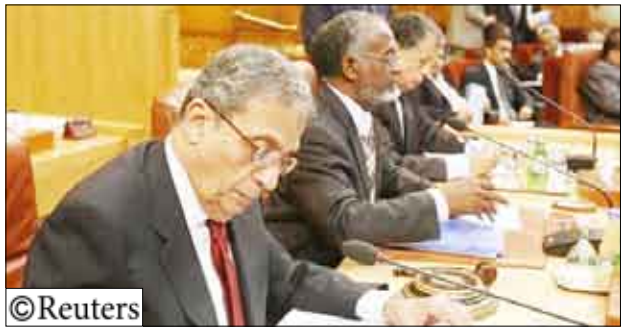
اجتماع وزراء الخارجية العرب

القاهرة/14 أكتوبر/ رويترز: أكد الأمين العام للجامعة الدول العربية عمرو موسى بعد اجتماع استثنائي لوزراء الخارجية العرب في القاهرة أمس الأربعاء ان الوزراء يرون في الخطاب الذي وجهه الرئيس الأمريكي باراك أوباما إلى العالم الإسلامي الذي شدد على أهمية قيام دولة فلسطينية إلى جوار إسرائيل ومطالب بوقف التوسع الاستيطاني في الضفة الغربية بأنه "نافذة أمل" ( التفاصيل من 2 )