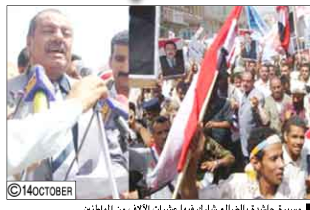
مسيرة حاشدة بالضالع شارك فيها عشرات الآلاف من المواطنين

الضالع/ مثنى الضوري: شهدت محافظة الضالع يوم أمس مظاهرة ومسيره حاشدة شارك فيها عشرات الآلاف من المواطنين للتذود بالاعمال التخريبية التي تقوم بها العناصر الخارجة على النظام والقانون في بعض المناطق بهدف زعزعة الأمن والاستقرار وإفلاق السكينة العامة وإعاقة التنمية ونشر بذور الفتنة والفرقة والشحنات بين أبناء الوطن الواحد. وفي ساحة مستشفى الضالع التخصصي حيث استقرت جموع المظاهرين حيا محافظ محافظة الضالع جموع المظاهرين الذين تقاطروا من جميع المديريات منذ الصباح الباكر للمشاركة في هذه المسيرة الوندية الحاشدة. وصدر عن المسيرة بيان جماهيري أكد ان الضالع التي كانت منبع الفعل الوطني الحودوي الصادق ومنبع الوفاء للنضال الثوري ستظل الدرر المنيعة والقوية للوطن ووحدة ومجزاته ، وستظل بمواقفها الثابتة إلى جانب القيادة السياسية.. مشيرين إلى أن العناصر التي تطلق النعرات المناطقيه والأصوات التي تسيء إلى التاريخ النضالي والوطني والوحدوي لأبناء الضالع لا تعبر إلا عن نفسها.. عطلين إرادتهم واستكراهم الشديدين لكل الأعمال الخارجة على النظام والقانون ورفع الشعارات المناطقيه وبت سموم الحقد والكراهية وقطع الطرقات وبت الخوف والهلع بين المدنيين السالمين والتخريب على أعمال الشعب والتخريب. ( التفاصيل من 4 )