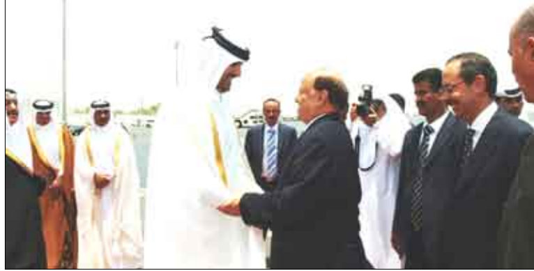
نائب الرئيس مغادراً مطار الدوحة في ختام جولة خليجية

صنعاء / الوحدة / سيا: أكد الأخ عبد ربه منصور هادي ، نائب رئيس الجمهورية أن زيارته لدول مجلس التعاون لسدول الخليج العربية كانت ناجحة بشكل القاطب، مشيراً إلى انه وجد كامل التفهم من قادة دول الخليج وبمسورة تبعث على الاعتزاز باهتمام إخواننا في دول الخليج بقضايا اليمن وحقه في الحفاظ على وحدته وأمنه واستقراره. وفي اللقاء أكد ولي العهد القطري معاتة العلاقات الأخوية بين البلدين والشعبين الشقيقين ، مؤكداً انها وطيدة وتاريخية - مجدداً موقف قطر شملت السعودية والكويت والبحرين والإمارات وقطر ، نقل خلالها رسائله من فخامة الأخ الرئيس علي عبدالله صالح ، رئيس الجمهورية إلى إخوانه قادة دول الخليج تتعلق بالعلاقات ( التفاصيل من 3 )