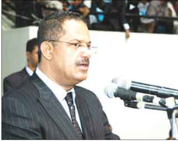
رئيس الوزراء لدى حضوره حفل تخرج الدفعة السابعة من كلية المجتمع بصنعاء أمس

صنعاء/سيا: أكد الدكتور علي محمد مجور ، رئيس مجلس الوزراء ان الدولة تنظر إلى التعليم الفني والتدريب المهني وفق رؤية استراتيجية انطلاقاً من دوره الهام في خدمة التنمية والحد من البطالة ، مثنياً الدور الإيجابي لكليات المجتمع في إعداد الكادر البشري وتزويده بالعلوم النظرية والتطبيقية في فروع الإدارة والتكنولوجيا والمهن العصرية. ولدى حضوره أمس حفل تخرج الدفعة السابعة لكلية المجتمع بصنعاء ، أوضح رئيس الوزراء ان كليات المجتمع تعد إحدى الخطوات الهامة التي تسعى من خلالها الحكومة الى تنوع وتطوير مخرجات التعليم العالي التخصصي وإيجاد الكادر المؤهل المتسلح بالمعارف الفنية والمهارات التطبيقية في شتى المجالات بما يلبي احتياجات المجتمع وسوق العمل المحلية والاقليمية. وحث مجور وزارات التعليم الثلاث على تعزيز التعاون والتكامل في مستويات التعليم العام والمهني والعالي وحقل الترابط في الاهداف والسياسات لما من شأنه إزالة الهوة بين مخرجات التعليم وجعل الأخيرة أكثر ارتباطاً بالتنمية واحتياجاتها من الكوادر البشرية الفاعلة. ( التفاصيل من 5 )