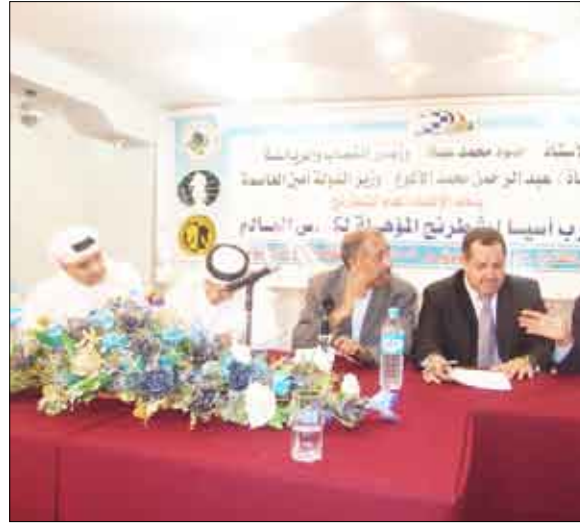
الاجتماع الفني للبطولة