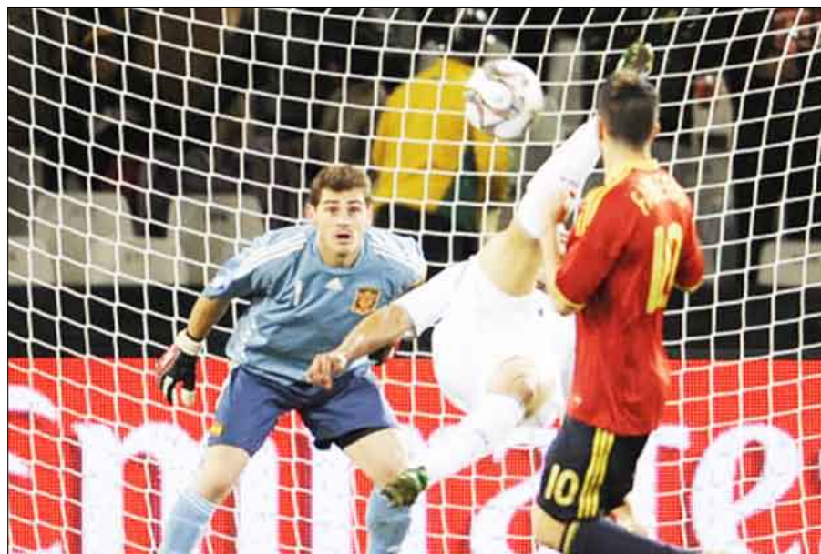
أما المنتخب الأمريكي، فمقل من العيار الثقيل، إذ تغرق على وصوله إلى نصف النهائي مفاجأة منتخبي إيطاليا بطلة العالم