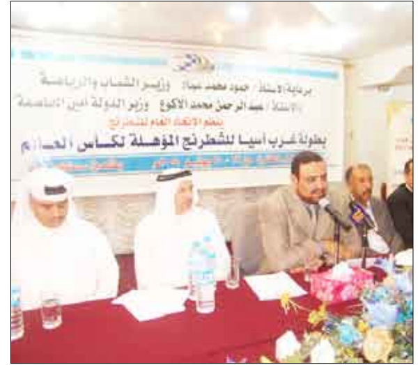
وزير الشباب يفتتح البطولة