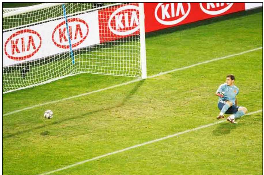
ومصر بطلة إفريقيا بفارق الأهداف، محتلاً المركز الثاني في المجموعة الثانية بثلاث نقاط «الفرانسة» 3 - صفر في آخر جولات الدور الأول.