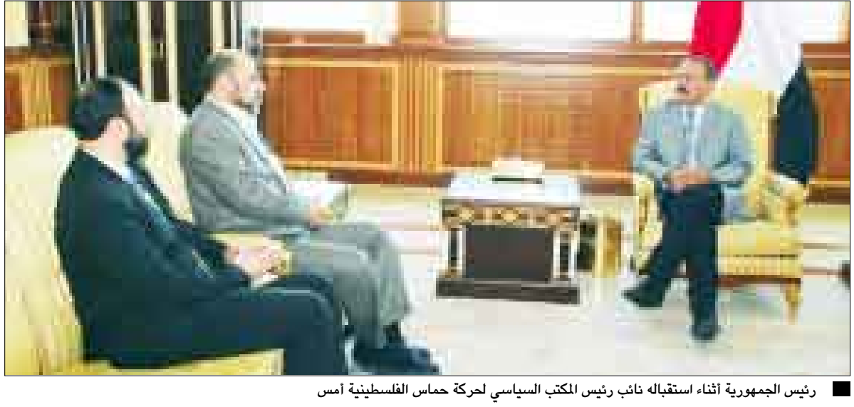
رئيس الجمهورية أثناء استقباله نائب رئيس المكتب السياسي لحركة حماس الفلسطينية أمس

استقبل فخامة الأخ الرئيس علي عبدالله صالح رئيس الجمهورية أمس نائب رئيس المكتب السياسي لحركة حماس الفلسطينية موسى أبو مرزوق الذي يزور اليمن حالياً.