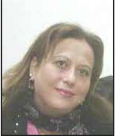
الشاعرة السورية هيفاء فويتي