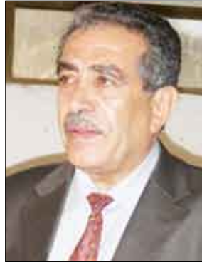
محمد ابوبكر الفلحي

صنعا/ سيأ : تشترك اليمن في افتتاح مهرجان الأردن الثقافي 2009 المقرر انطلاقه في السابع من يوليو القادم، وتسلم وزير الثقافة الدكتور محمد ابوبكر الفلحي أمس دعوة من وزير الثقافة بالملكة الأردنية الدكتور صبري الربيعات لحضور افتتاح المهرجان الذي تشارك فيه 43 دولة من مختلف أنحاء العالم.