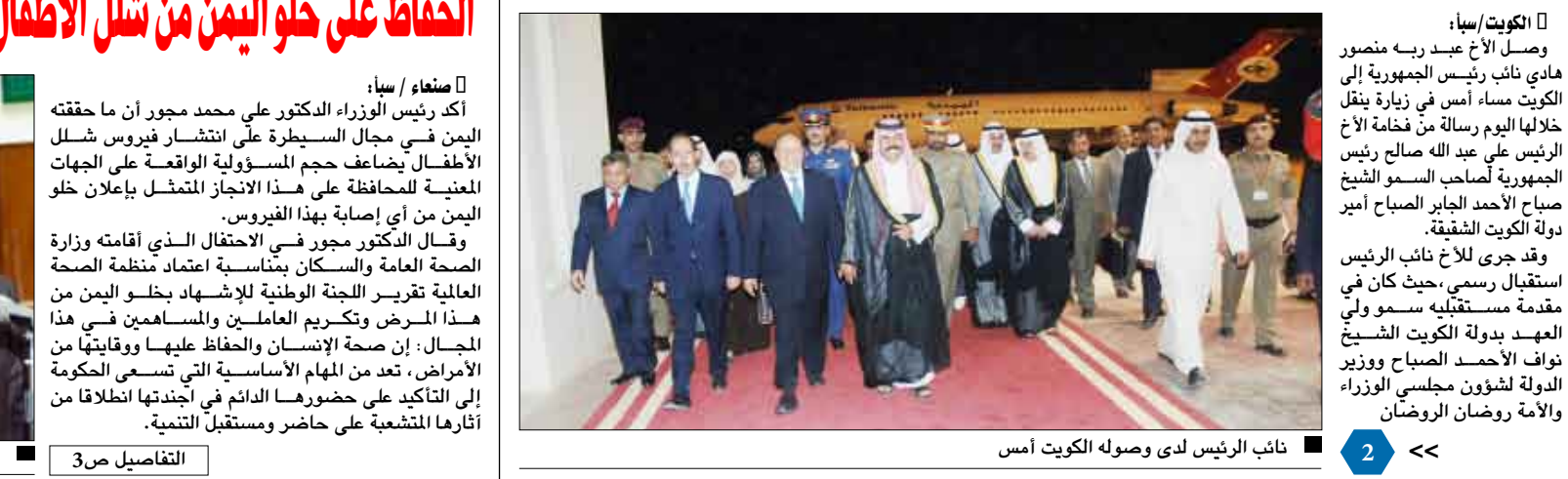
نائب الرئيس لدى وصوله الكويت أمس