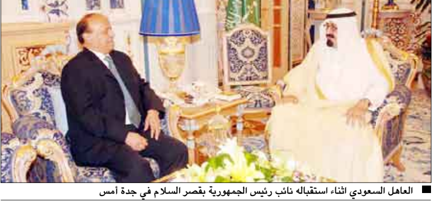
العاهل السعودي أثناء استقباله نائب رئيس الجمهورية بقصر السلام في جدة أمس

تسلم خادم الحرمين الشريفين الملك عبدالله بن عبدالعزيز - ملك المملكة العربية السعودية أمس رسالة من أخيه فخامة الرئيس علي عبدالله صالح ، رئيس الجمهورية تتعلق بالعلاقات الأخوية الحميمة بين البلدين الشقيقين وأفاق تعزيز التعاون المشترك في المجالات كافة بالإضافة إلى القضايا ذات الاهتمام المشترك .