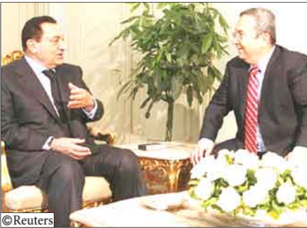
الرئيس المصري حسني مبارك مع وزير الدفاع الإسرائيلي إيهود بارك بالقاهرة يوم أمس الأحد

بهيوية وأن يتخلصوا عن حق عودة اللاجئين. ولم يتعهد بوقف التوسع في المستوطنات اليهودية في الضفة الغربية المحتلة. وذكر الرئيس المصري حسني مبارك أن مطلب إسرائيل الاعتراف بها كدولة يهودية يقوض جهود السلام. وقال إنه أبلغ نتنياهو الذي زار مصر الشهر الماضي بأن محادثات السلام يجب أن تستأنف من النقطة التي انتهت عندها. وذكرت وكالة أنباء الشرق الأوسط أن مبارك اجتمع مع بارك بعد قليل من وصوله إلى القاهرة في زيارة تستغرق بضعة ساعات. وأُفيد أن هدف الزيارة هو "بحث جهود إحياء عملية السلام في الشرق الأوسط والأوضاع في الأراضي الفلسطينية والجهود المبذولة من جانب مصر لبدء مفاوضات جادة بين الجانبين