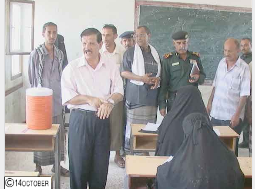
تدشين الإمتحانات في حجة