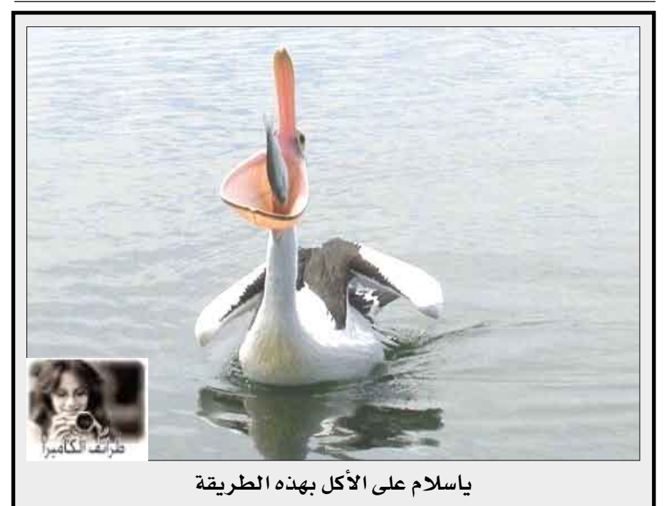
ياسلام على الأكل بهذه الطريقة

صدق أو لا تصدق هذا القزم الصيني الذي يدعى بنج يبلغ طوله 74 سنتيمتراً، ولا يزال يحمل لقب أقصر رجل في العالم، بينما يحمل لقب أطول رجل في العالم الأوكراني ليوين ستانديك الذي يبلغ طوله مترين و 36 سنتيمتراً وعشرى السنتمتر ويفضل عشري السنتمتر تفوق على الصيني الذي كان يحمل لقب مؤخرًا، ويظهر بنج في الأضواء في العالم في صورة مع حذاء أطول رجل في العالم في طوكيو.