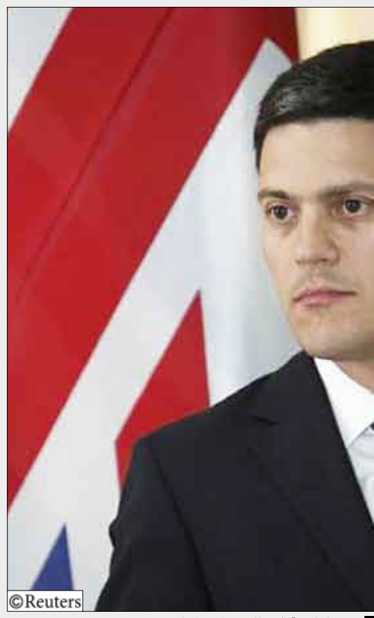
وزير الخارجية البريطاني ديفيد ميليباند