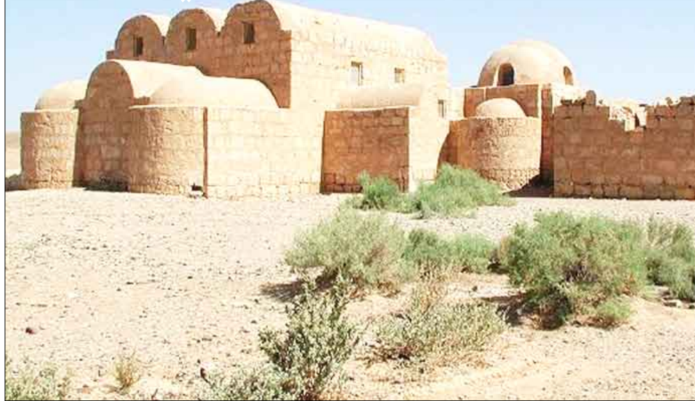
صورة خلفية للقصر وتضخ الأقواس الثلاثة