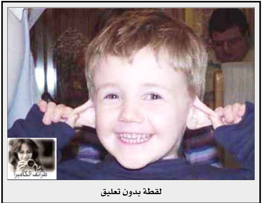
لقطة بدون تعليق

المانيا / منابيات: في واقعة غريبة من نوعها، ذكرت السلطات الألمانية انه تبين ان ثعلباً هو اللص الغامض الذي يسرق أكثر من 100 حذاء في بلدة فوهرين الصغيرة غربي ألمانيا. وعثر عامل غابات بطريق الصدفة على أحذية متناثرة بالقرب من وكرك الثعلب واكتشف حفنة من الأحذية في الجحر سرق حديثاً أثناء الليل من أمام أبواب المنازل المحلّة. وقال متحدّد باسم الشرطة المحلية "كان هناك كل شئ يبدأ من أحذية نساء الى أجهزة تدريب". وأضاف "وجدنا ما بين 110 إلى 120 حتى الآن. يبدو ان ثعلباً سرقتهم من أجل ان يلبس صفارها بهم". وقال ان العديد من الأحذية كانت بلا أربطة إلا انها كانت في حالة جيدة واصحابها شعروا بالبهجة لاستعادتها. وأضاف انه ليست هناك أي نية لاتخاذ إجراءات ضد المتهم.