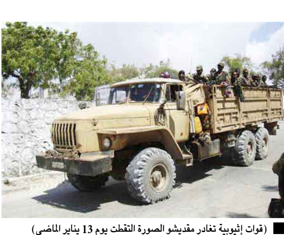
قوات إثيوبية تغادر مقديشو الصورة التقطت يوم 13 يناير الماضي

أديس أبابا/14 أكتوبر/باري مالون: نفت إثيوبيا يوم أمس السبت إرسال جنود إلى الصومال بعد أن قال سكان صوماليون يوم الجمعة إنهم شاهدوا قوات مدججة بالسلاح من جارتهم الواقعة في القرن الإفريقي في منطقتين مختلفتين على الأقل. وقال وزير الإعلام بالحكومة الإثيوبية بركات سايمون للصحفيين أن المتمردون اختلقوا هذه التقارير في محاولة لحشد التأييد الشعبي لمحركهم للإطاحة بحكومة الرئيس شيخ شريف أحمد. وأوضح "إثيوبيا تدافع عن حدودها. ليست لدينا نية للعودة إلى الصومال. عندما نقرر دخول الصومال سنطلب العالم بأننا قررنا أن ندخل بناء على مصلحتنا الوطنية". وعزت إثيوبيا الصومال في أواخر عام 2006 لطرد حركة إسلامية من العاصمة. وكان الرئيس الصومالي الحالي يتولى منصباً بارزاً في هذه الحركة وفر إلى المنفى لكنه انضم إلى عملية سلام العام الماضي وانتخب رئيساً للبلاد في يناير. وتقول أديس أبابا أنها تدعم الحكومة الجديدة لكنها تشعر بالقلق من المتشددين الذين لهم صلات بتنظيم القاعدة لأنهم يسيطرون على مناطق كبيرة من الصومال وهددوا بزراعة الاستفراغ في إثيوبيا وكينيا. وأشار وزير الإعلام الإثيوبي "باعتقد أن سبب (التقارير) هو أن المتطرفين يخسرون أراض ويخسرون بان في استطاعتهم تعبئة الناس من خلال الإعلان للامة بان الإثيوبيين يتدخلون (في شؤون البلاد).. ولها السبب يوجهون هذه الاتهامات كأداة لحشد التأييد. وكانت القوات الإثيوبية مكروهة على نحو كبير خلال وادت المناوشات التي تتدل