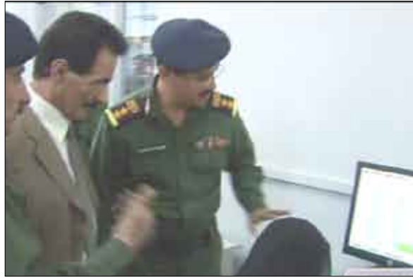
..ويتفقد سير العمل في مصلحة الهجرة والجوازات