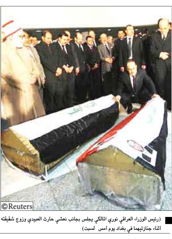
رئيس الوزراء العراقي نوري المالكي يجلس بجانب نعش حارث العبيدي وزوج شقيقته أثناء جنازتهما في بغداد يوم أمس السبت

المدافعين عن حقوق الإنسان. وانتقد العبيدي مؤخرًا الاختراقات التي قيل أنها تحدث داخل السجون العراقية وعمليات الاعتداء الجنسي والتعذيب وانتزاع الاعترافات بالقوة التي تمارس ضد السجناء. كما طالب العبيدي مراراً بإطلاق سراح جميع السجناء العراقيين من السجن. ووصف عبد المهدي نائب رئيس الجمهورية العبيدي بأنه "كان احد اركان العملية السياسية والاعتدال السياسي وركن مهم في مجلس النواب". وكانت تحذيرات صدرت من قبل سياسيين ومراقبين عن عراقيين وأجانب حذرت من احتمال تزايد وتيرة العنف في المرحلة التي ستعقب انسحاب القوات الأمريكية من المدن والقرى العراقية بنهاية الشهر الجاري وقبل الانتخابات البرلمانية التي ستجري ببداية العام المقبل. وأوضح النائب المستقل الشيعي الشيخ خير الله البصري أن اغتيال العبيدي يراد منه "إعادة العملية إلى سابق عهدها المزمّت". ووصف الاغتيال بأنه "اغتيال لمعادلة واعتقال لحالة التوافق وحالة الجمع المراد تحقيقها بين العراقيين". ولم تشهد مدينة بغداد ومنذ عام 2003 جنازة رسمية كالتى جرت للعبيدي. ولم تعلن أي جهة حتى الآن مسؤوليتها عن الاغتيال.