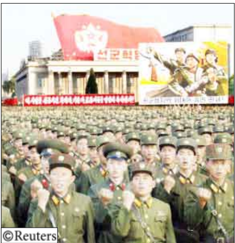
عرض القوات المسلحة الكورية الشمالية

لأواشنطن/سول 14 أكتوبر/رويترز: أعلنت الولايات المتحدة يوم أمس السبت أن على كوريا الشمالية وقف "الإجراءات الاستفزازية" والعودة على الفور للمحادثات السياسية المثمرة والخاصة بالبرنامج النووي لبيونجيانج. وذكر مستشار بوزارة الخارجية الأمريكية عندما طلب منه التعقيب على التهديد الأخير من بيونجيانج "على كوريا الشمالية وقف الإجراءات الاستفزازية والحرب الكلاسيكية والعودة دونما شروط للعلية السادسة". وكانت كوريا الشمالية قد ذكرت أمس السبت أنها ستبدأ برامج لتصنيع اليورانيوم وتعدت باستخدام كل اليوتونيوم لديها في تصنيع أسلحة ردا على عقاب فرضته عليها الأمم المتحدة لإجرائها تجربة نووية. وهدت بيونجيانج أيضا باتخاذ إجراءات عسكرية إذا حاولت الولايات المتحدة وحلفاؤها عزلها. وأصدر مجلس الأمن الدولي قراراً يوم الجمعة يحظر كل