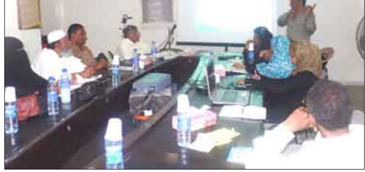
من ورشة العمل حول تنفيذ مشروع نشر ثقافة حقوق الإنسان

عدن/الإسلام العسيري: عقدت يوم أمس في البيت الثقافي للشباب مؤسسة المستقبل بمشاركة ثلاثين مشاركاً من شباب وأكاديميين وأعضاء مجالس محلية وقانونيين وإعلاميين ورؤساء بعض منظمات الانتهاكات وتقديم المساعدة القانونية في مجال الحقوق الاقتصادية والاجتماعية والثقافية في محافظات (عدن - لحج - الضالع - أبين - شبوة) والذي يقوم بتنفيذه مركز اليمن لدراسات حقوق الإنسان بالتعاون مع مؤسسة المستقبل بمشاركة ثلاثين مشاركاً من شباب وأكاديميين وأعضاء مجالس محلية وقانونيين وإعلاميين ورؤساء بعض منظمات المجتمع المدني، وسيستمر من ابريل 2009 / أغسطس 2010. وتعرف المشاركون على الضمانات القانونية التي تحمي الأفراد والمجموعات من الإجراءات التي تتدخل في الحريات الأساسية والكرامة الإنسانية. كما أبرز المشروع الذي قدمه مركز اليمن لدراسات حقوق الإنسان أهم الانتهاكات التي يتعرض لها الإنسان فيما يتعلق بمجالات العمل والبطالة والسكن والبيئة الصحية والتعليم وقضايا اجتماعية مختلفة، ويلزم قانون حقوق الإنسان الحكومات بفعل