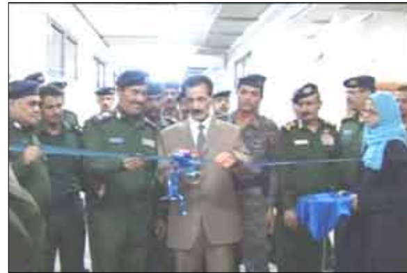
وزير الداخلية يمدن الإصدار الآلي