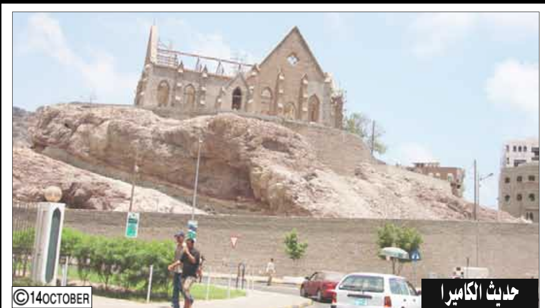
حديث الكاميرا تصوير وتعليق/ علي الدرب: مشروع ترميم مبنى المجلس التشريعي سابقاً استقبله الجميع بارتياح نظراً لأهميته كمنى تاريخي مميز إلا أن هذا المشروع مثل غيره من المشاريع الكثيرة المرتبطة بالترميم والتأهيل وكثير من الحدايق والطرق في عدن تبدأ خطواتها الأولى سريعة وفجأة يسير العمل ببطء شديد ثم التوقف الكامل فمن المسؤول عن ذلك ؟