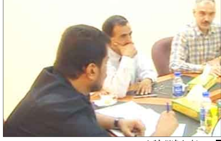
.. ويتأسر لجنة المتابعة للمشروع