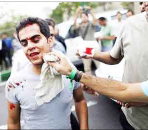
إيراني من أنصار المرشح مير حسين موسوي أصيب أثناء احتجاج طهران يوم أمس السبت

وهذا لنتائج رسمية أولية فقد خسّر موسوي أمام الرئيس الإيراني محمود أحمدي نجاد بفارق كبير في انتخابات الرئاسة الإيرانية التي جرت يوم الجمعة. وقال موسوي في بيان "أحتج بشدة على العديد من الانتهاكات الواضحة وأحذر من أني لن أستسلم لهذه التمثيلية الخطيرة. مثل هذا التصرف من بعض المسؤولين سيهدد أركان الجمهورية الإسلامية وسيؤدي إلى استبداد". وذكرت اللجنة الانتخابية الإيرانية أن أحمدي نجاد فاز بغزوة ناسة ثانية مدتها أربع سنوات بحصوله على 63.4 في المائة من الأصوات مقابل 34.7 بالمائة لموسوي بعد فرز كل الأصوات تقريباً. وأضاف أن نحو 80 بالمائة من الناخبين المسجلين أدلوا بأصواتهم. ووصف موسوي الذي صرح في وقت متأخر من مساء الجمعة بأنه فاز بانتخابات الترتية الرسمية بأنها "صادمة". وقال في البيان "الناس الذين انتظروا في صفوف طويلة يطمعون... لن أدلوا بأصواتهم... لقد فوجئنا ويتابعون خداع... المسؤولون وهم يبتلعون النتيجة". وأشار إلى أنه سيكثف "الأسرار وراء هذه التمثيلية الخطيرة... واقترب على المسؤولين وقف هذا الاتجاه قبل أن يتأخر الوقت والعودة إلى أرض القانون والحفاظ على حقوق المواطنين". وكان من المقرر أن يعقد مؤتمراً صحفياً في طهران يوم أمس السبت ولكن الشرطة خارج المبنى طلبت من الصحفيين الابتعاد قاطنة أن المؤتمر الصحفي التي.