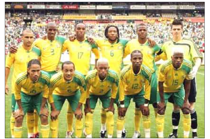
منتخب جنوب أفريقيا