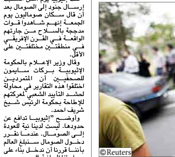
إيراني من أنصار المرشح مير حسين موسوي أصيب أثناء احتجاج طهران يوم أمس السبت

وهذا لنتائج رسمية أولية فقد خسّر موسوي أمام الرئيس الإيراني محمود أحمدي نجاد بفارق كبير في انتخابات الرئاسة الإيرانية التي جرت يوم الجمعة. وقال موسوي في بيان "أحتج بشدة على العديد من الانتهاكات الواضحة وأحذر من أني لن أستسلم لهذه التمثيلية الخطيرة. مثل هذا التصرف من بعض المسؤولين سيهدد أركان الجمهورية الإسلامية وسيؤدي إلى استبداد". وذكرت اللجنة الانتخابية الإيرانية أن أحمدي نجاد فاز بغزوة ناسة ثانية مدتها أربع سنوات بحصوله على 63.4 في المائة من الأصوات مقابل 34.7 بالمائة لموسوي بعد فرز كل الأصوات تقريباً. وأضاف أن نحو 80 بالمائة من الناخبين المسجلين أدلوا بأصواتهم. ووصف موسوي الذي صرح في وقت متأخر من مساء الجمعة بأنه فاز بانتخابات الترتية الرسمية بأنها "صادمة". وقال في البيان "الناس الذين انتظروا في صفوف طويلة يطمعون... لن أدلوا بأصواتهم... لقد فوجئنا ويتابعون خداع... المسؤولون وهم يبتلعون النتيجة". وأشار إلى أنه سيكثف "الأسرار وراء هذه التمثيلية الخطيرة... واقترب على المسؤولين وقف هذا الاتجاه قبل أن يتأخر الوقت والعودة إلى أرض القانون والحفاظ على حقوق المواطنين". وكان من المقرر أن يعقد مؤتمراً صحفياً في طهران يوم أمس السبت ولكن الشرطة خارج المبنى طلبت من الصحفيين الابتعاد قاطنة أن المؤتمر الصحفي التي.