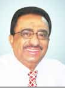
الشاعر / أحمد الحبيشي

أجمل الأجزاء عاشت في دموعك أجمل الأفراح شعثت من بريق ماراته العين إلا في دموعك أعذب الوصل تعاطينا صبرا في لقاء الدمع والشوق المسافر ونسجناه لحافاً ناعساً في دموعك ••• كمكثي الدمع وجودي بالعطاء وامسح الجرح بأنفاس الرجاء وسلي القلب عن الذكرى فقد كبرت فيه وصارت كبرياء واعشقي الفجر زماناً واهدا وانسجي في الضوء خيط الإنتماء