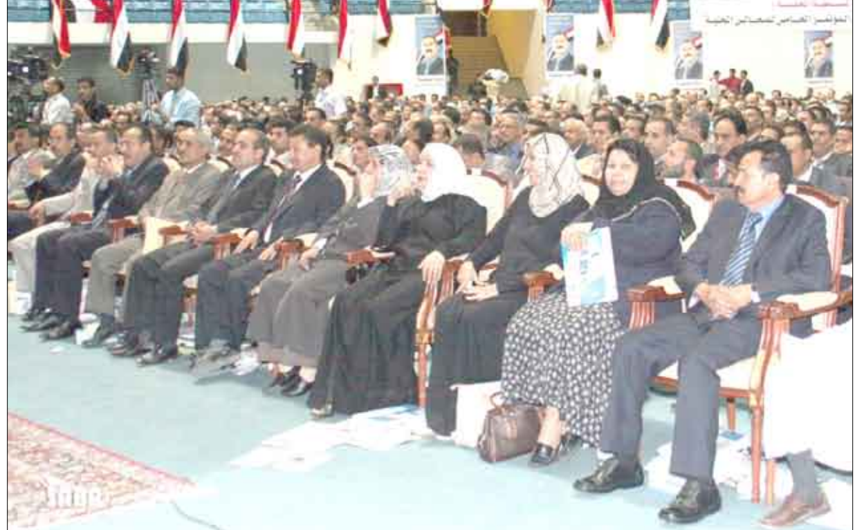
جانب من الحضور في مؤتمر السلطة المحلية بأمانة العاصمة