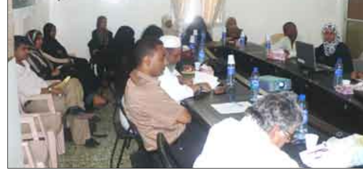
جانب من المشاركين في الورشة