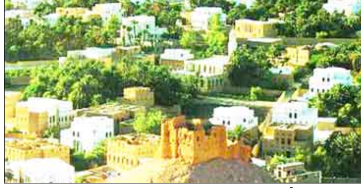
صورة من مدينة سبأ

صنعاء/سبأ، تعد اللجنة الفنية الخاصة بفعاليات تريم عاصمة الثقافة الإسلامية 2010 اليوم الأحد بصنعاء اجتماعاً لها برئاسة رئيس اللجنة عضو اللجنة العليا وزير الثقافة الدكتور محمد أبو بكر الفلحي. ويناقش الاجتماع التصورات الخاصة بالفعاليات، ومنها فعاليات الافتتاح بالإضافة إلى التصورات الخاصة بمشاريع البنى التحتية في مختلف المجالات التنموية بترميم ما يليق بهذه المدينة التاريخية وبدورها الفكري وبما يبرز اليمن وارتها الحضاري.