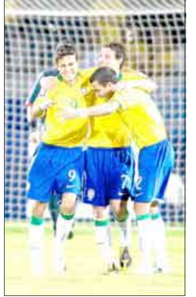
لقطات من المباراة

وتقدمت فنزويلا عبر جيانكارلو مالدونادو (9)، ورتت الأوروغواي يهدين لويس سواريز (60) ودييغو فورلان (73)، قبل أن يدرك خوسيه مانويل راي التعادل لأصحاب الأرض (76). وعقدت كولومبيا جراح البيرو صاحبة المركز الأخير وفازت عليها بهدف وحيد لراميرال فالكاو غارسيا (25).