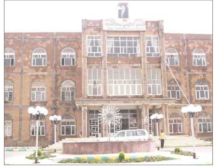
الجمع الحكومي بحجة