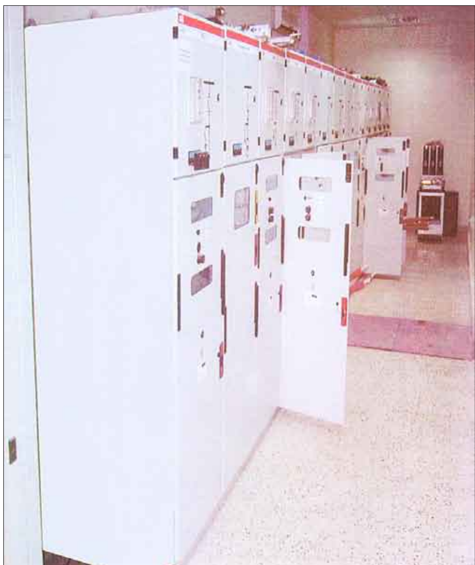
نموذج احدي محطات التوليد الجديدة