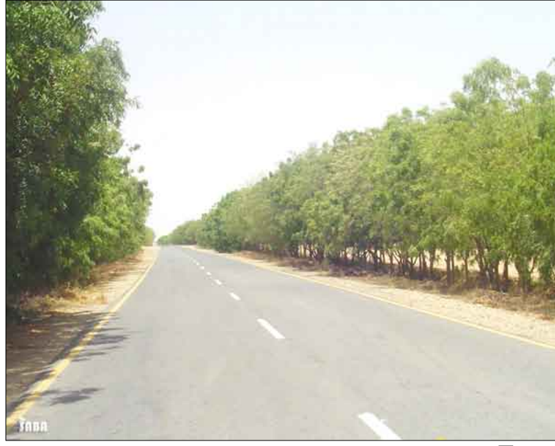
منظر من إحدى مديريات حجة