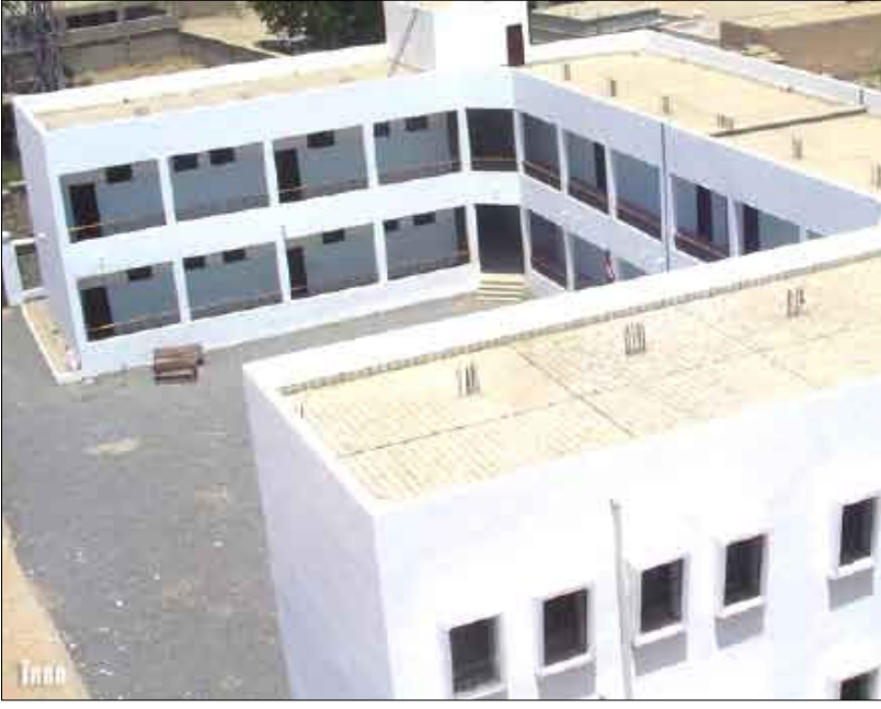
أحدى المدارس في مديرية حجة