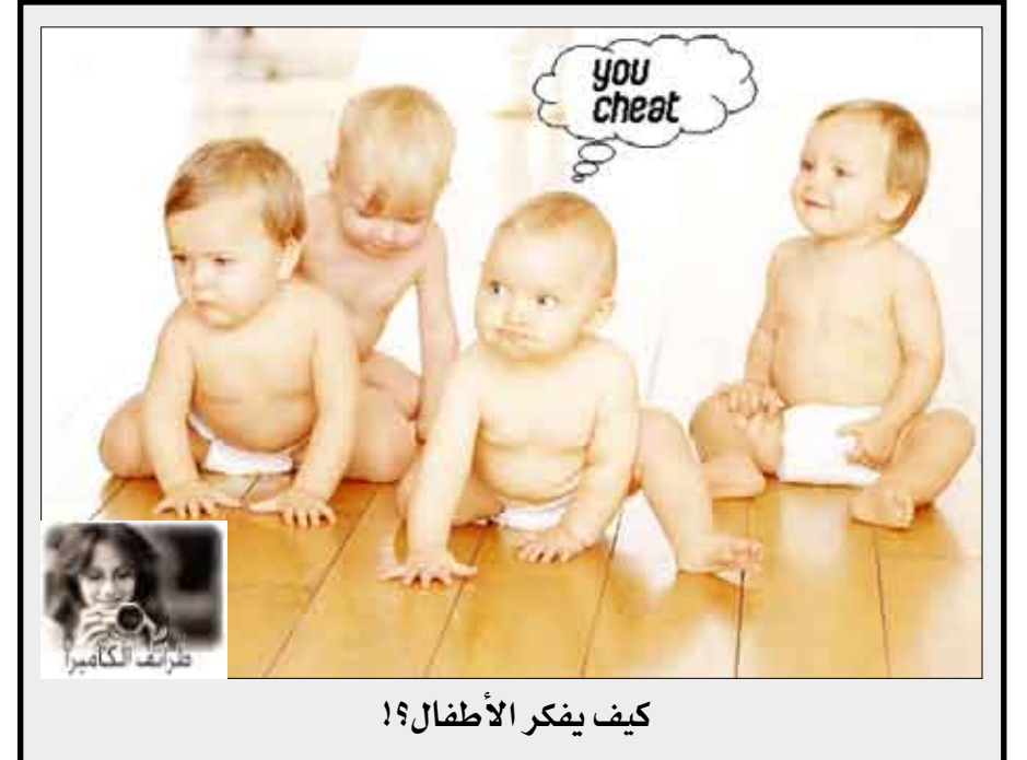
كيف يفكر الأطفال !؟