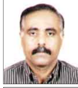
نبيل علي أنعم

"اعتقد أن هذا العهد هو الأكثر تقبلاً لنشر الحقائق، فقدرتي معه قد اقتنعتني بأن الأخ الرئيس على عبدالله صالح قد جاء إلى السلطة بنفسه بسيطة وعقيلة متفتحة ما جعله قادراً على امتلاك الرؤية الواضحة والسليمة لطبيعة الترابط التاريخي في مسار الحركات الوطنية للشعب.. وهذه الرؤية الواضحة والسليمة قد جعلت في نفسه مناعة ضد غُفد الادعاء لبطولات لم يبق بها.. وضد الشعور بالنقص الذي يصاب به بعض من ليس لهم جذور في حركة النضال الشعبي التي جاءت الثورة امتداداً طبيعياً ومختلفاً لها. ذلك أن الأخ الرئيس لا يدعي أنه صانع الثورة ومفجرها أو أنه مفكرها العبقري للمهم.. ولكنه ببساطة الإنسان اليمني الأصلي، ويتواضع الوطني الصادق يرى أنه مجرد جندي من جنود الثورة الذين ساهموا في حمايتها والدفاع عنها حتى يحقق لها النصر.."