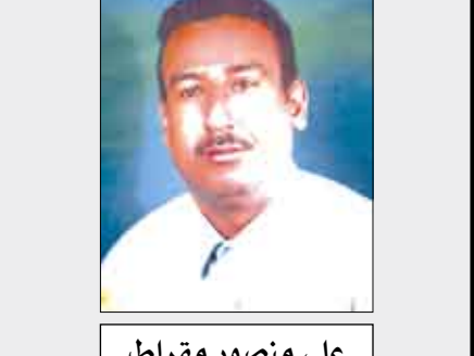
علي منصور مقارط

التوجهات الصريحة والواضحة التي وجهها بالأمس فخامة الأخ الرئيس / علي عبدالله صالح رئيس الجمهورية إلى المختصين والمسؤولين بمحافظة عدن والتي تضمنت قضية الأراضي وإيجاد المعالجات الصحية والعدالة لهذه المشكلة ورفع كسب باسماء المستفيدين من الأراضي في الجمعيات وغيرها ونشره للرأي العام عبر وسائل الإعلام ( الصحافة ) .