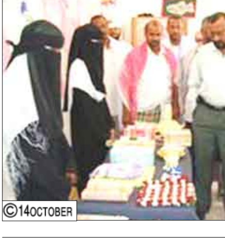
مدير عام سيئون يفتتح معرض الرسومات

مستقبلاً الاعتماد على أنفسهم في تسيير شئون حياتهم. وأبدى الحاضرون عقب جولتهم بالمعرض إعجابهم بما احتواه من عروضات مقدرين جهود المعلمين والمعلمات في تزويد أعداد المتخفين بالمدرسة المسهرات المعرفية التي كشفت إبداعاتهم في كثير من المجالات وأكدت ضرورة الاعتناء بهذه الشريحة انطلاقاً من الواجب الديني والاجتماعي الذي يحتم على كافة أفراد المجتمع تقديم مختلف أوجه المساعدة اللازمة التي تمكنهم من أن يكونوا عناصر فاعلة مستقبلاً. وأعلن مدير مؤسسة المسيلة للخدمات النفعية تبرعه بمائة ألف ريال دعماً لأنشطة وبرامج المدرسة والجمعية.. مبدياً استعداداته لتقديم مزيد من المساعي مع كافة الجهات الأخرى لتستطيع الجمعية من تنفيذ خططها وبرامجها التربوية والتعليمية التي تستهدف شريحة الصم والبكم في كافة مناطق الوادي والمصحاء.