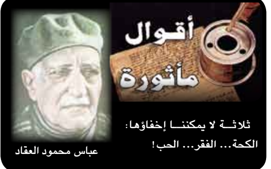
عباس محمود العقاد

في الجسم لدى النساء كهرمون الاستروجين، مما يزيد مخاطر تعرضهن لأزمات قلبية ويسبب اضطرابات في نبضات القلب. ويشتهر علماء في أن تكون المادة تعدل الجينات البشرية الخاصة بالحمل، مما يؤثر على الخصوبة عند النساء.