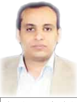
الشاعر / محمد الدحيات