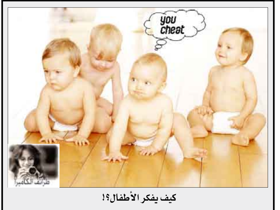
كيف يفكر الأطفال؟

الذكاء في اختبارات الذكاء تفوق نتيجة 98% من السكان. اكتساب المعرفة باستمرار وفقا لجريدة «الوطن» الكويتية.